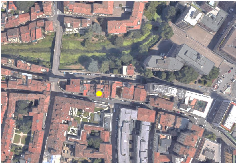
Unità immobiliare in condominio in via San Fermo 96 e Riviera dei Mugnai n. 25 |PD|