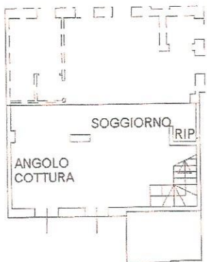
PIANO TERRA H.2.70

Catasto dei Fabbricati - Situazione al 31/05/2017 - Comune di MONSELICE (F.382) - Foglio: 20 Particella: 1120 - Subalterno 6 - VIA VALLI n. 21 piano: T-1 interno: A;