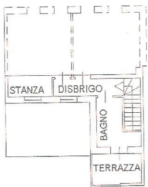
PIANO PRIMO H. 2.70