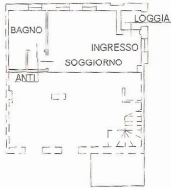
PIANO TERRA H.2.70