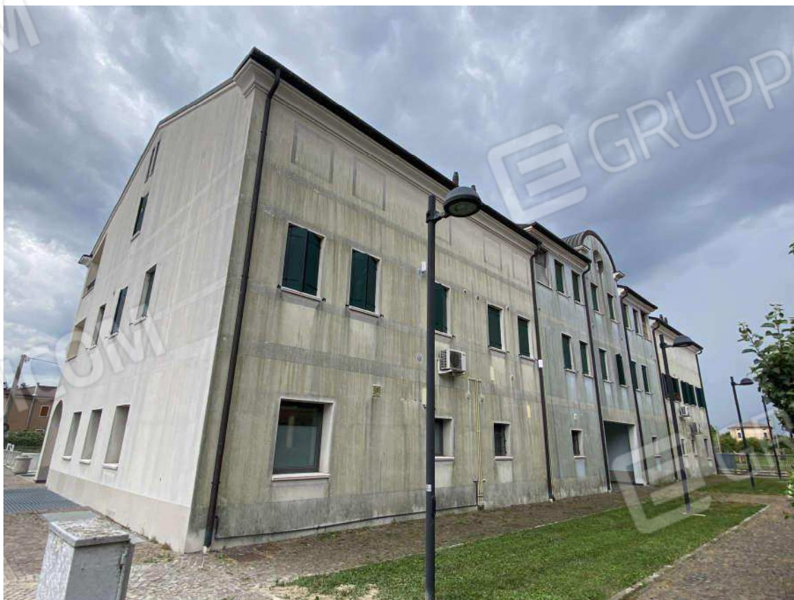
Foto 4 - esterno dell'edificio