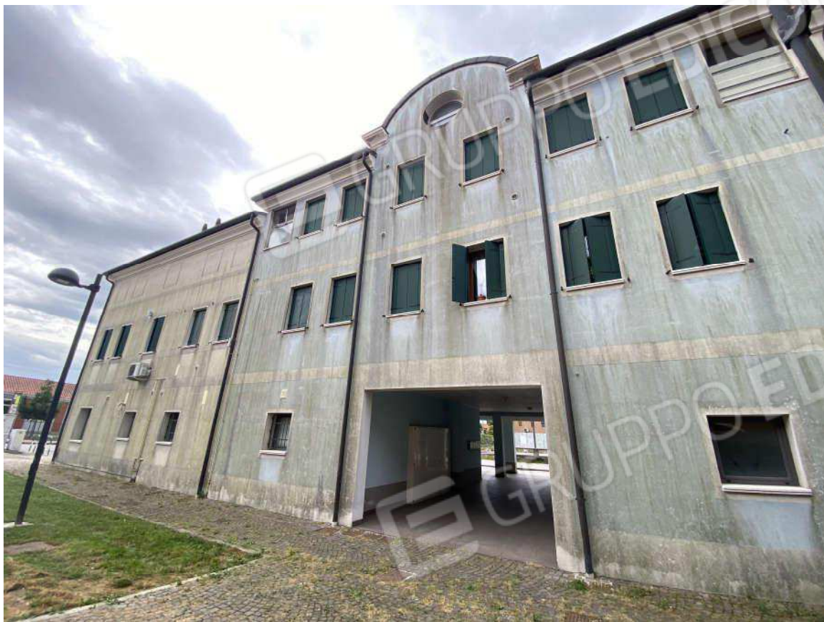
Foto 3 - esterno dell'edificio