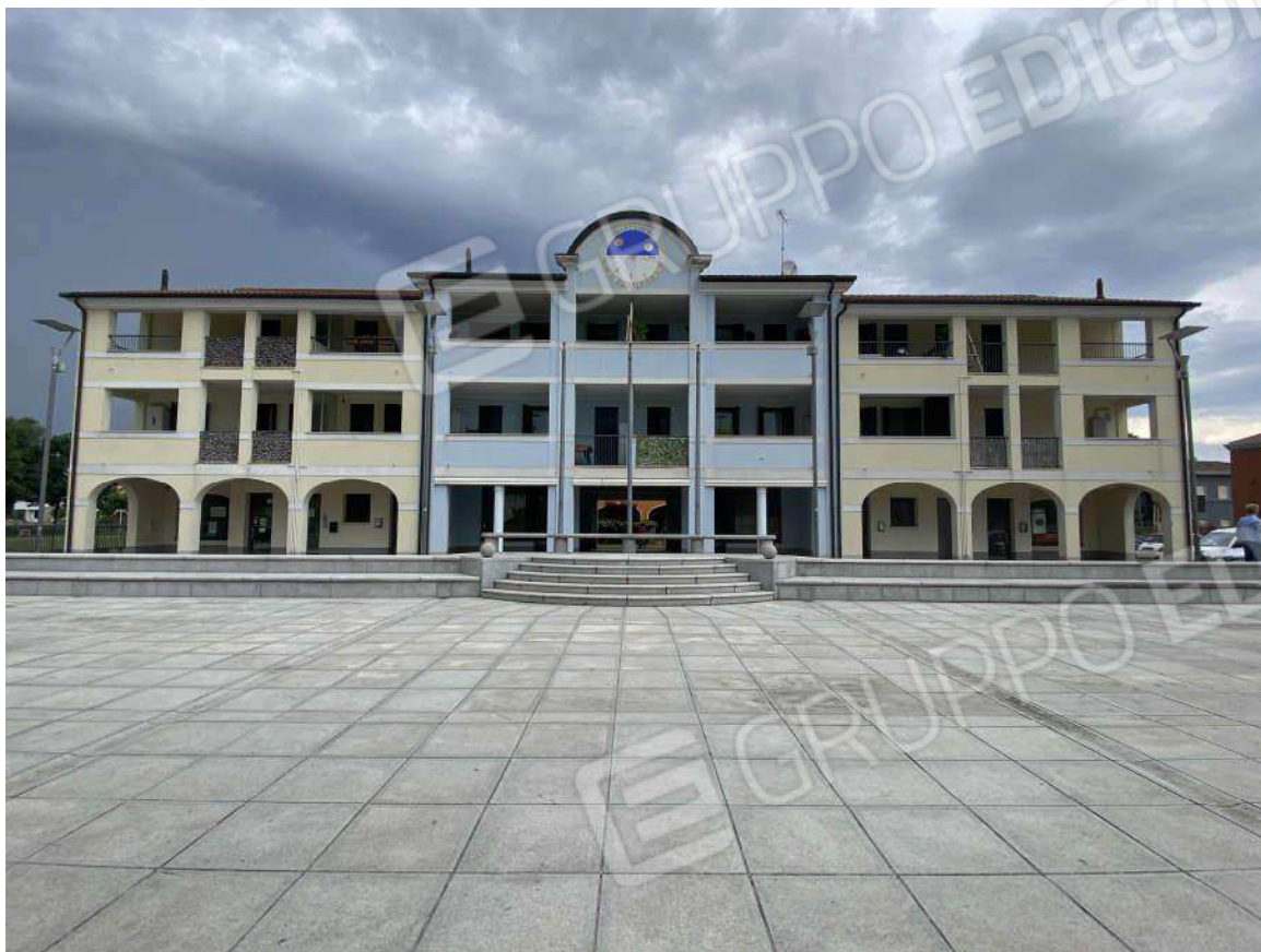
Foto 1 - esterno dell'edificio