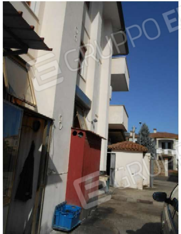
Foto 7 - Foto 8: particolari prospetto nord del fabbricato di cui il bene fa parte