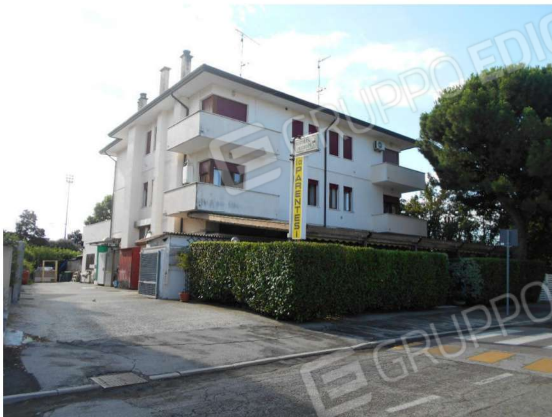
Foto 2: prospetti ovest e nord del fabbricato di cui il bene fa parte. Vista da via Vo' de Buffi