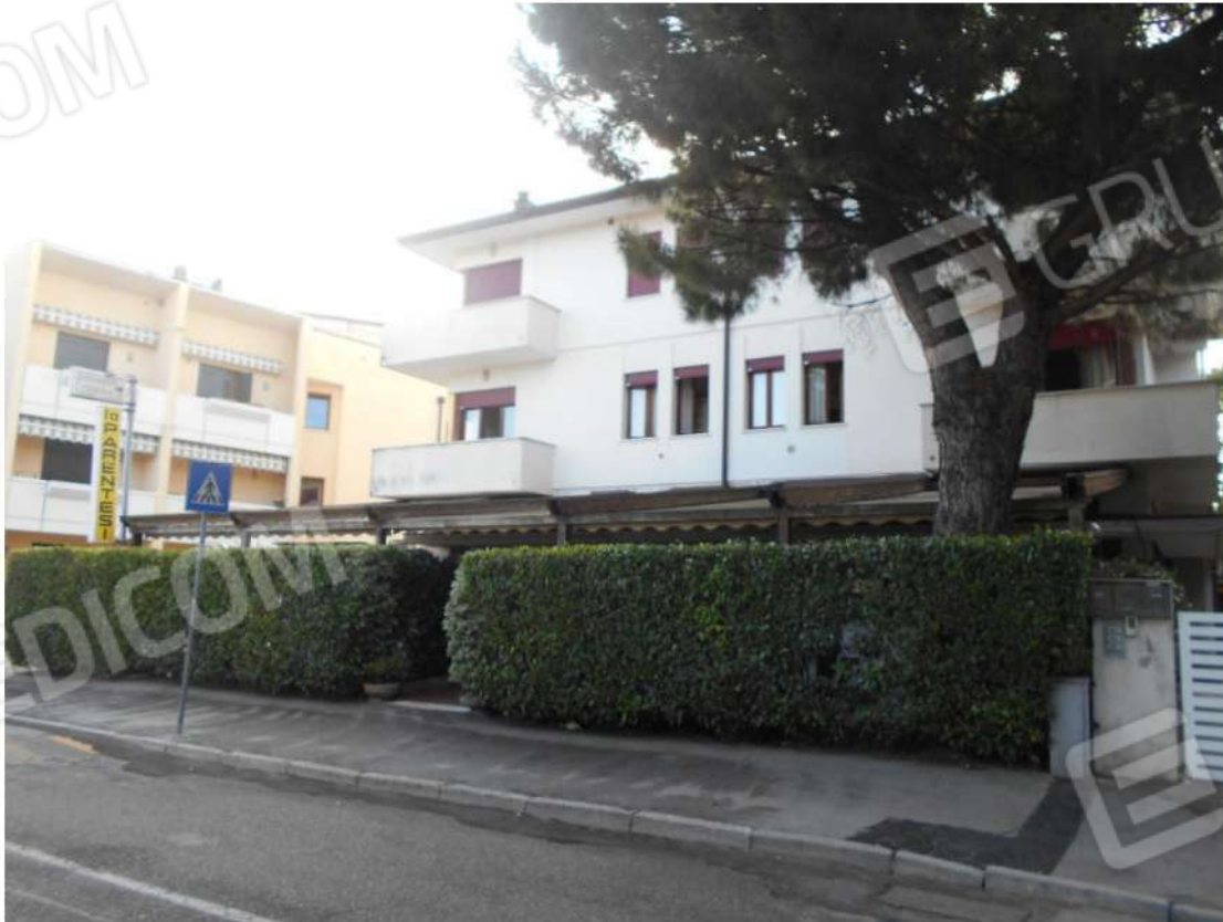
Foto 1: prospetto ovest del fabbricato di cui il bene fa parte. Vista da via Vo' de Buffi

Unità immobiliare commerciale al piano terra, adibita a Pizzeria, facente parte del fabbricato a destinazione mista, sito a Monselice (PD), via Vo' de Buffi n. 26