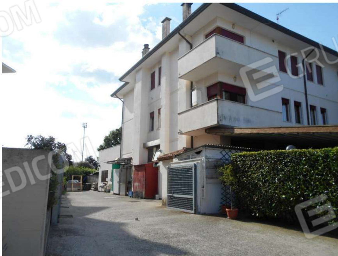
Foto 3: prospetto nord del fabbricato di cui il bene fa parte, porzione nord dello scoperto ad uso della pizzeria. Vista da via Vo' de Buffi

via Santa Bertilla, 14 - 35030 Selvazzano D. (PD) email: claudiabonelli73@gmail.com PEC: claudia.bonelli@archiworldpec.it