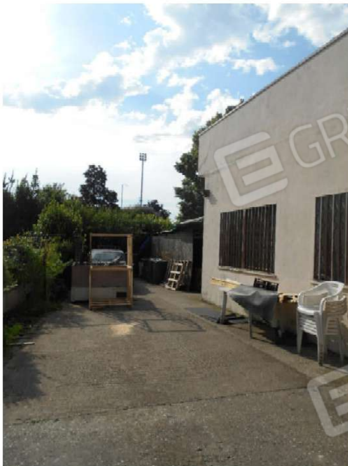
Foto 4: porzione nord dello scoperto ad uso della pizzeria. Sulla destra il corpo di fabbrica adibito a sala da pranzo della pizzeria e zona magazzino