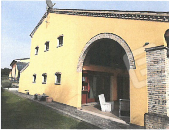
1- Prospetto laterale casa