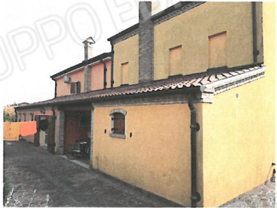
2 – Prospetto sul retro casa