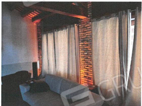
6 – Zona salotto al piano primo