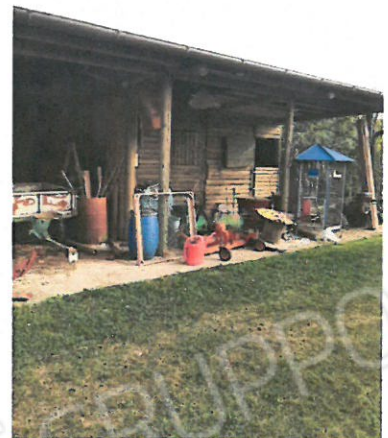
16 – Baracche in legno da demolire