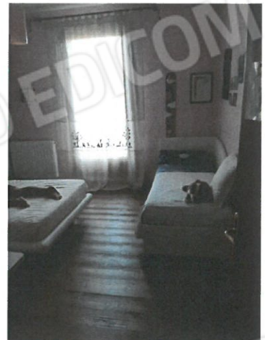
8 – Camera