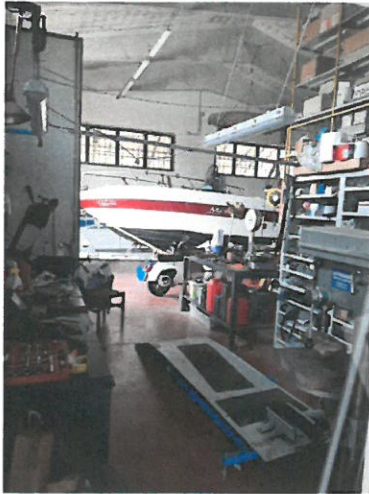
13 – Annesso rustico