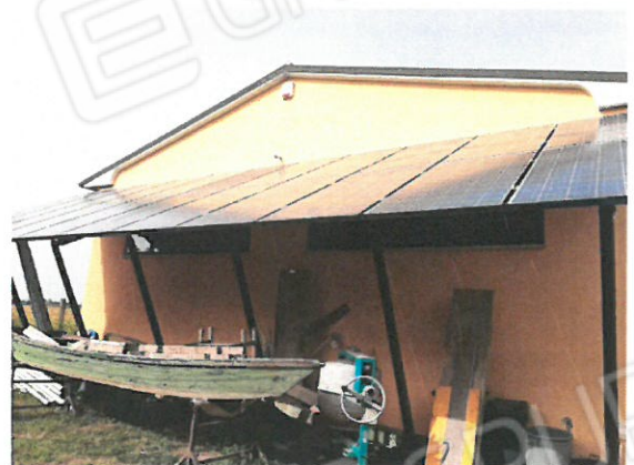
12 – Fotovoltaico su annesso rustico