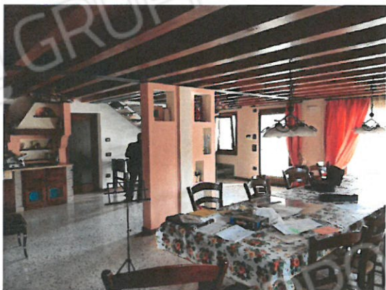
4 – Piano terra ex garage