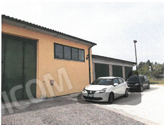
11 – Annessi rustici e garage