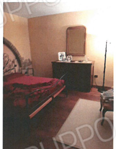
10 – Camera