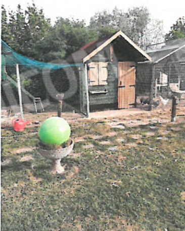
17 – Baracca in legno da demolire