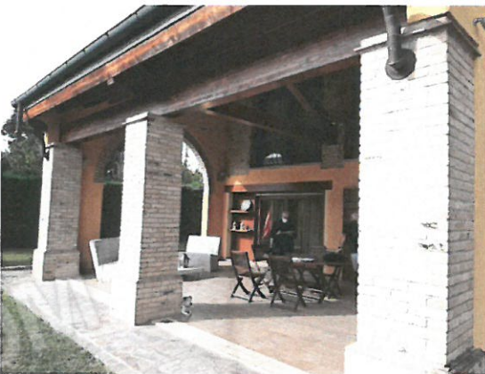
3 – Prospetto principale portico