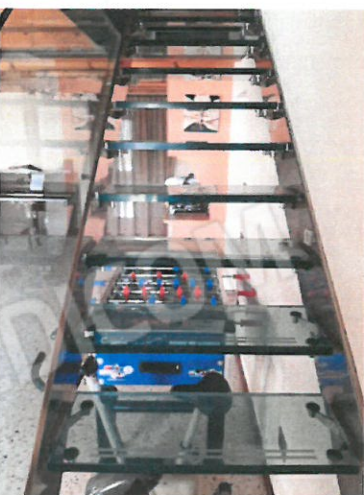
5 – Scala in vetro