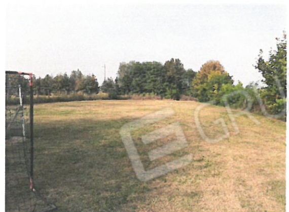
18 – Terreno