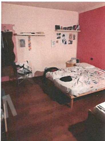
9 – Camera