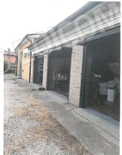
14 – garage