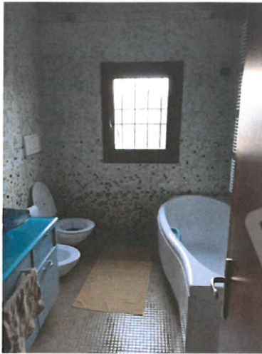
7 – Bagno