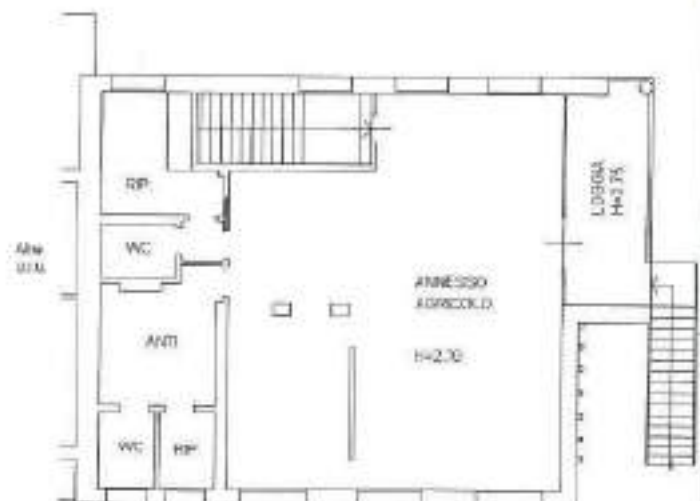
PIANO PRIMO H=2.70