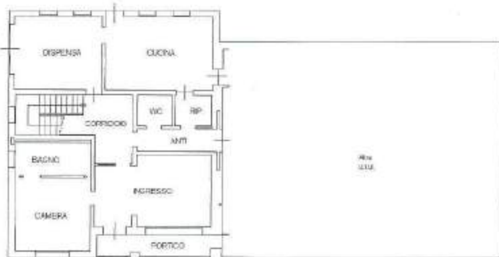
PIANO TERRA H=2.70