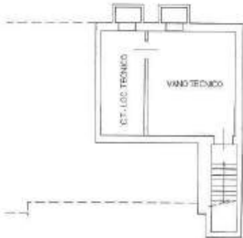
PIANO SOTTOSTRADA H=2.70