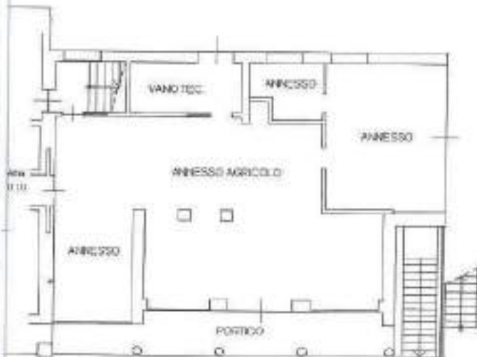
PIANO TERRA H=2.70