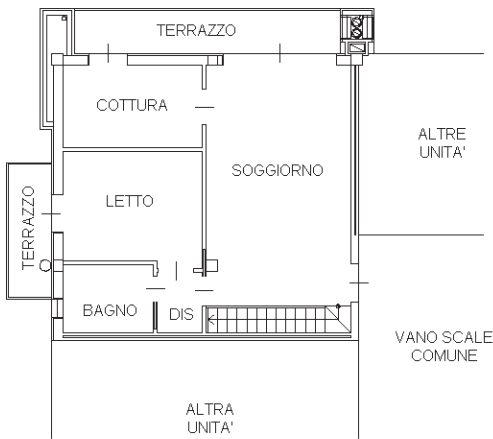
PIANTA PIANO SECONDO H = 2.70