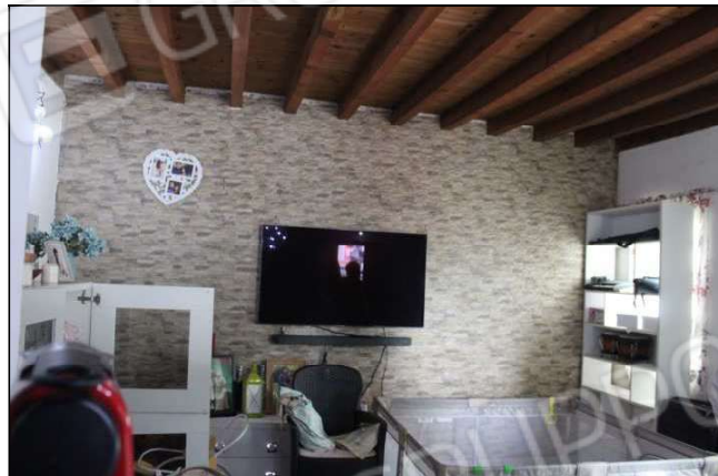
9-10 - Locale soggiorno