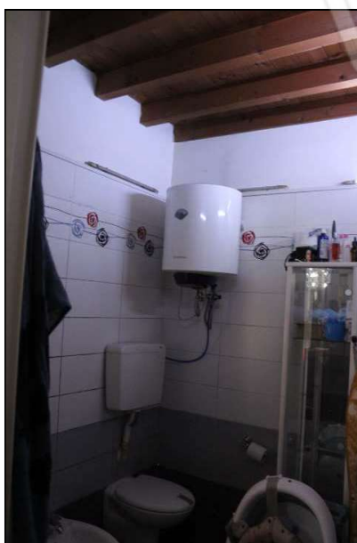
12 – scaldabagno