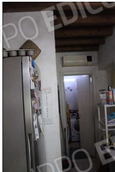
8 – disimpegno e pompa di calore