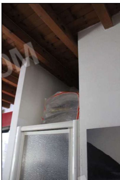
16 – ripostiglio