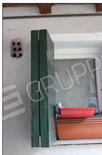
18 – Finestra e scuro pieghevole