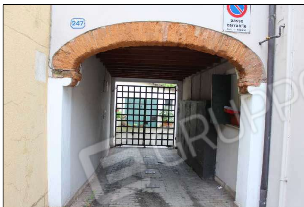
3 – Portico di ingresso al cortile interno