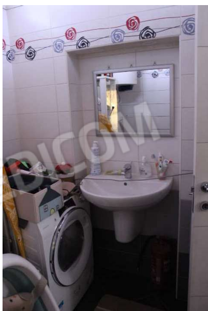
11 – Bagno