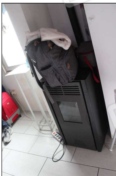
17 – stufa a pellet