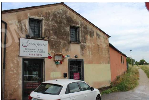
2.- Prospetto Nord (lungo l'argine Brentella)