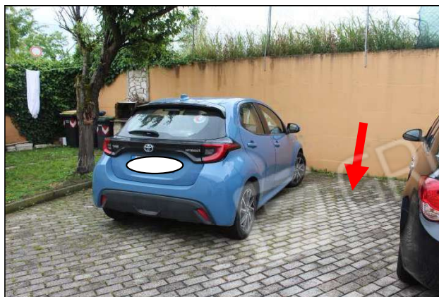
5 – posto auto sub 17