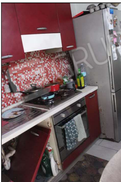
7 – piano cottura