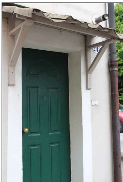
6 – Portoncino di ingresso