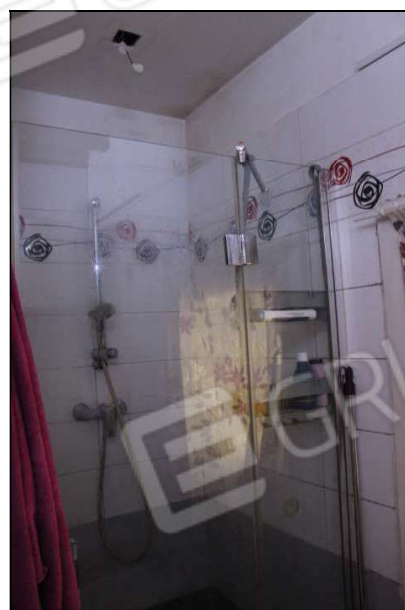
13 – Doccia