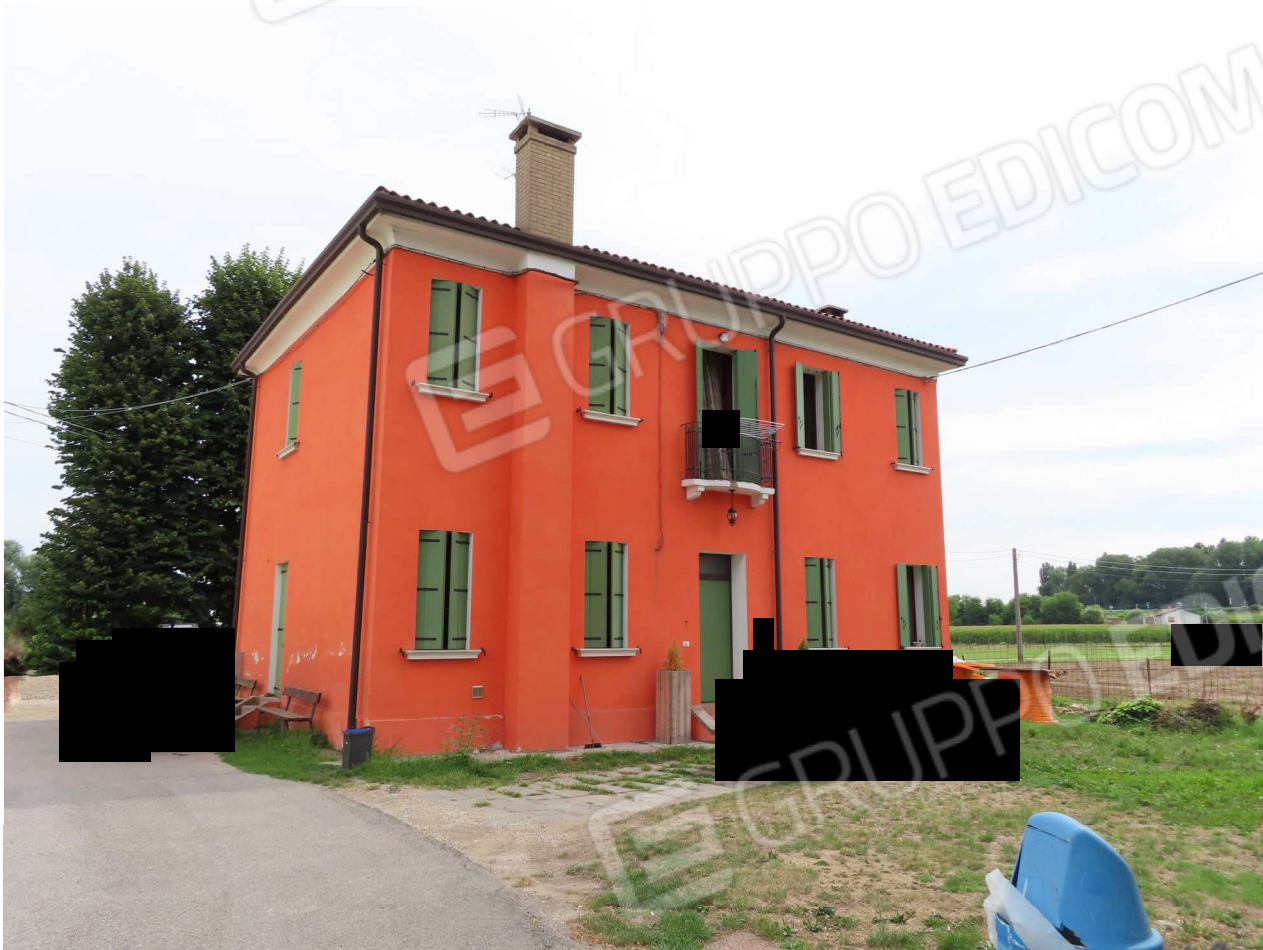
PROSPETTI SUD ed OVEST