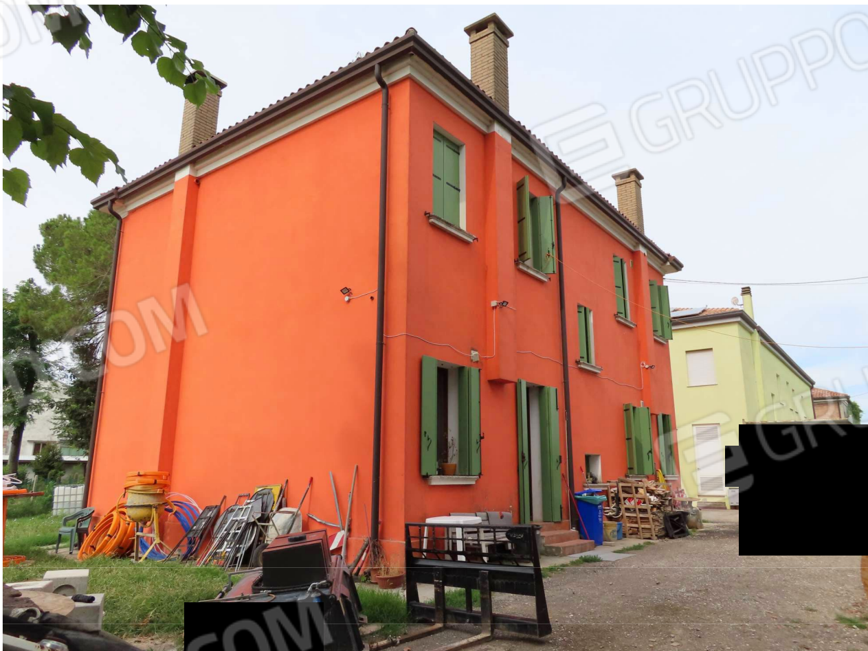
PROSPETTI NORD ed EST