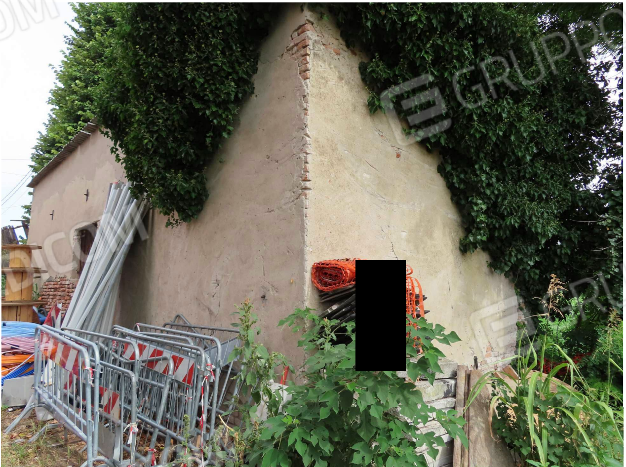
GARAGE PROSPETTI SUD ed EST