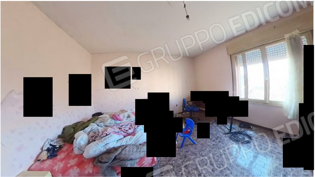
Figura 25 Interni abitazione primo piano