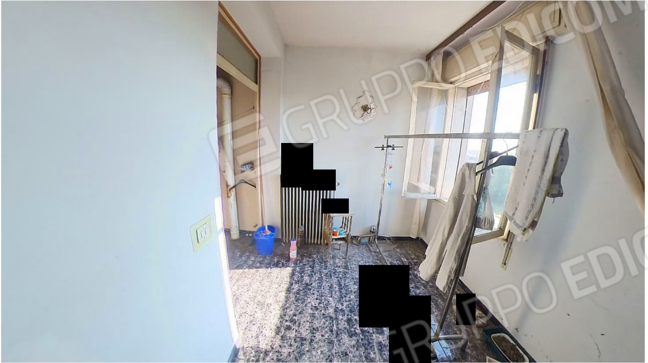
Figura 21 Interni abitazione primo piano