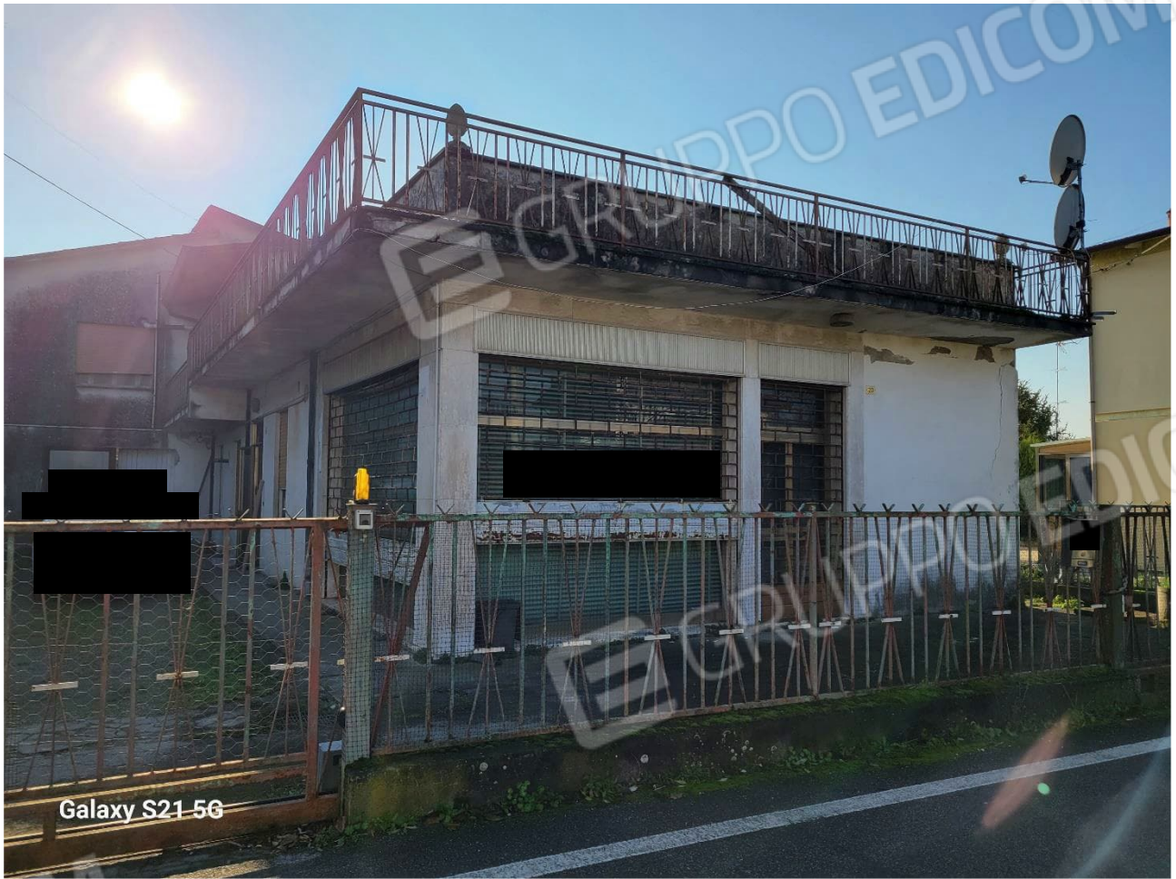
Figura 5 Veduta da Via Sabbioni Centro