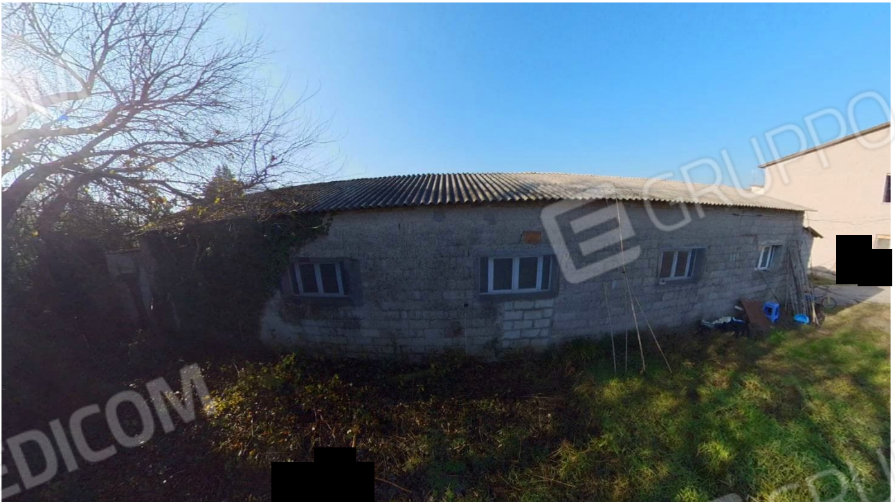
Figura 30 Laboratorio Lato Est