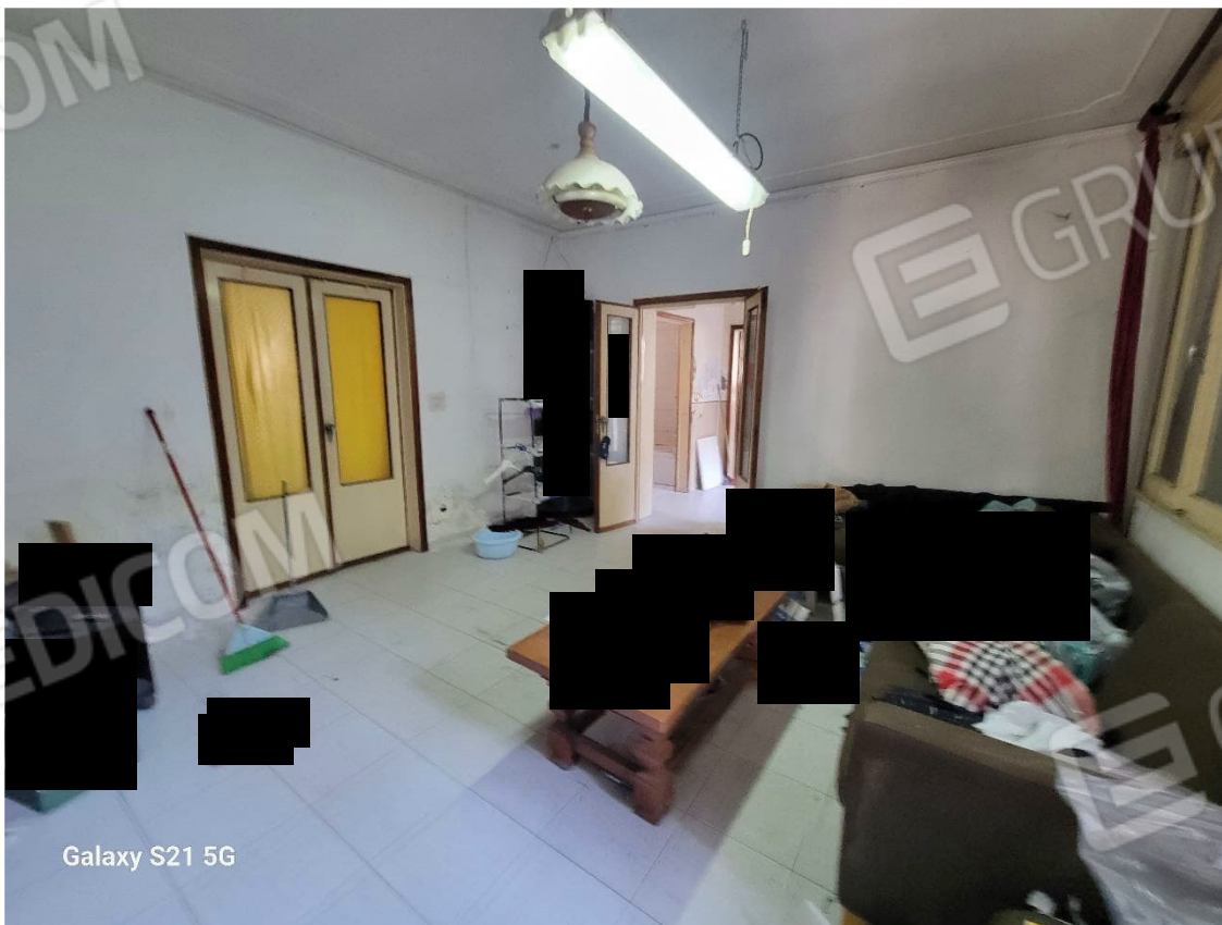
Figura 14 Interni abitazione piano terra