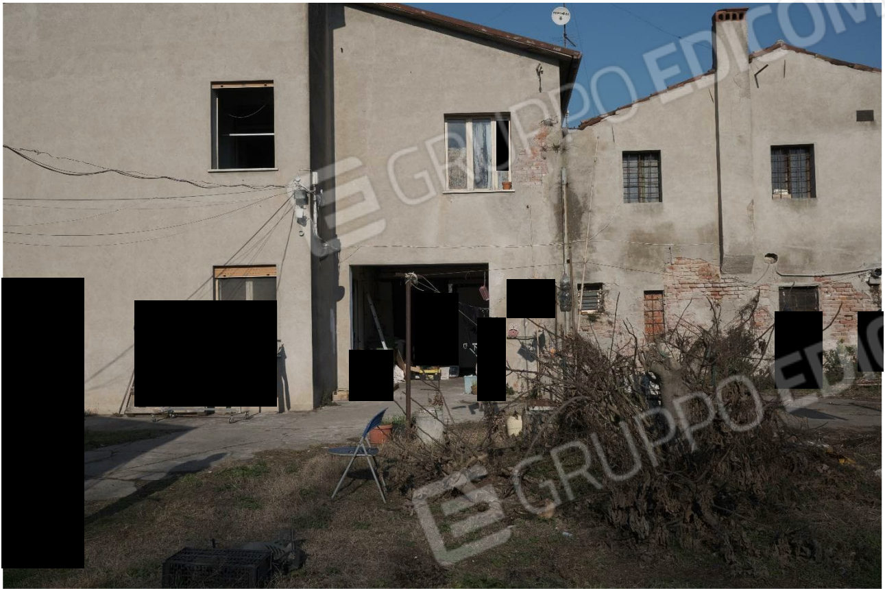
Figura 12 Esterno Sud abitazione