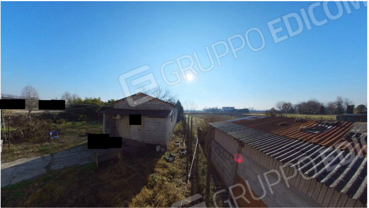
Figura 31 Laboratorio lato Nord