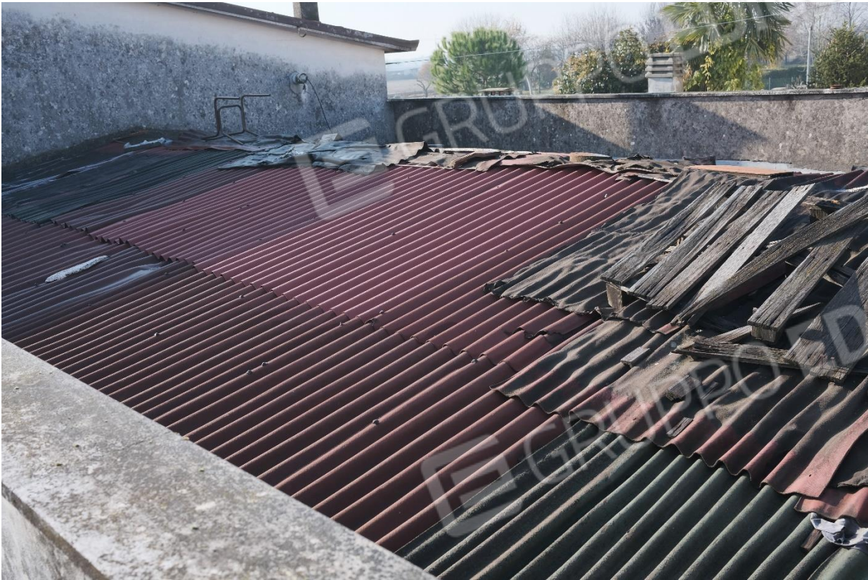
Figura 9 Particolate tetto cantina fronte strada (ex negozio)