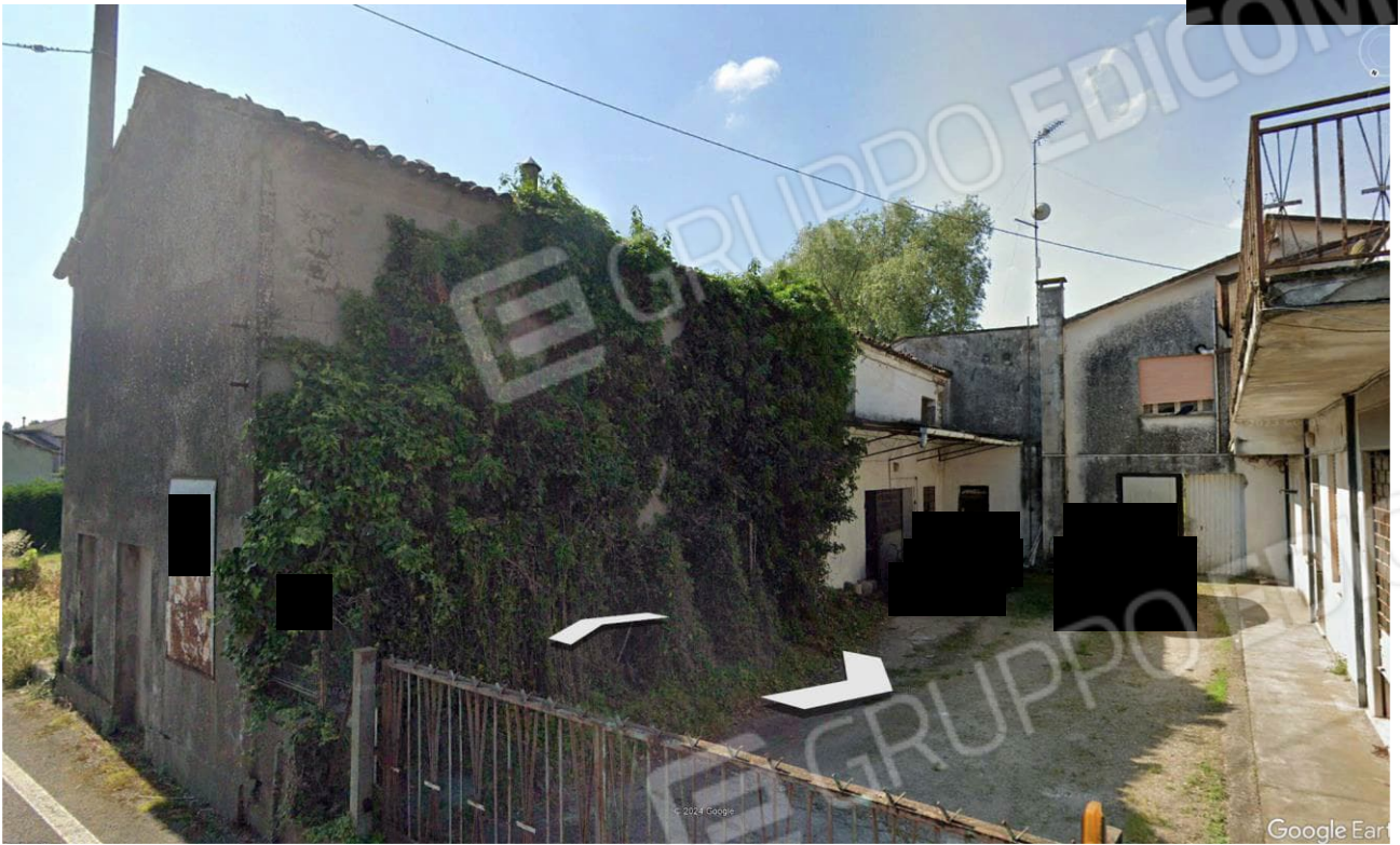
Figura 3 Veduta da Via Sabbioni Centro