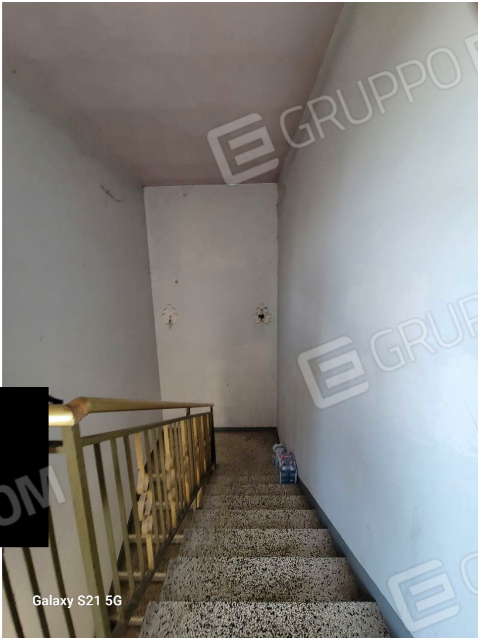
Figura 18 Interni abitazione vano scala