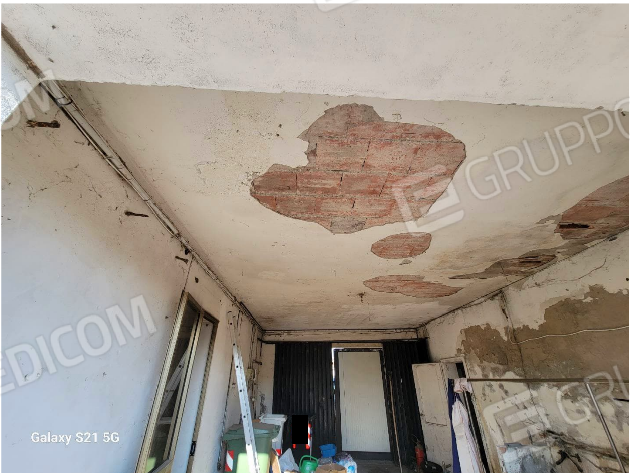
Figura 26 Spazio del Garage mn 246 sub 2