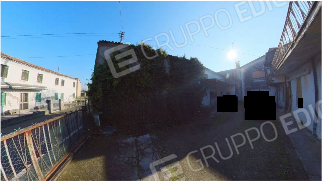
Figura 7 veduta esterni