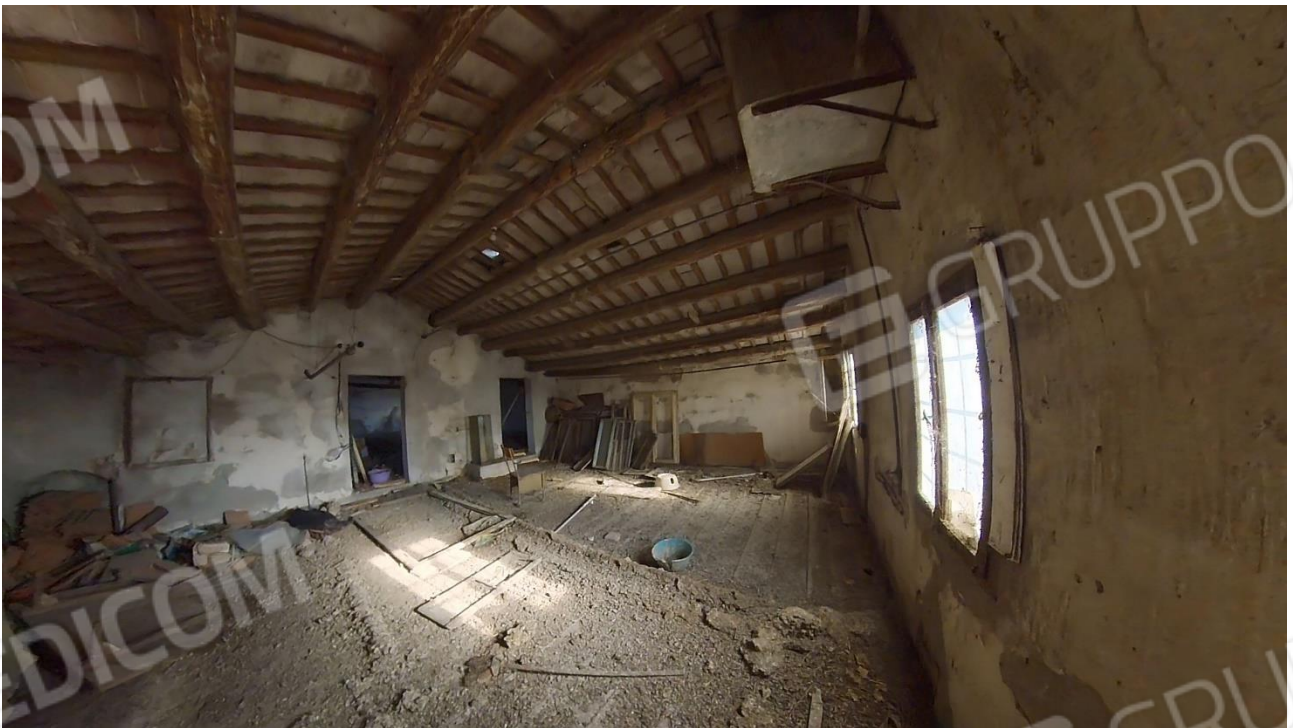
Figura 28 Sottotetto porzione Est