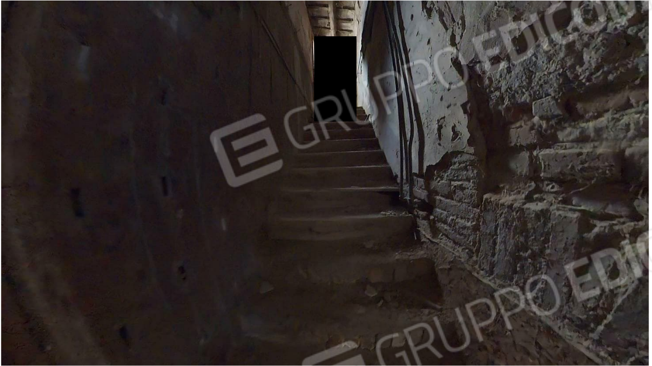
Figura 29 scala interna di accesso al sottotetto porzione Est