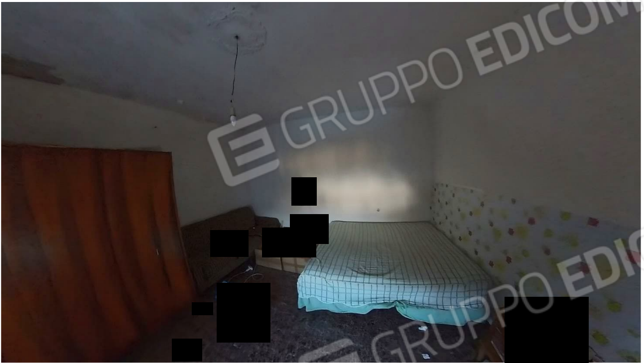
Figura 23 Interni abitazione primo piano