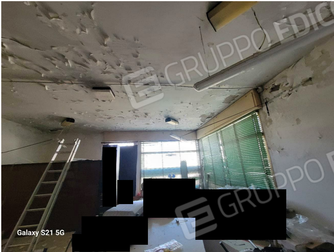
Figura 13 Interno cantina nord ex negozio