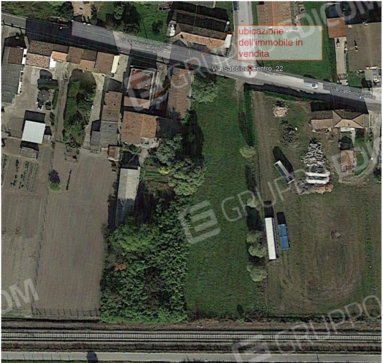
Figura 2 Particolare veduta aerea