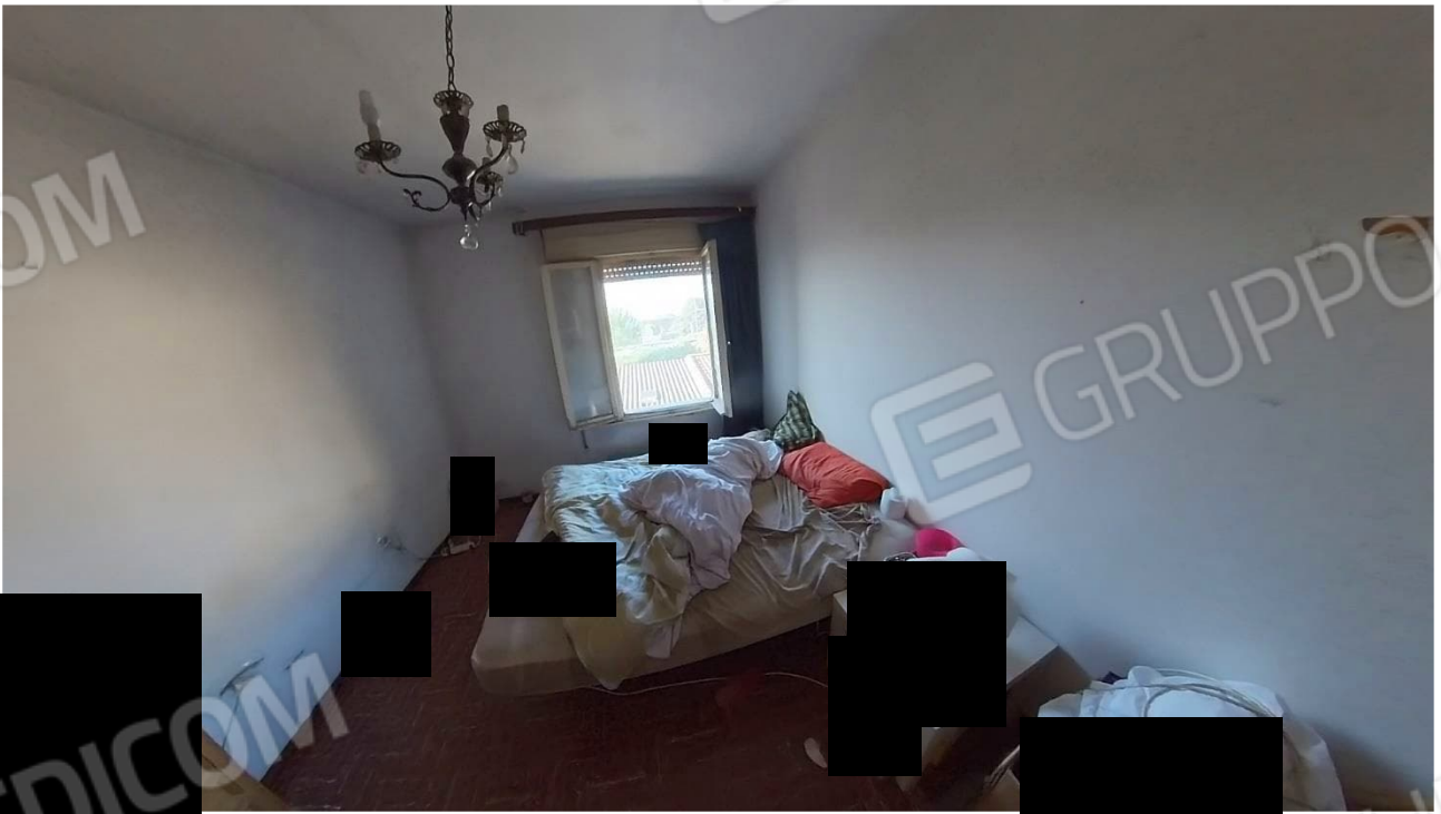
Figura 24 Interni abitazione primo piano