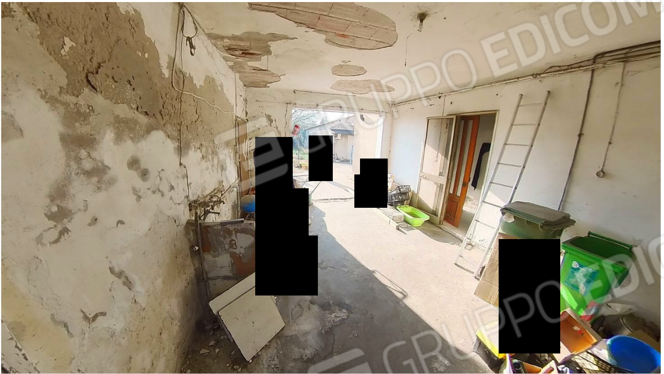
Figura 27 Spazio del Garage mn 246 sub 2