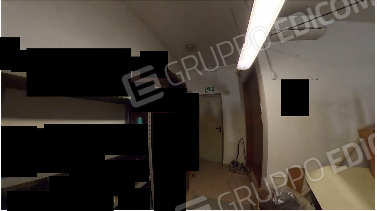
Figura 33 Interno laboratorio