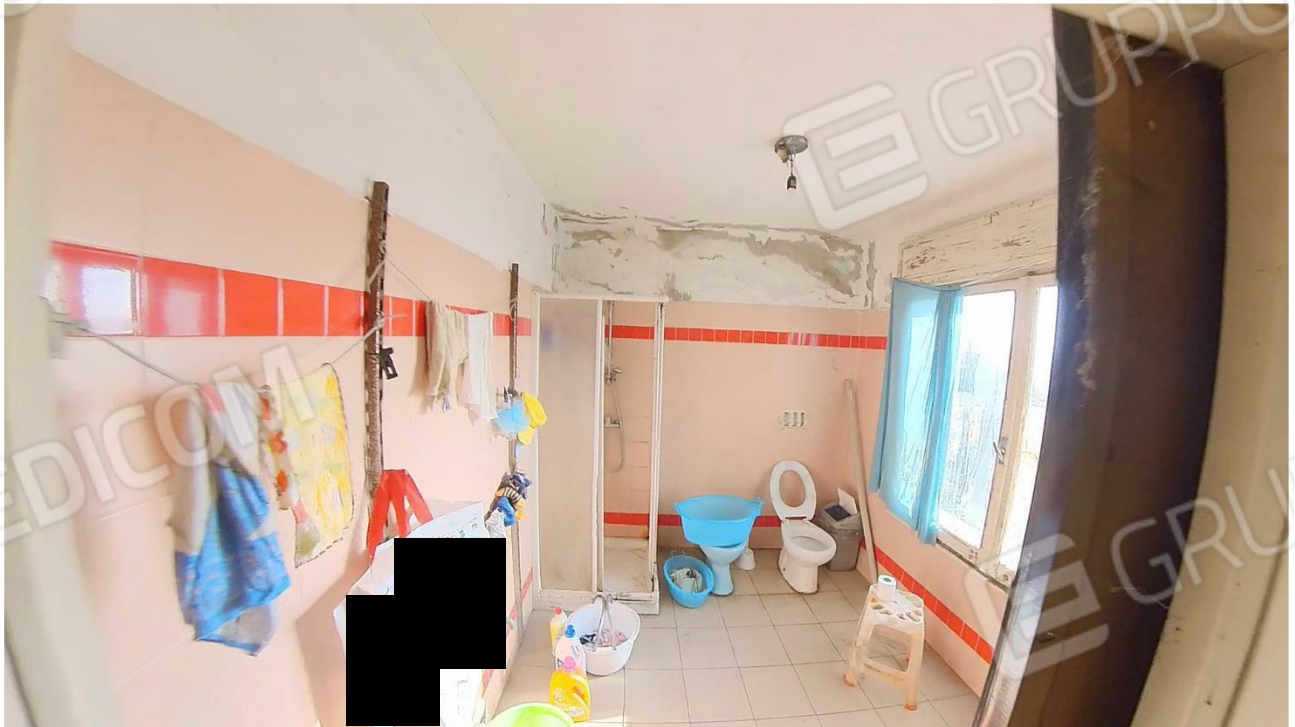
Figura 20 Interni abitazione primo piano