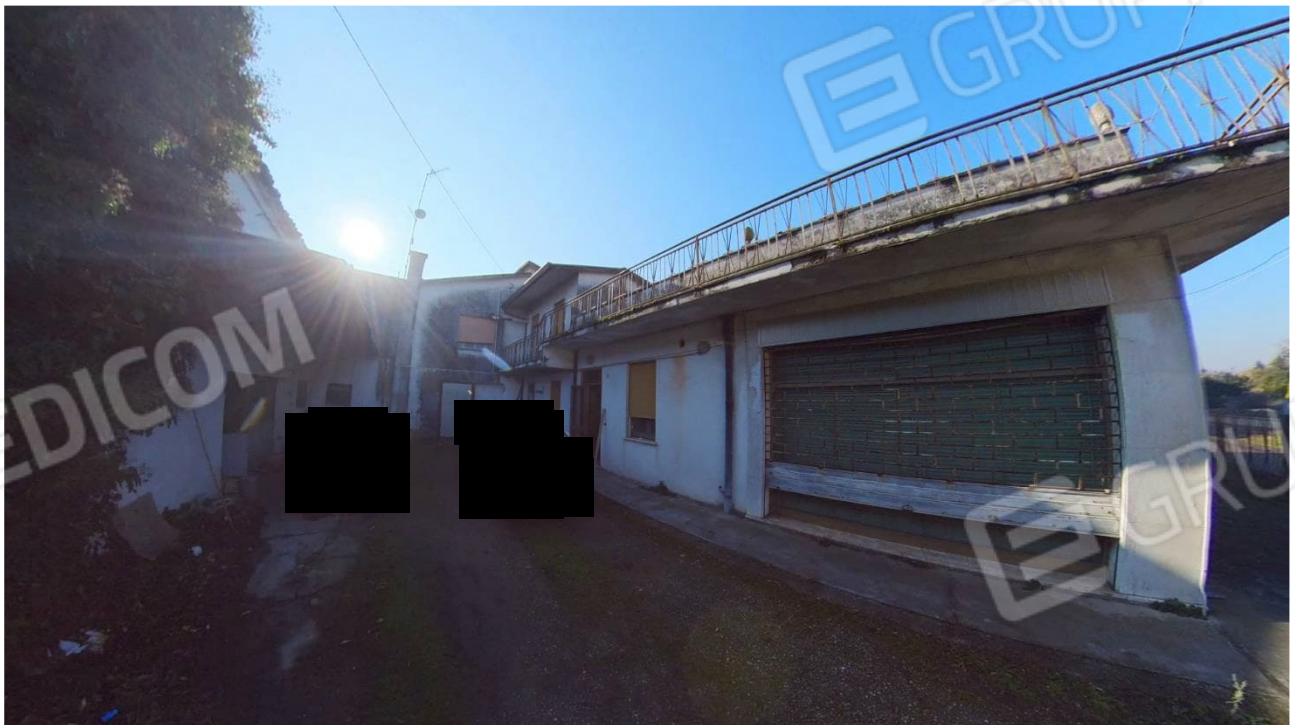
Figura 6 Veduta da Via Sabbioni Centro