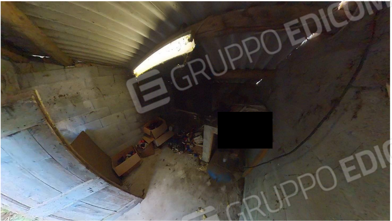
Figura 35 ampliamento abusivo laboratorio da rimuovere