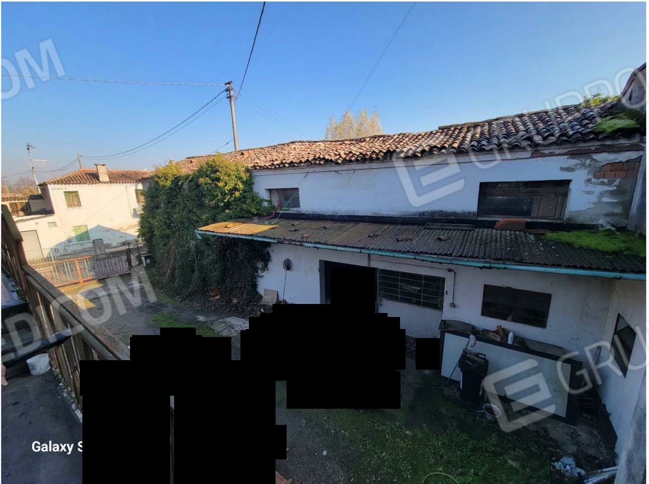
Figura 8 Veduta esterni