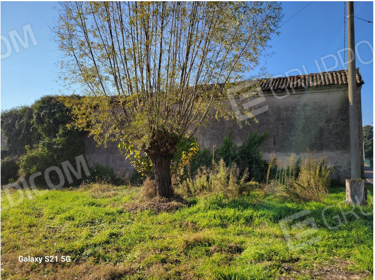
Figura 4 Veduta da Via Sabbioni Centro