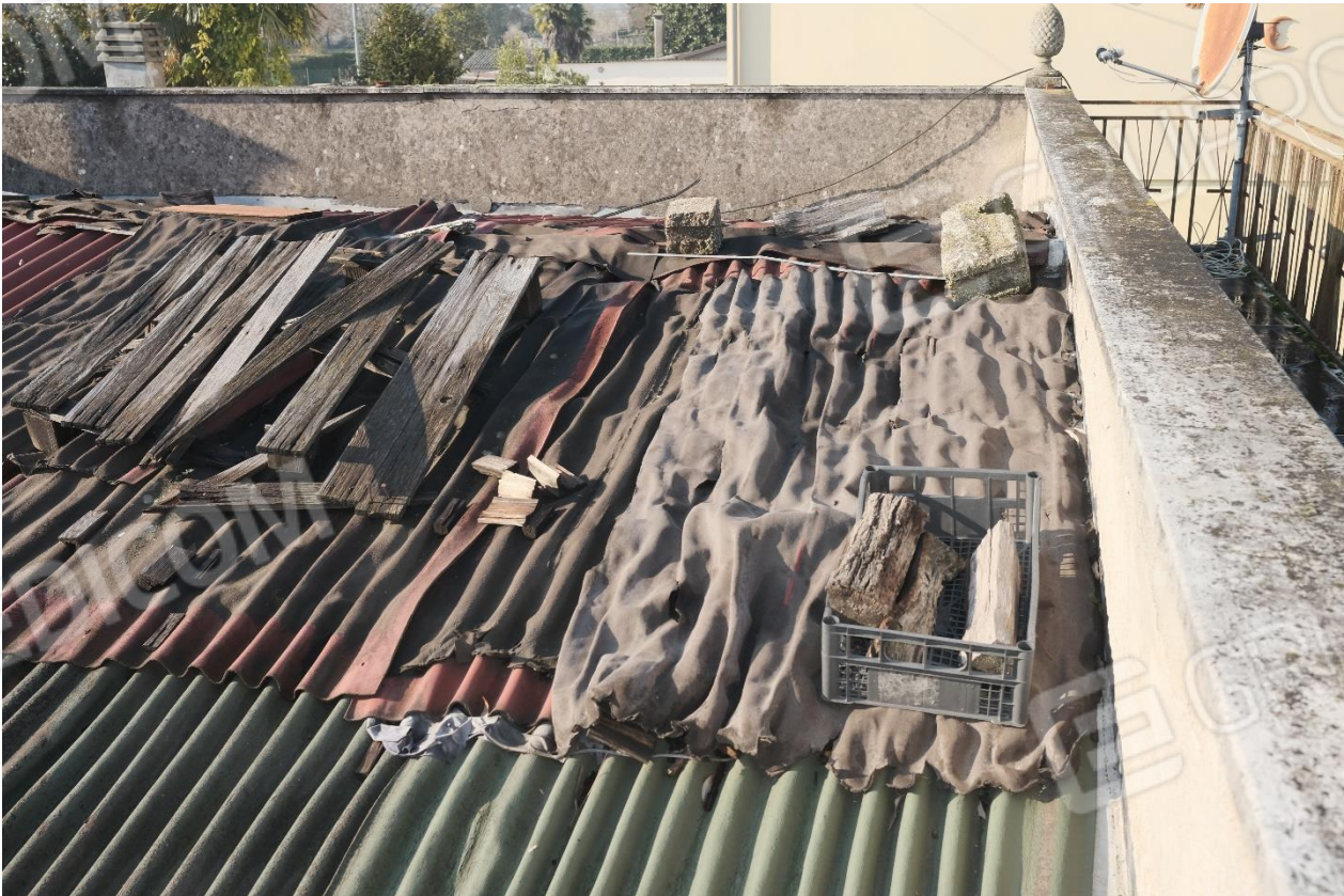
Figura 10 Particolate tetto cantina fronte strada (ex negozio)