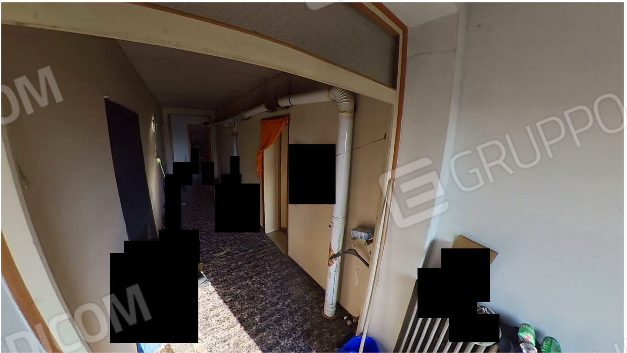
Figura 22 Interni abitazione primo piano