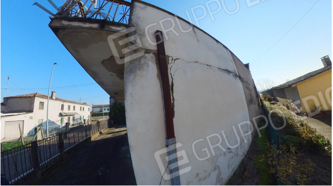
Figura 11 stato delle murature esterne cantina Nord