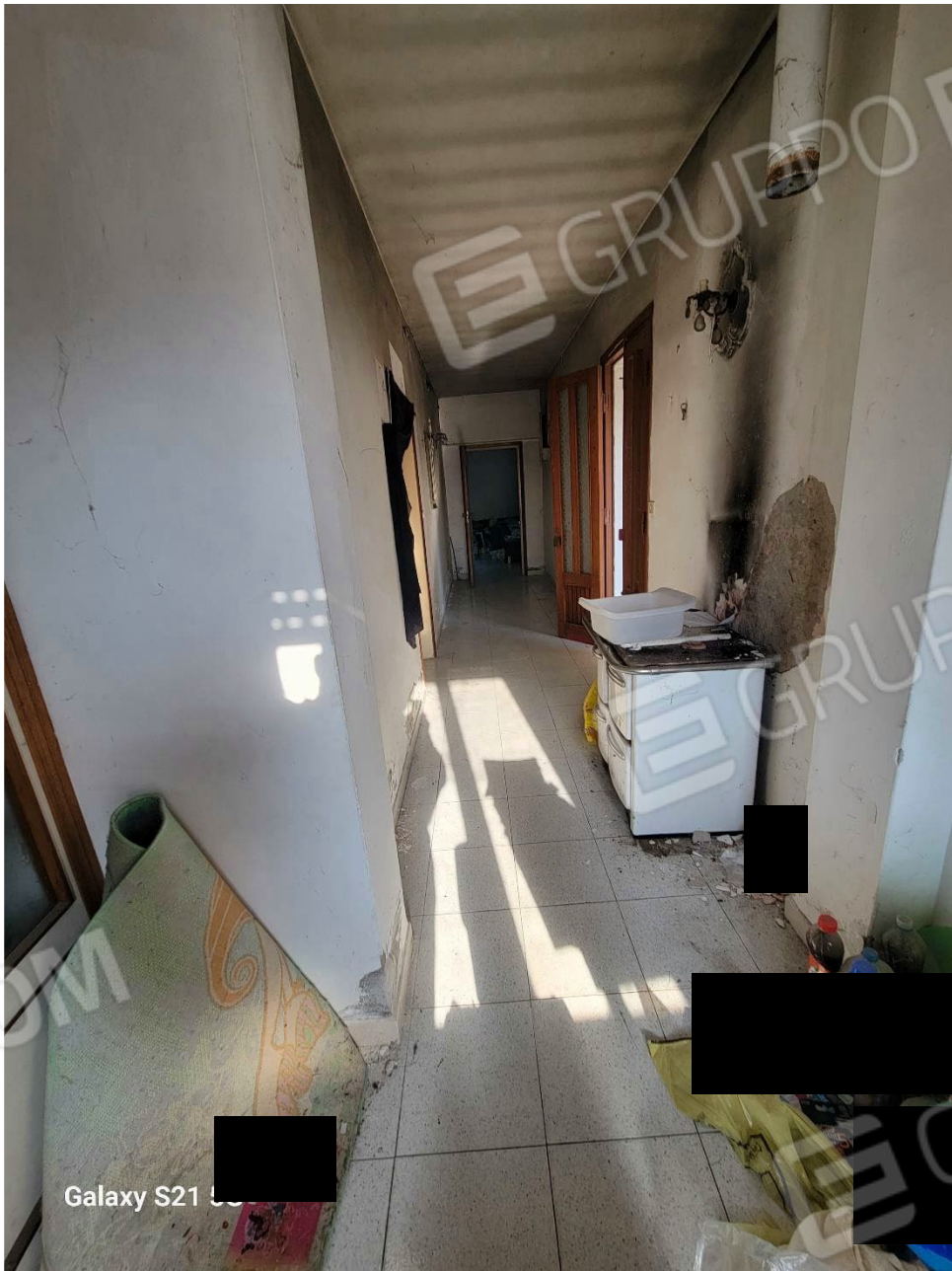
Figura 17 Interni abitazione piano terra