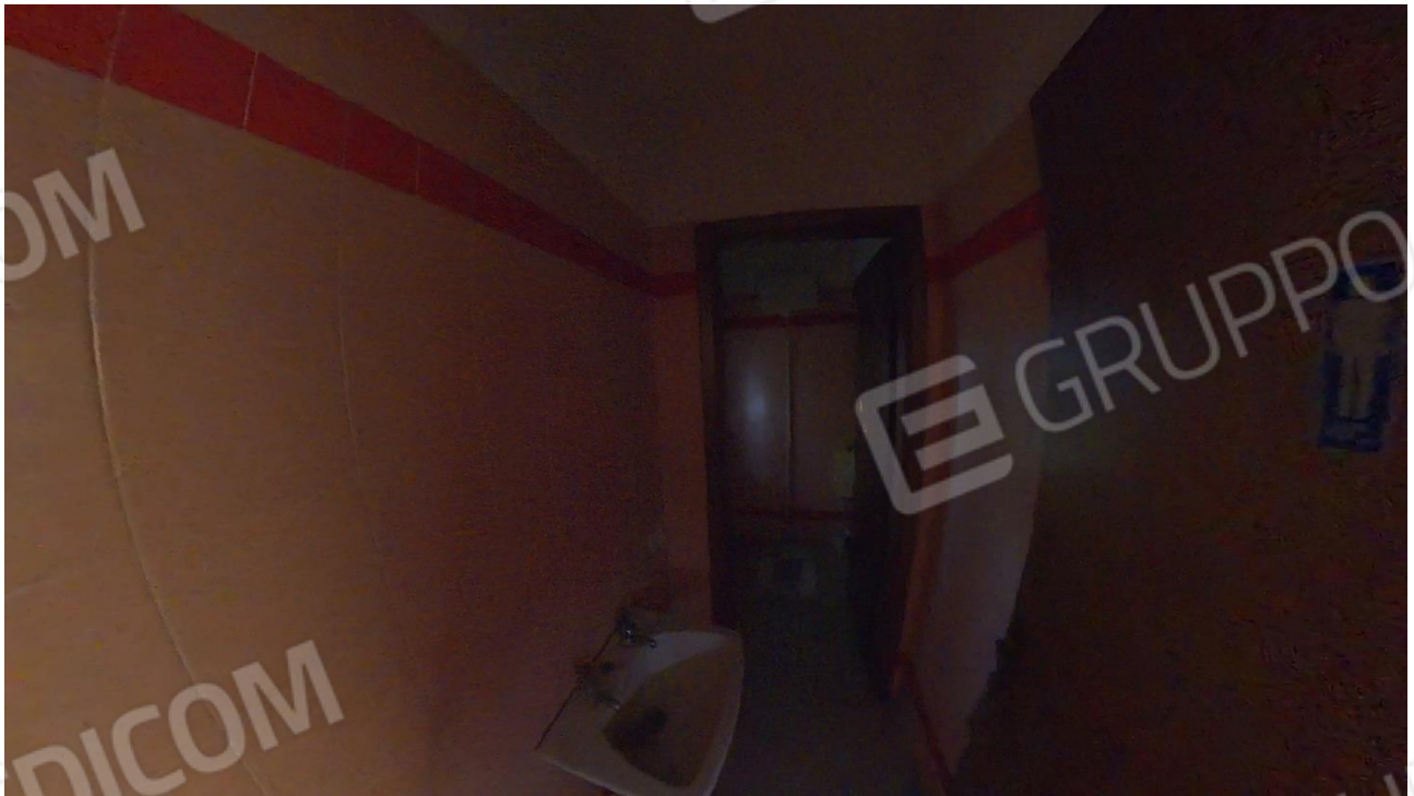
Figura 34 Servizi igienici laboratorio (non funzionanti)