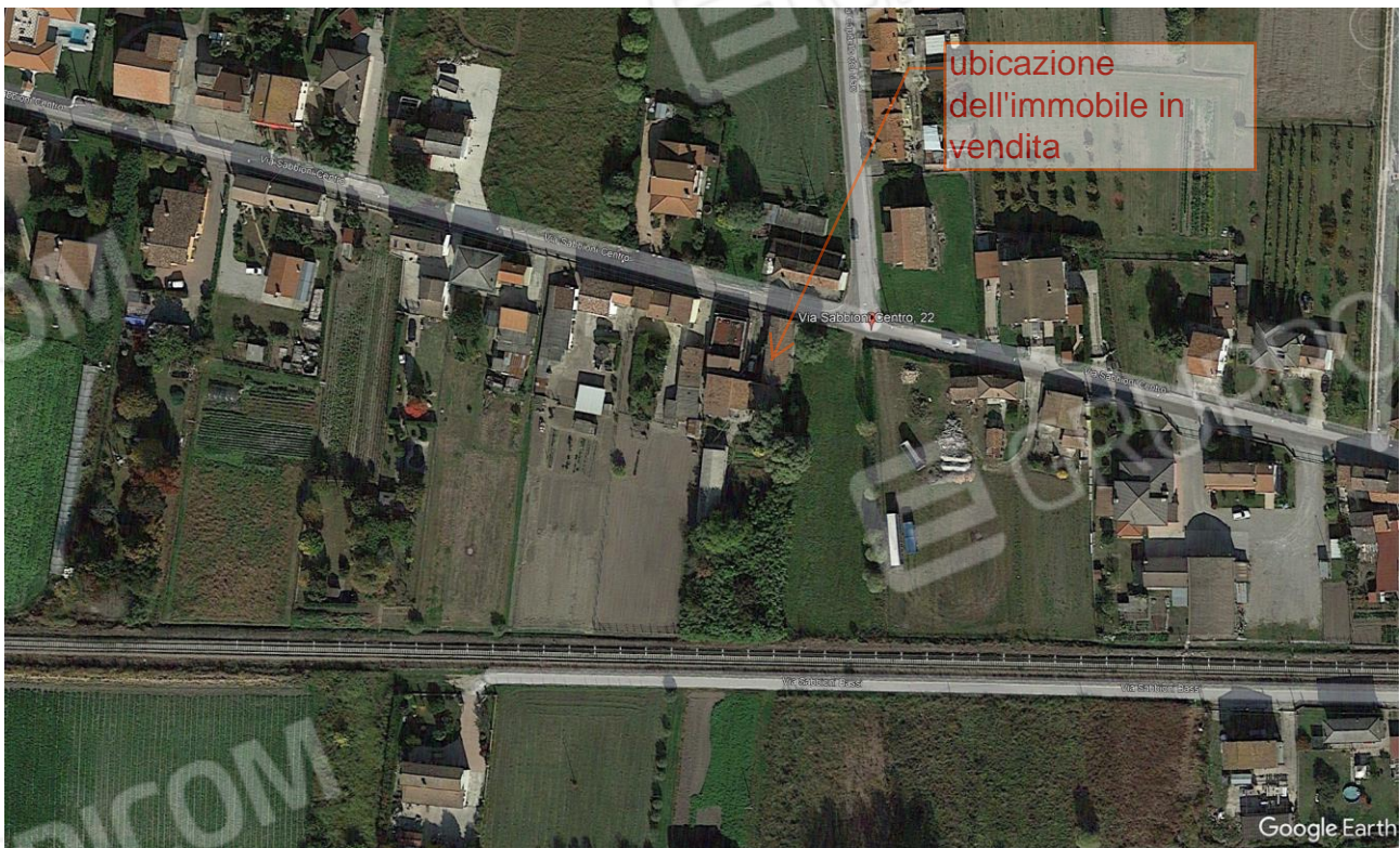
Figura 1 VEDUTA AEREA