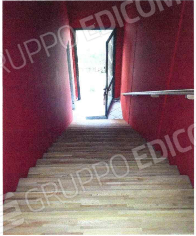
Scale di accesso al piano Primo e Locale allo stesso Piano