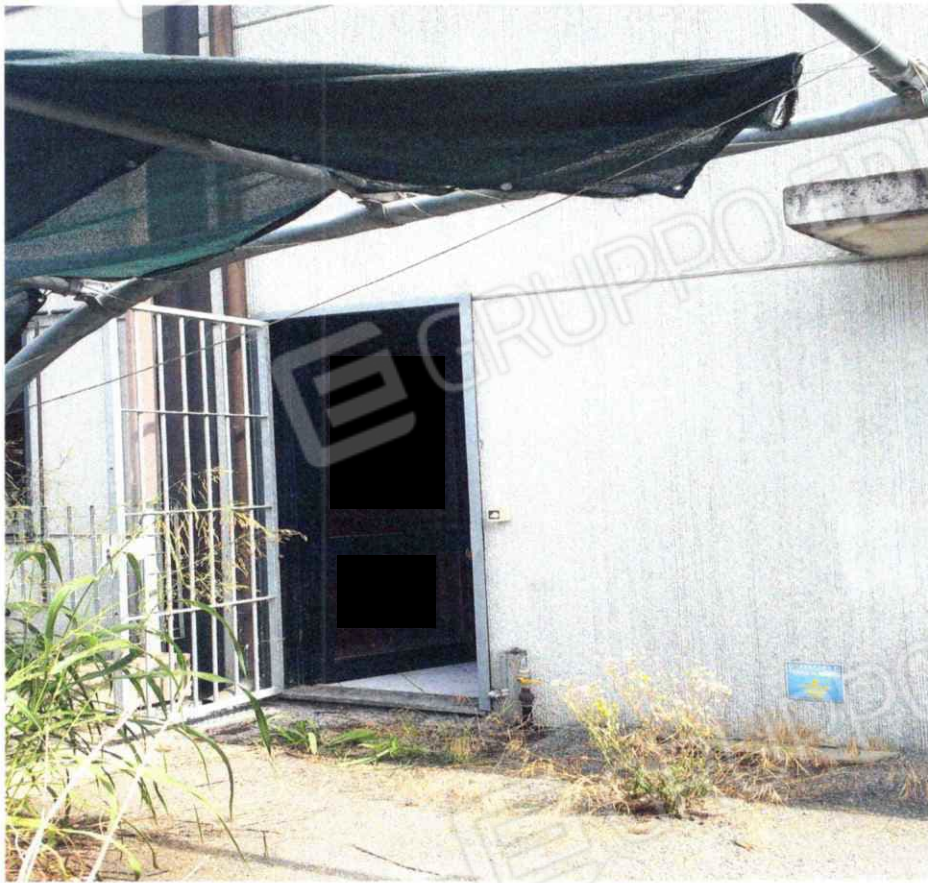
Prospetto Principale e porta di accesso