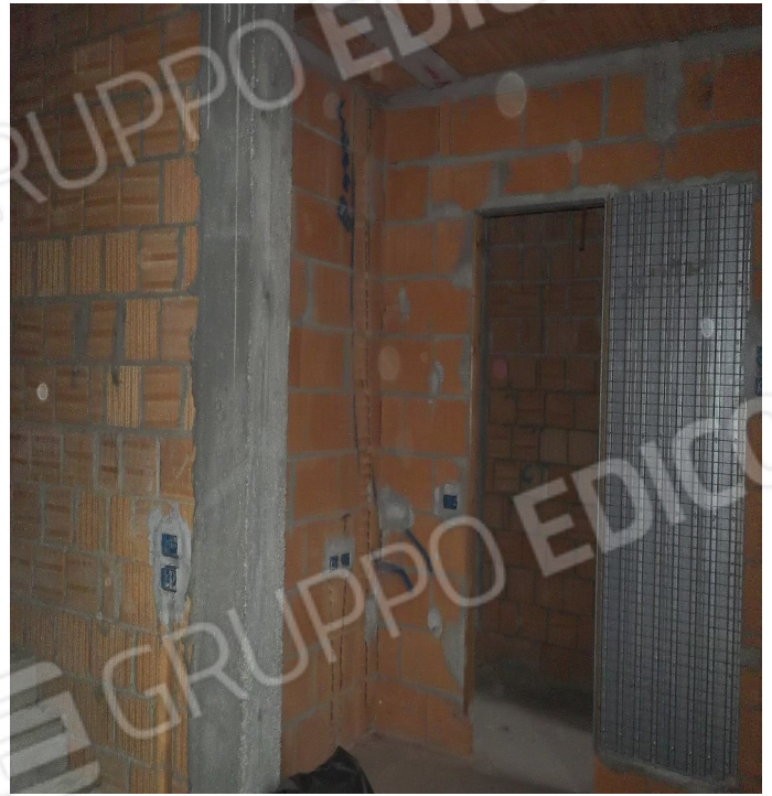
Interni al "Grezzo" dell'appartamento