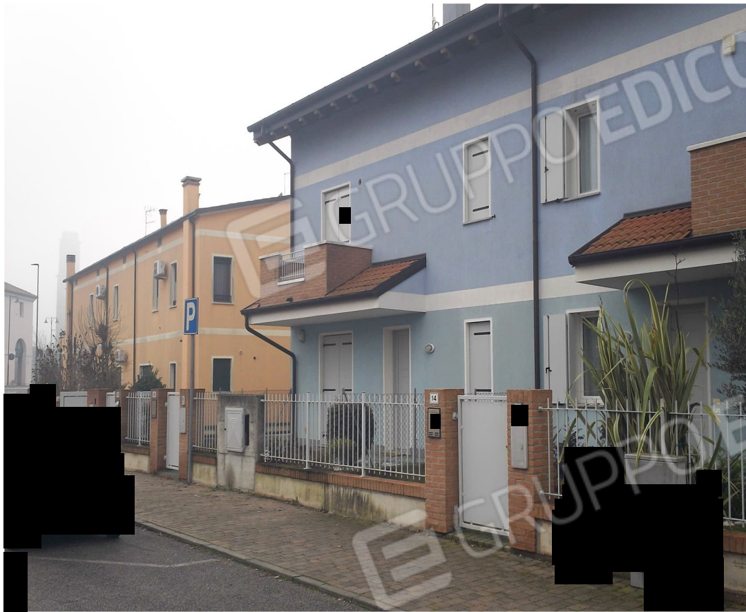
Appartamento (Piano Primo e Sottotetto) (Prospetto)