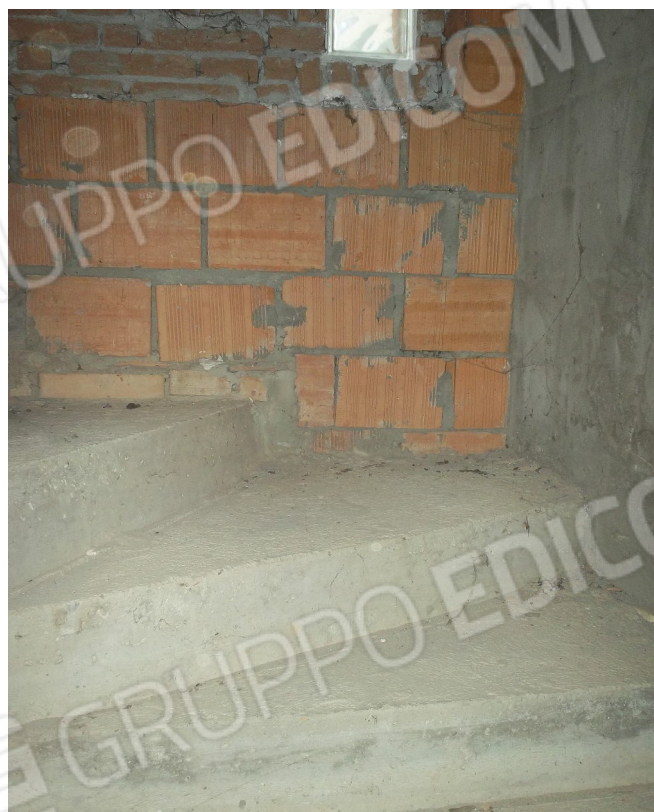
Porta di ingresso, con scale di accesso al piano primo e al piano sotto tetto