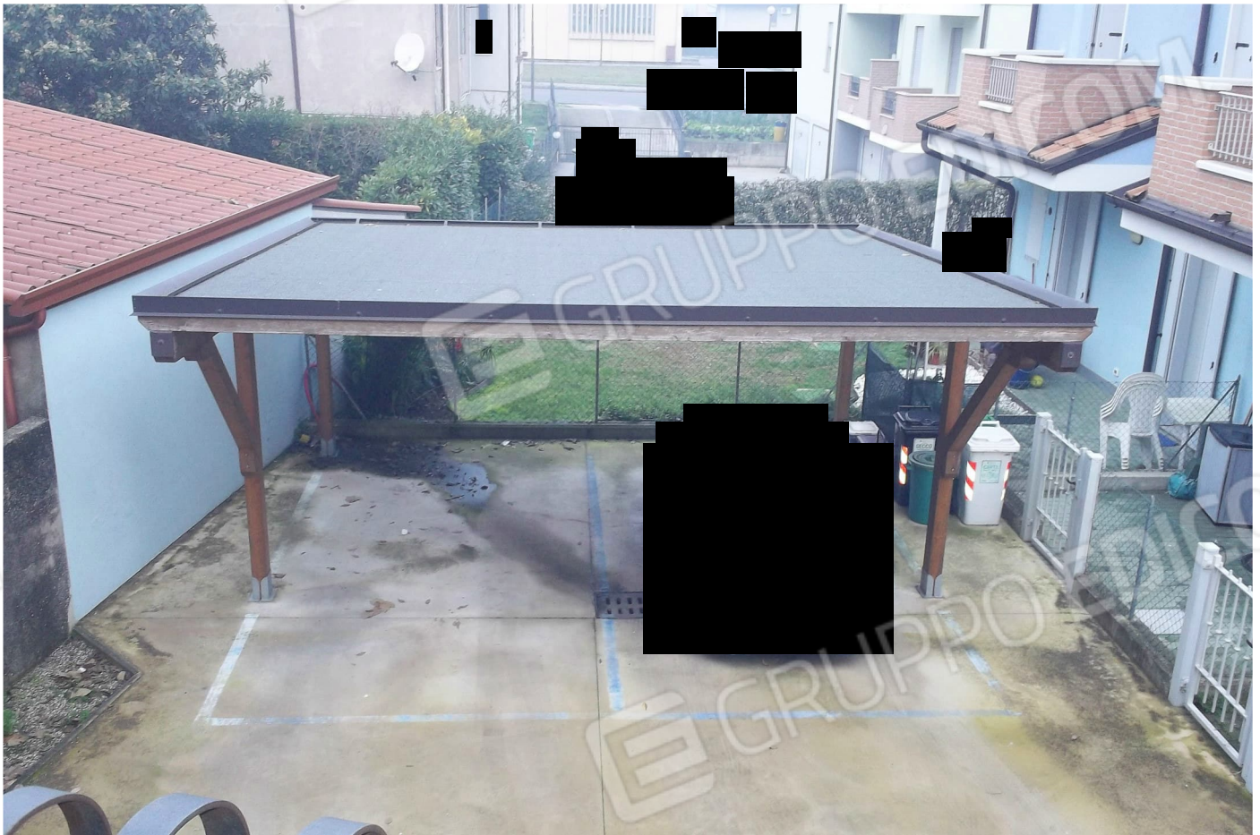
Due posti auto coperti, uno dei quali è annesso all'appartamento allo stato "Grezzo"