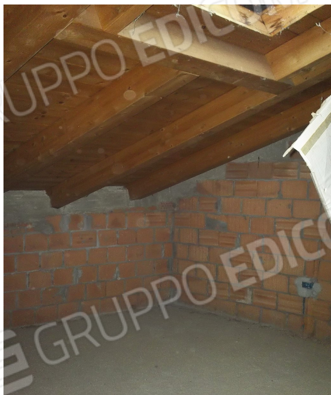
Piano Sotto-Tetto con travature in legno del coperto