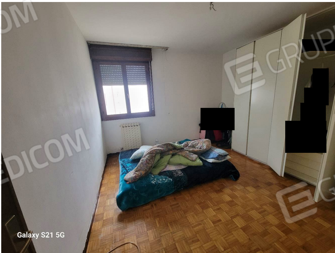
Figura 9 Interni appartamento