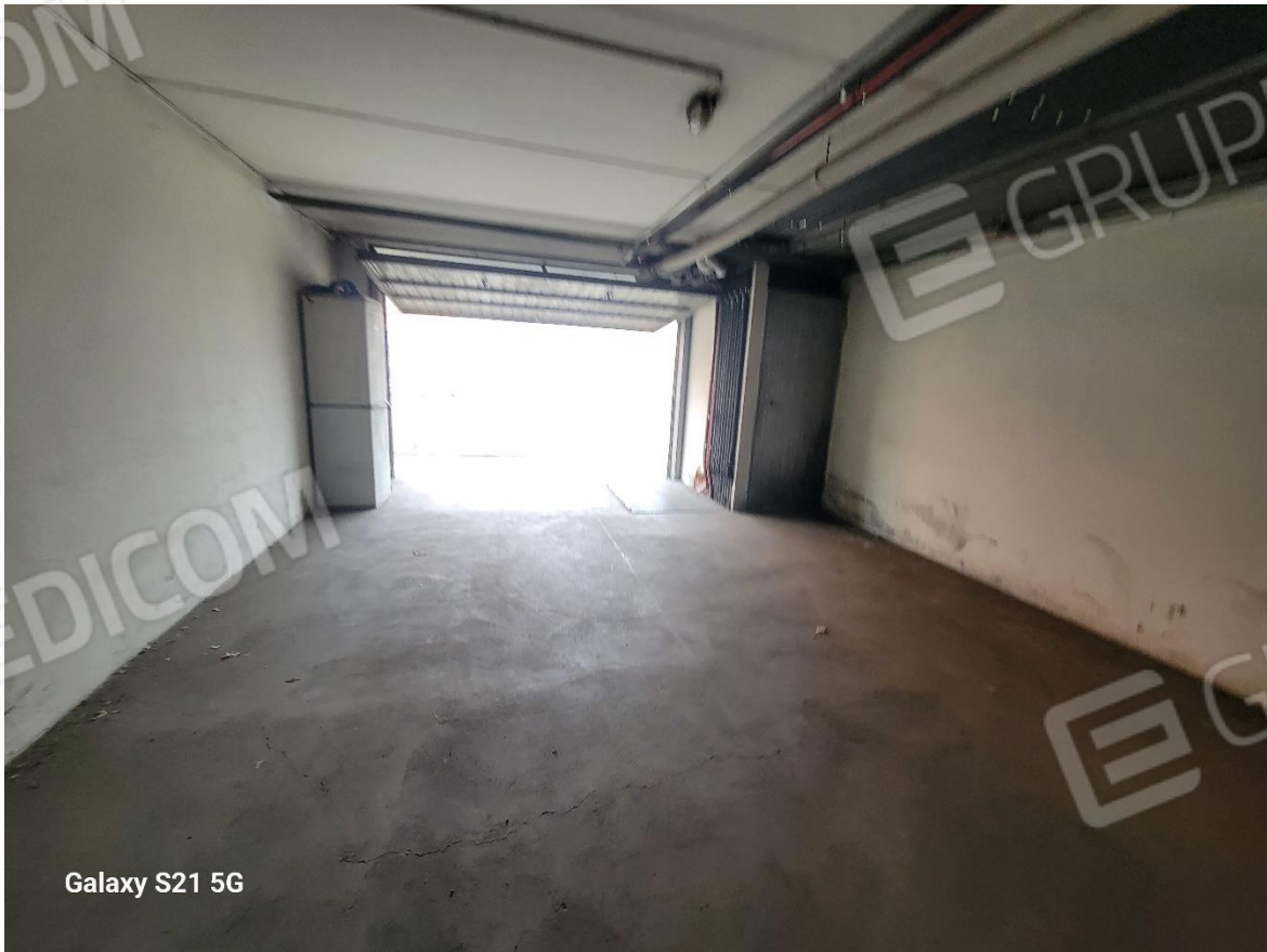
Figura 15 Garage da 6 posti auto