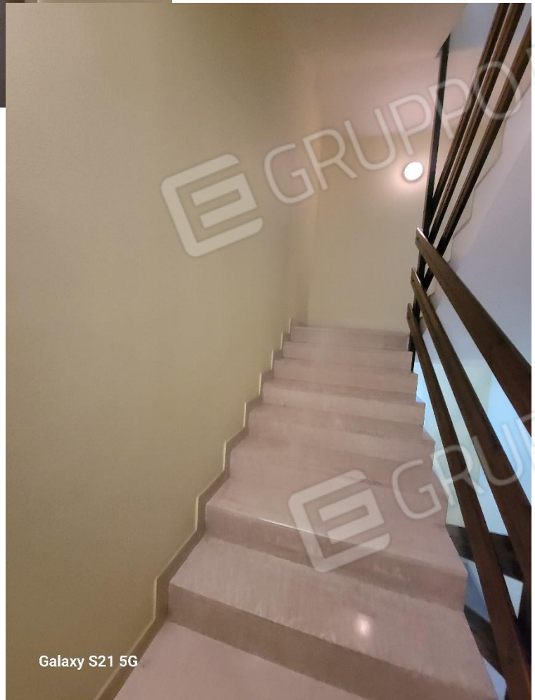
Figura 6 Ascensore e scala condominiale