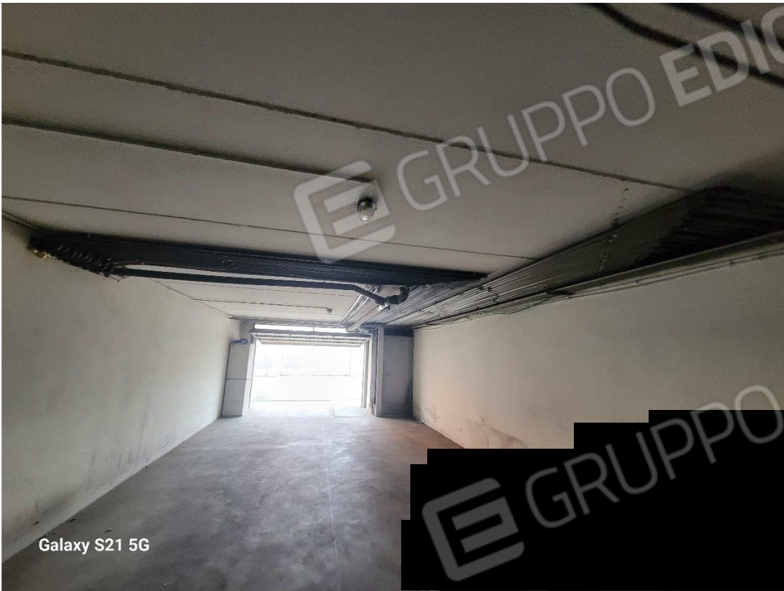
Figura 17 Interno garage da 6 posti auto