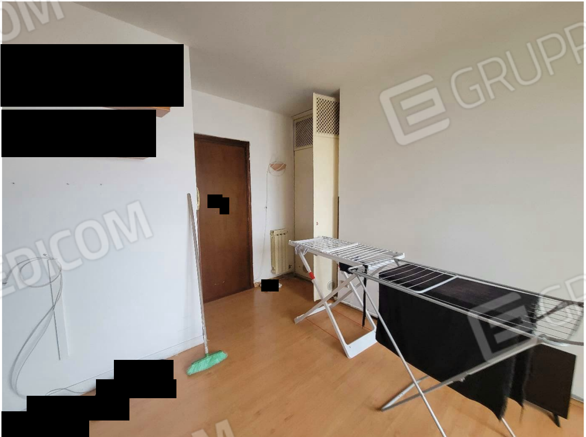
Figura 8 Interni appartamento