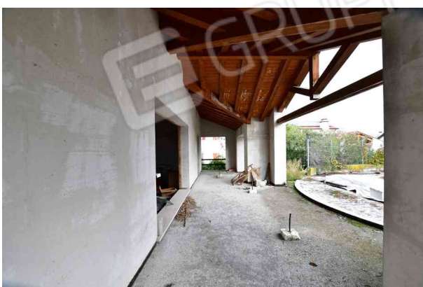
6. Portico, vista verso nord.

Riferimento per l'individuazione dei vani: allegato grafico n. 3 – rilievo stato di fatto.