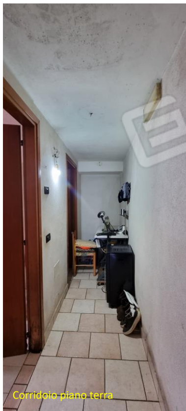
Corridoio piano terra