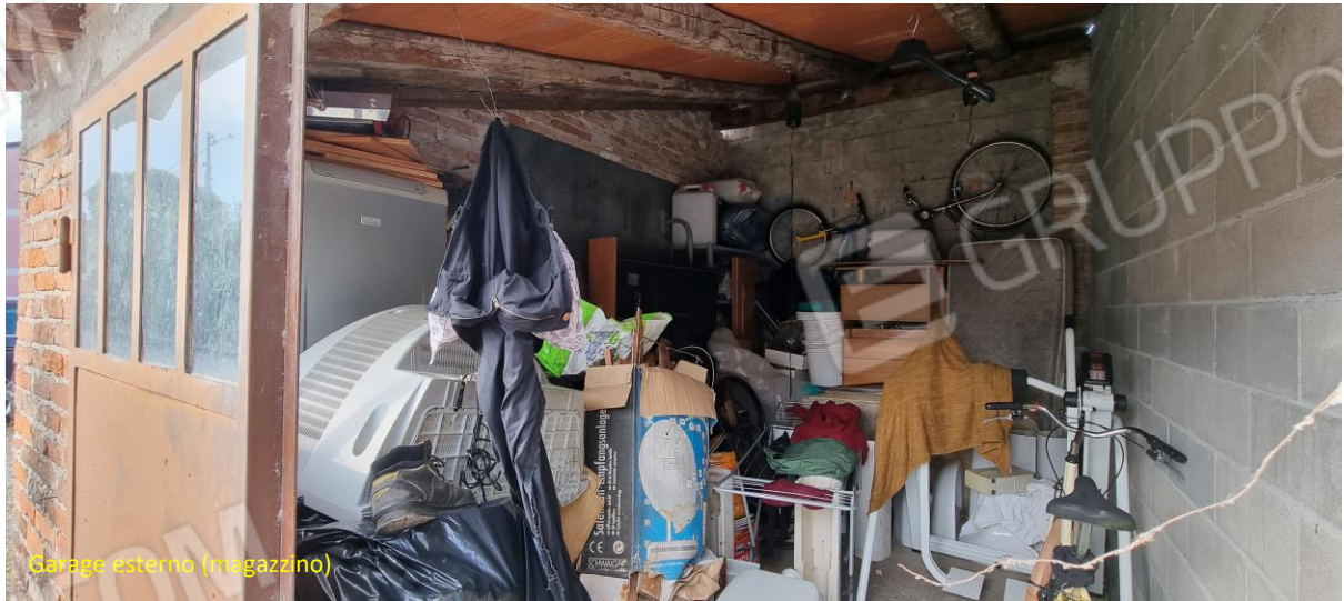
Garage esterno (magazzino)