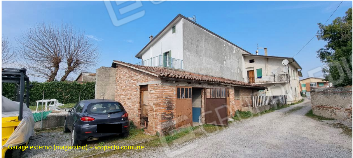
Garage esterno (magazzino) + scoperto comune