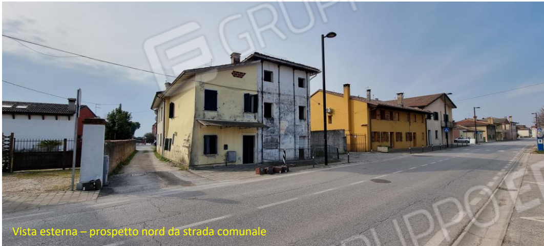
Vista esterna – prospetto nord da strada comunale