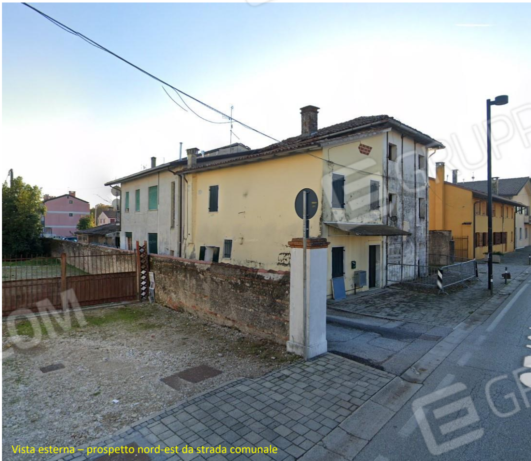
Vista esterna – prospetto nord-est da strada comunale