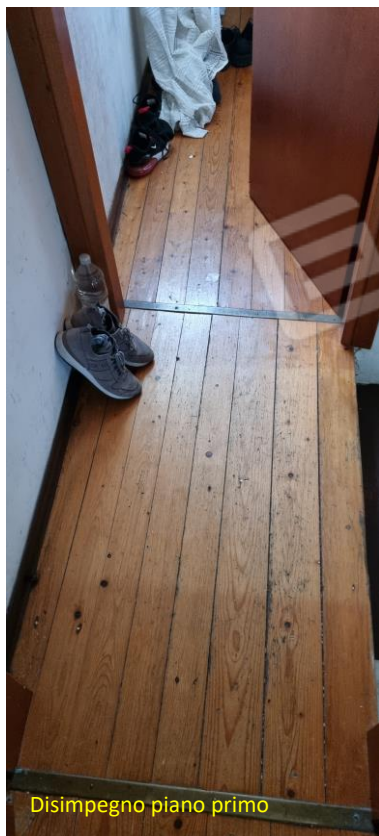
Disimpegno piano primo