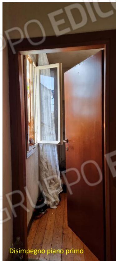
Disimpegno piano primo