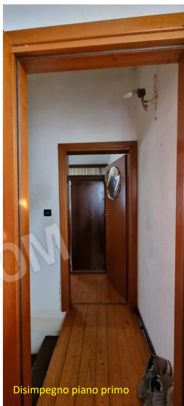
Disimpegno piano primo