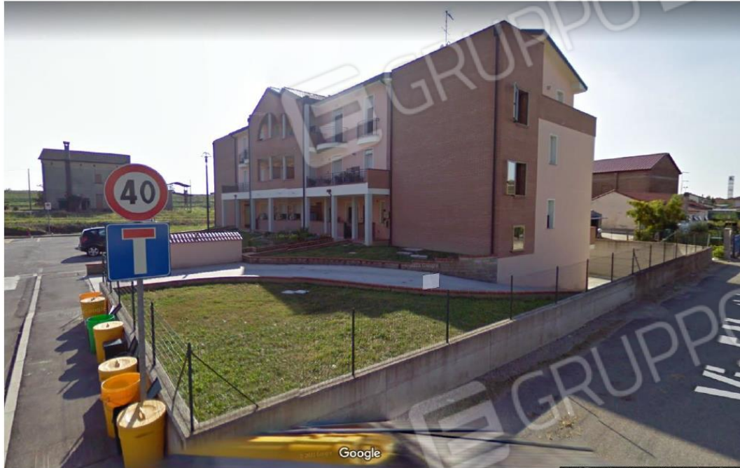
Foto 2. Prospetto principale condominio Greval