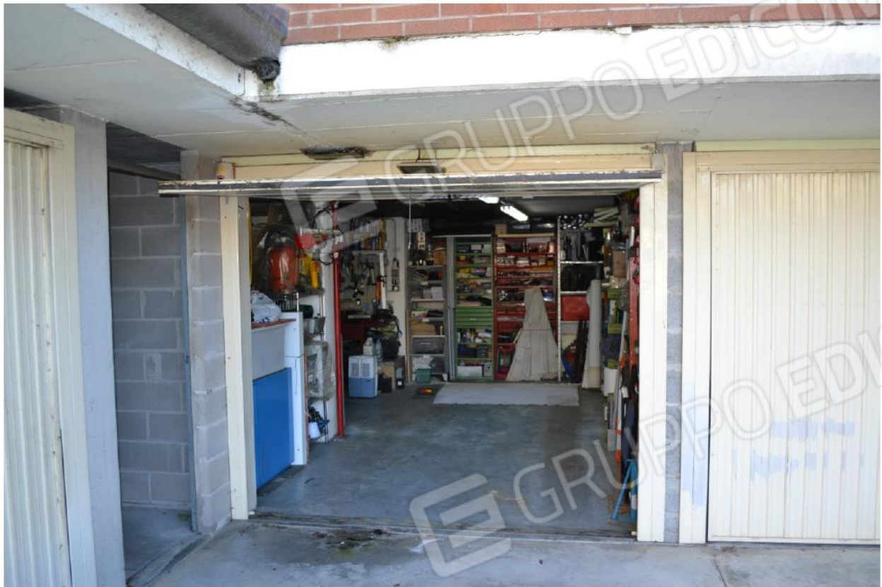
Foto 6. Portone di accesso garage sub.17