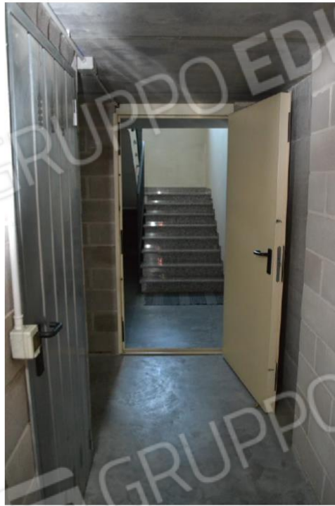
Foto 16. Porta tagliafuoco vano scala di accesso al disimpegno deposito sub.32