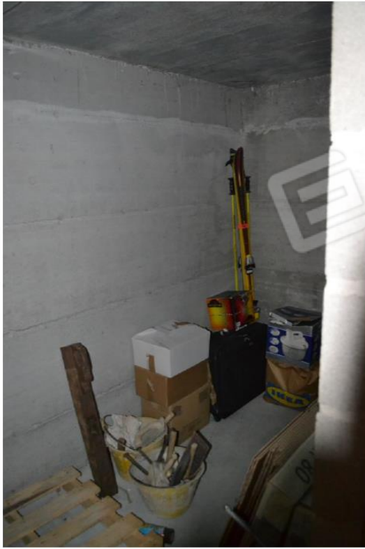
Foto 12. Interno deposito sub.28