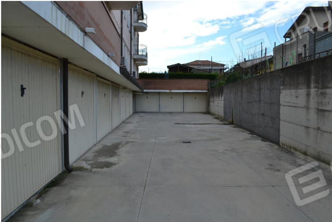
Foto 5. Viabilità carraia di accesso ai garages interrati