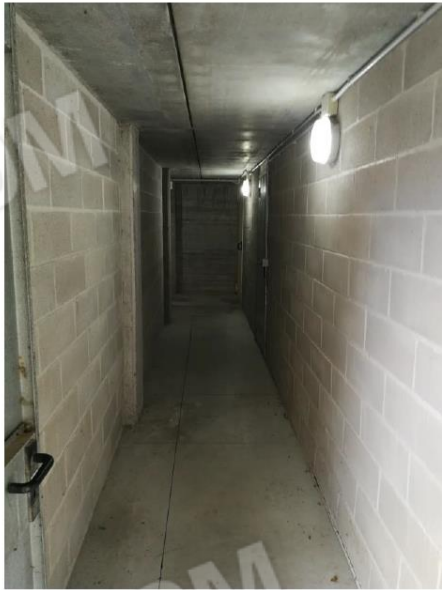
Foto 10. Disimpegno comune di accesso al magazzino sub.18 ed ai depositi sub.28 e sub.29