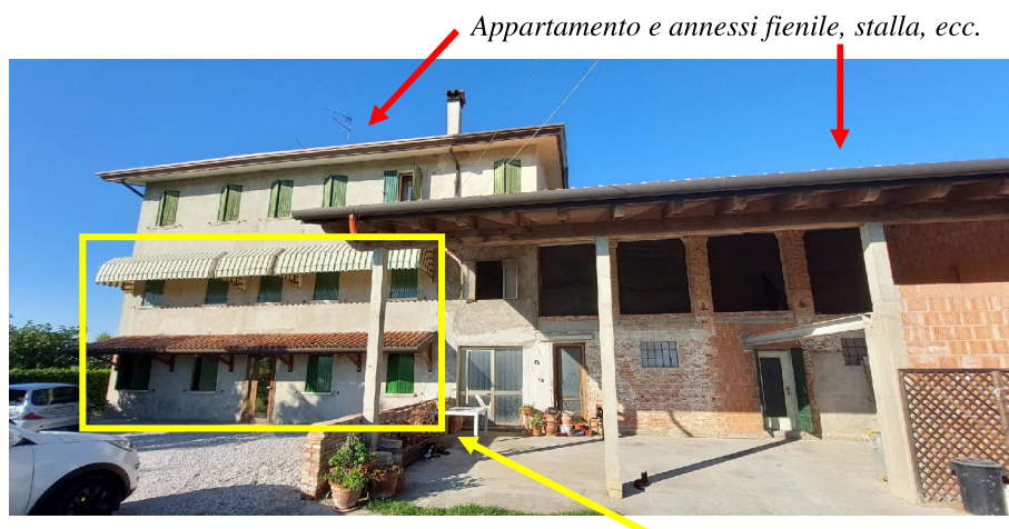
Edificio con evidenziato l'appartamento Sub. 3 non oggetto di pignoramento

Tutti i beni sopra citati condividono l'area scoperta, catastalmente definita "Bene Comune Non Censibile" identificata con il Subalterno 1, insieme con l'altro appartamento posto ai piani terra e primo (Subalterno 3) non oggetto della presente relazione, ma inserito nel medesimo edificio.