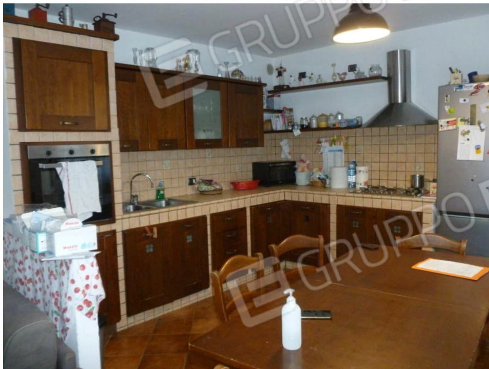
SOGGIORNO CON ANGOLO COTTURA