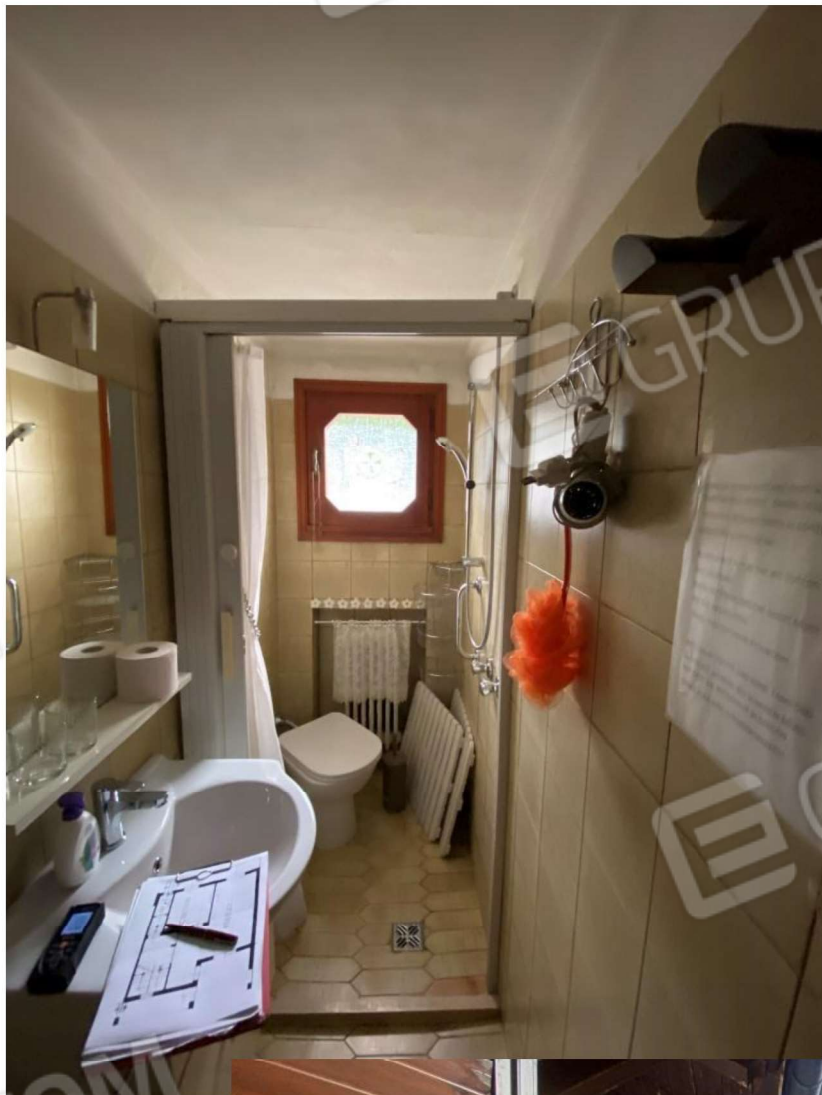
FOTO 7 IL BAGNO AL P. TERRA