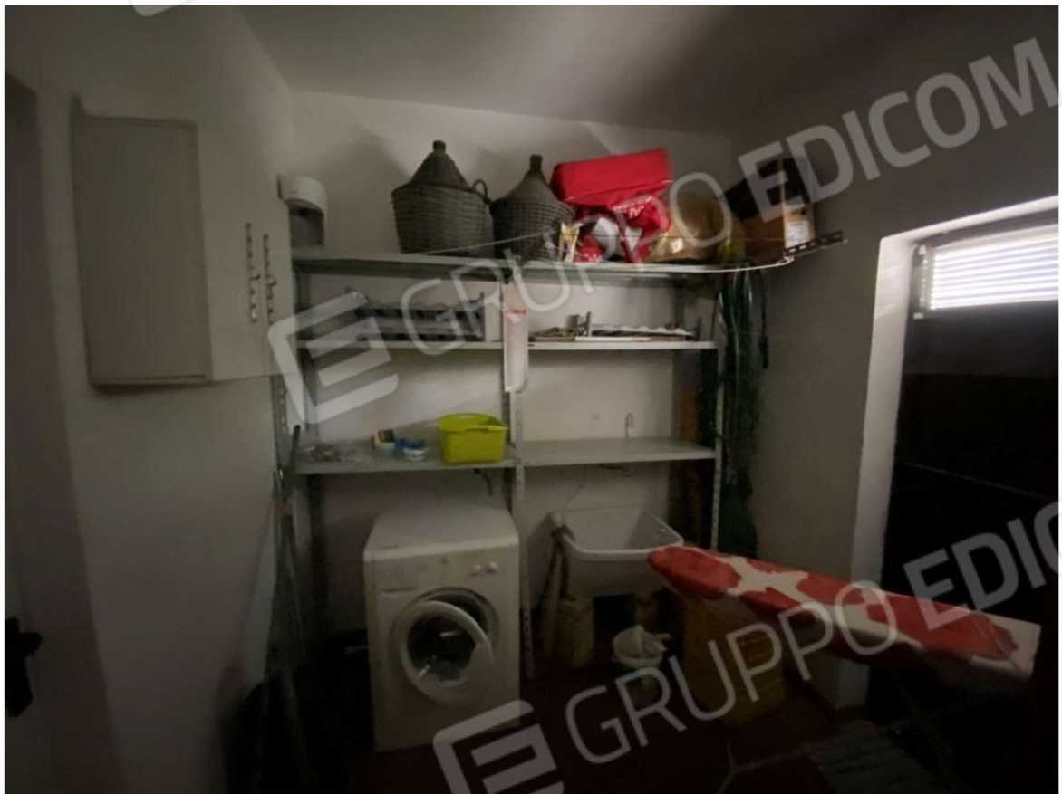
FOTO 14 IL MAGAZZINO RICAIVATO ALL'INTERNO DEL GARAGE