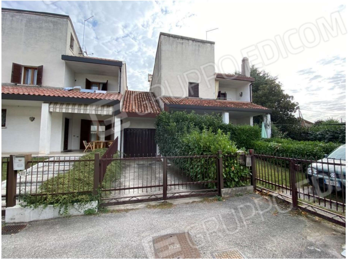
FOTO 1 ESTERNO GARAGE E ABITAZIONE