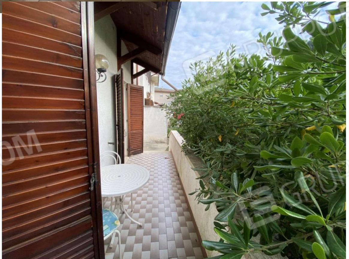
FOTO 8 L'ACCESSO AL RETRO DELLA CASA