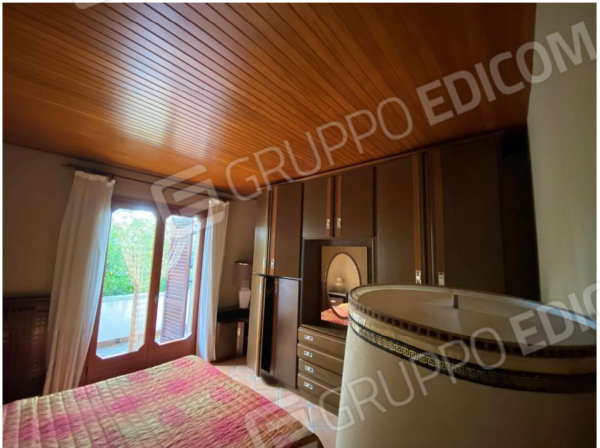
FOTO 5 CAMERA DA LETTO CON USCITA SUL RETRO