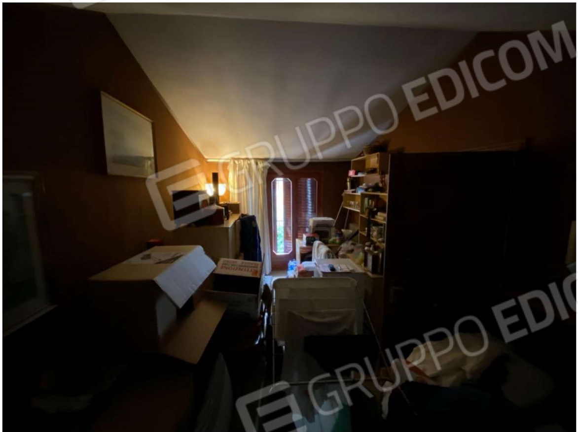
FOTO 10 CAMERA AL PIANO AMMEZZATO