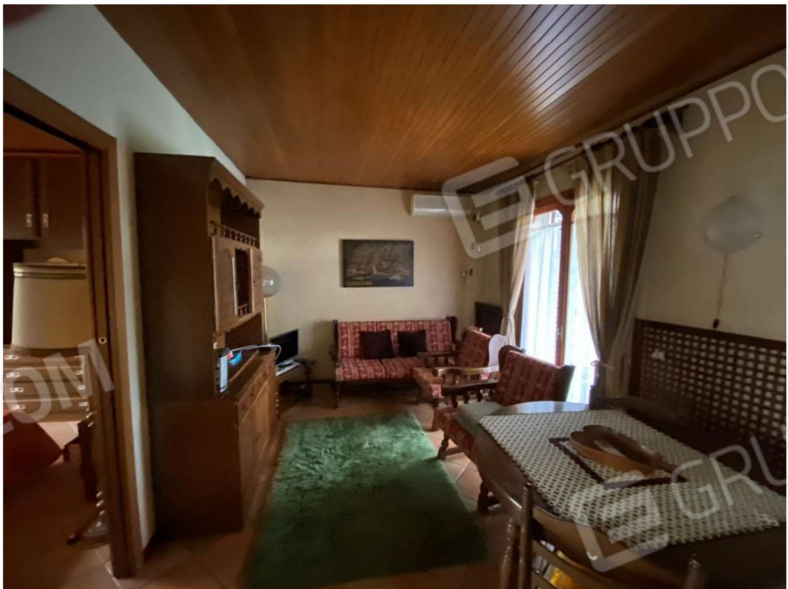
FOTO 4 SOGGIORNO E SULLA SINISTRA IL MURO DIVISORIO (ABUSIVO) CON LA CAMERA DA LETTO