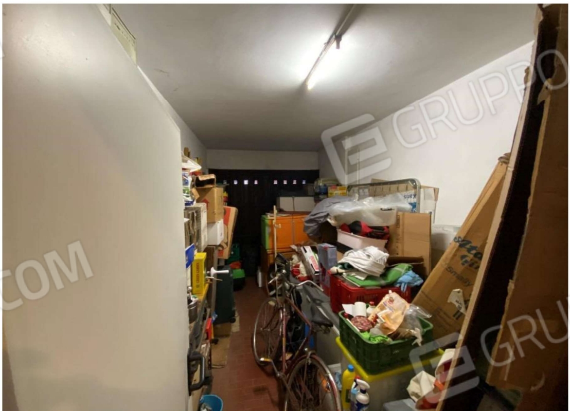
FOTO 15 IL GARAGE