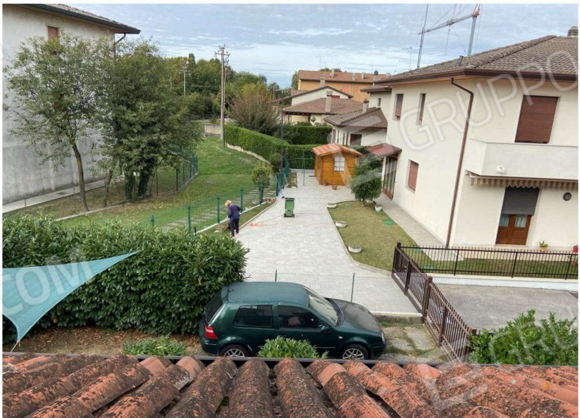
FOTO 11 ESTRENO DAL PRIMO PIANO VERSO L'ACCESSO