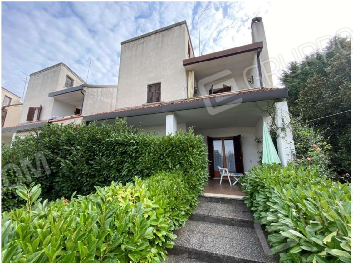
FOTO 2 ESTERNO ACCESSO ABITAZIONE