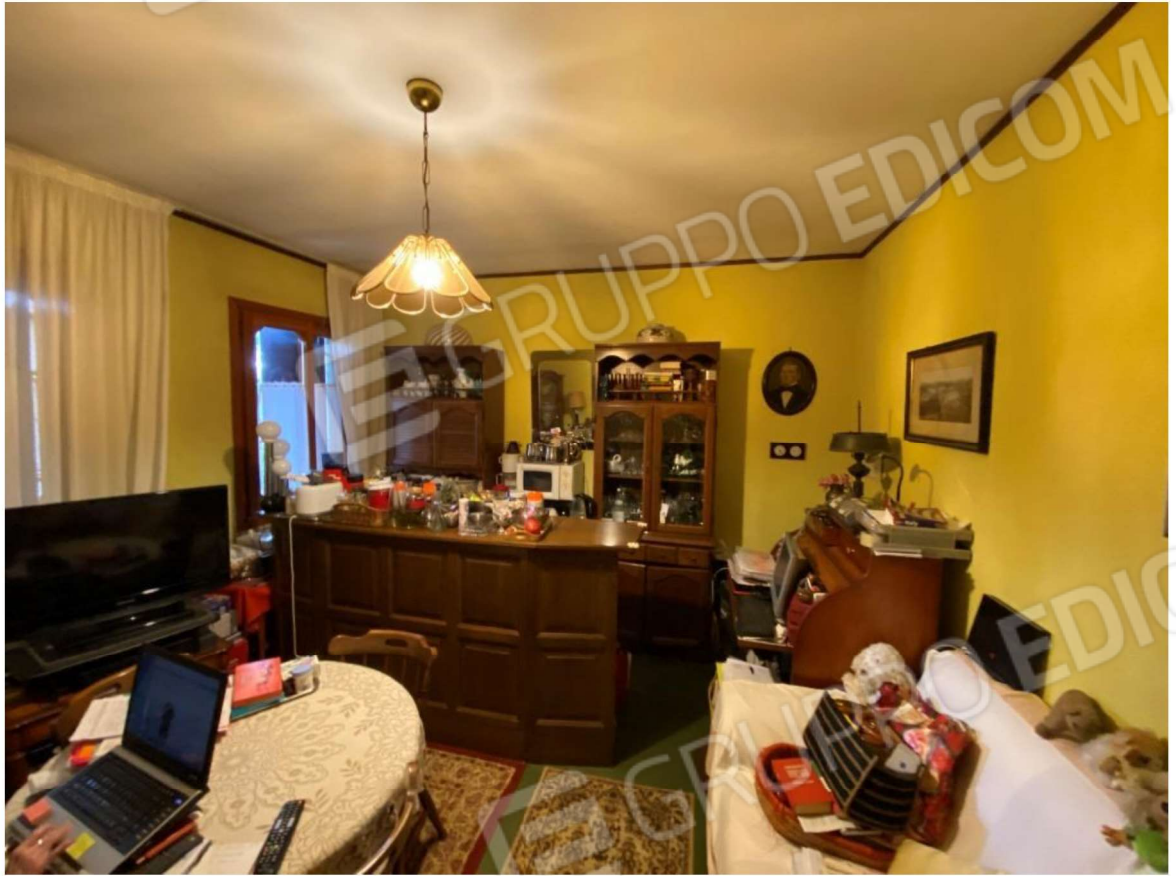
FOTO 12 CAMERA AL PIANO PRIMO