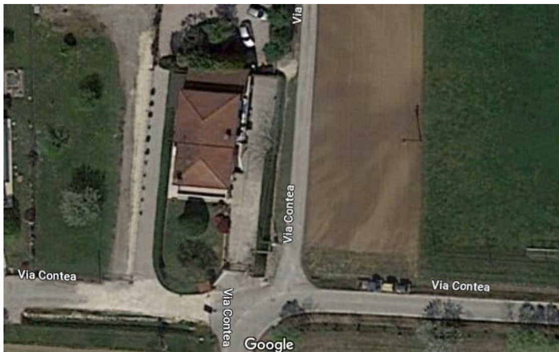
Vista aerea con individuazione dei manufatti edilizi