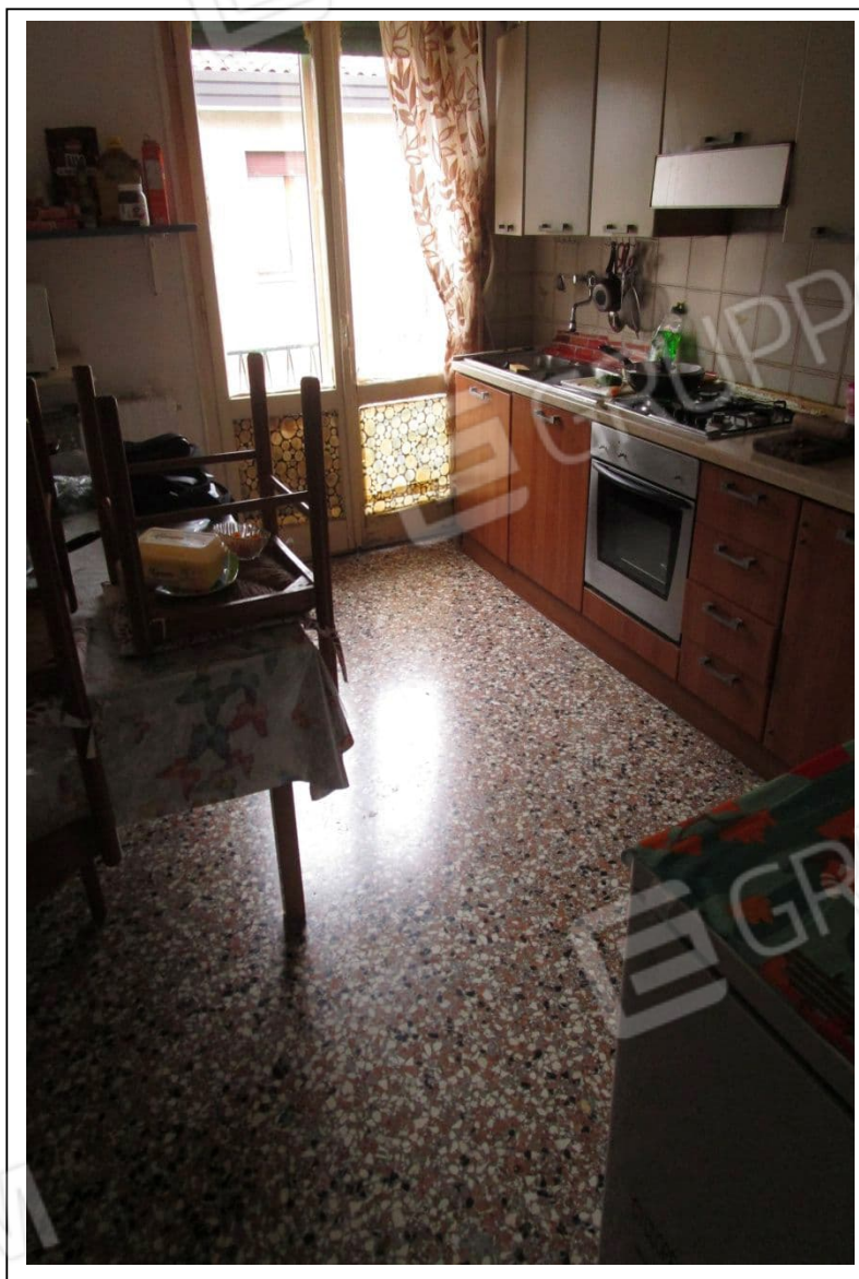
Fotogramma 4/6 – Particolare della cucina.