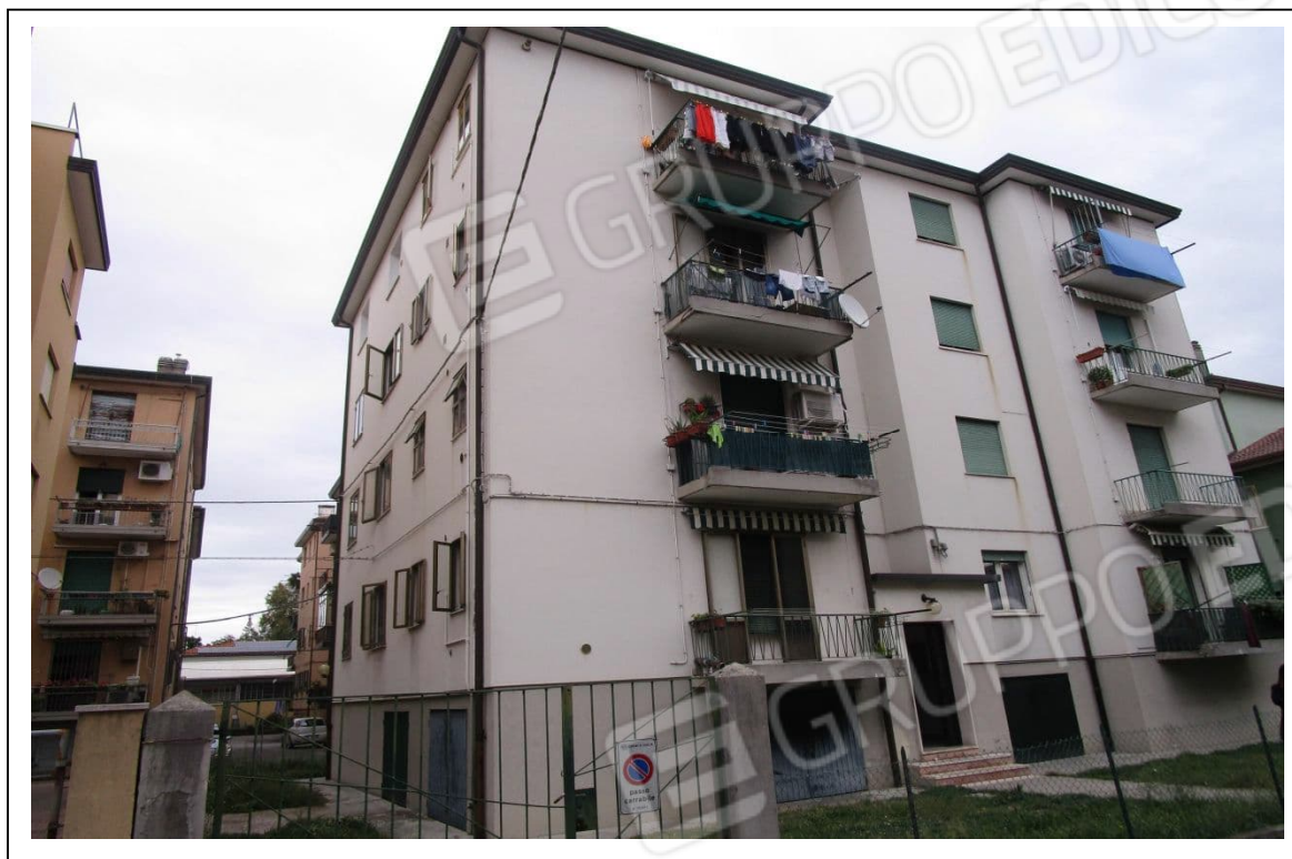
Fotogramma 1/6 – Particolare prospetto del condomini.