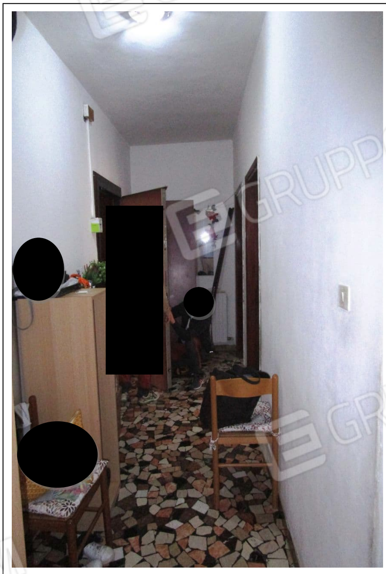
Fotogramma 6/6– Particolare dell'ingresso.