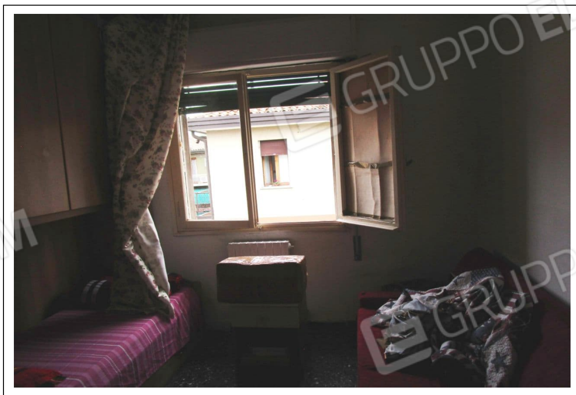
Fotogramma 5/6 – Particolare della camera.