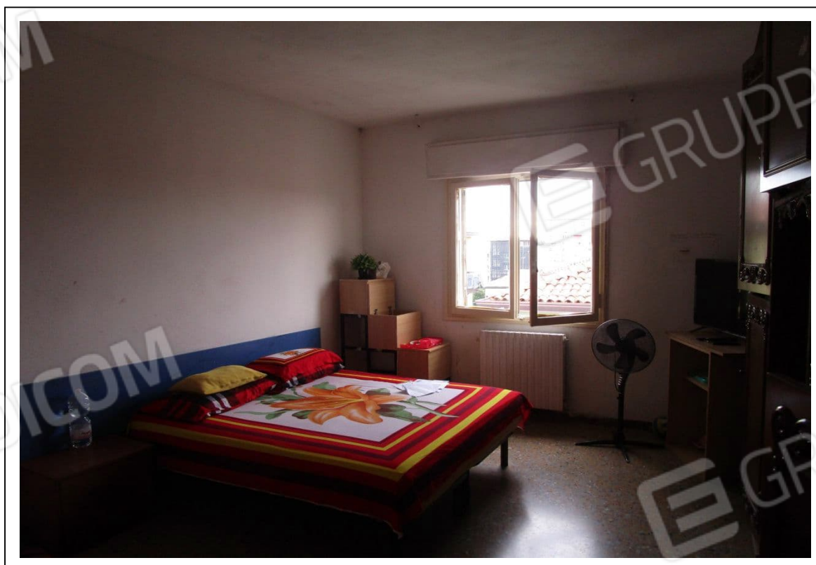
Fotogramma 2/6 – Particolare della camera.