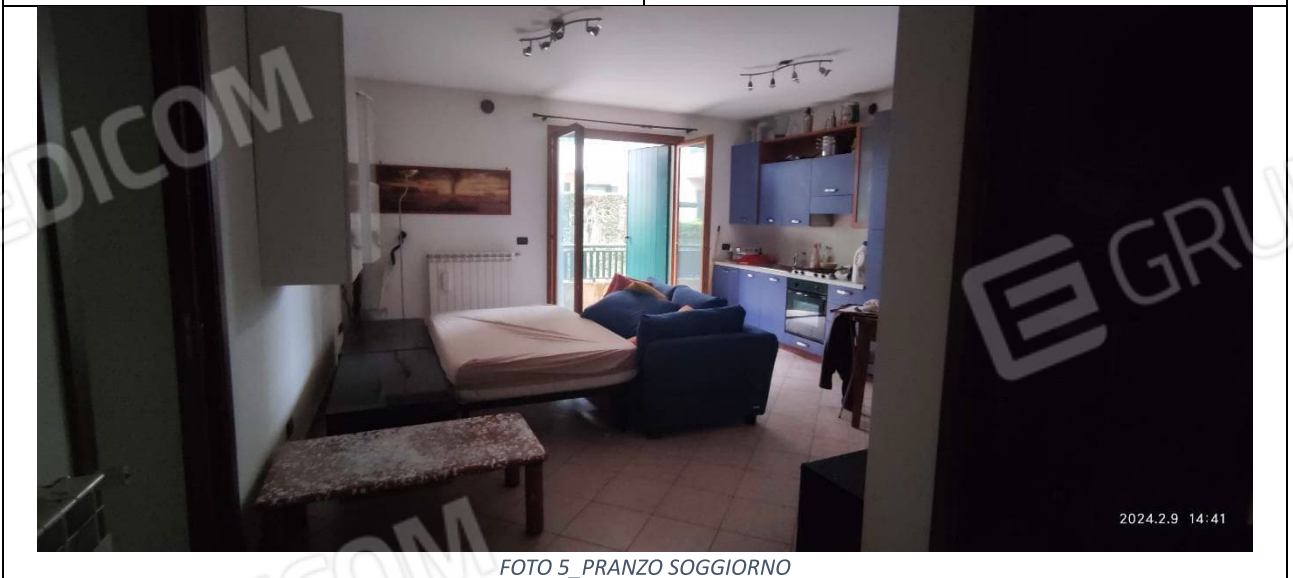
FOTO 5_PRANZO SOGGIORNO