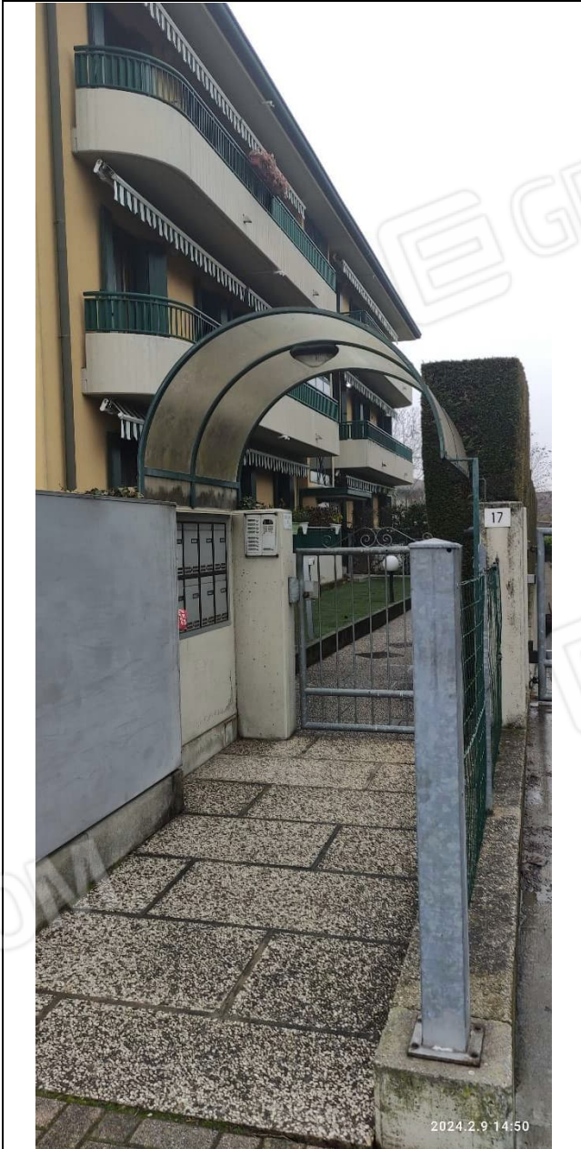
FOTO 3_INGRESSO PEDONALE CIV. 17_PROSPETTO SUD