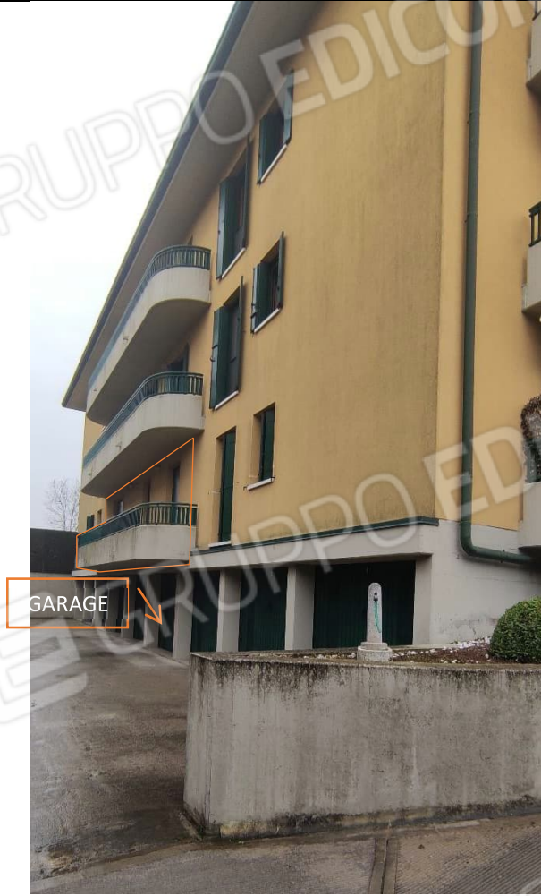
FOTO 2_PROSPETTO NORD_APPARTAMENTO E GARAGE OGGETTO DELL'ESECUZIONE IMMOBILIARE