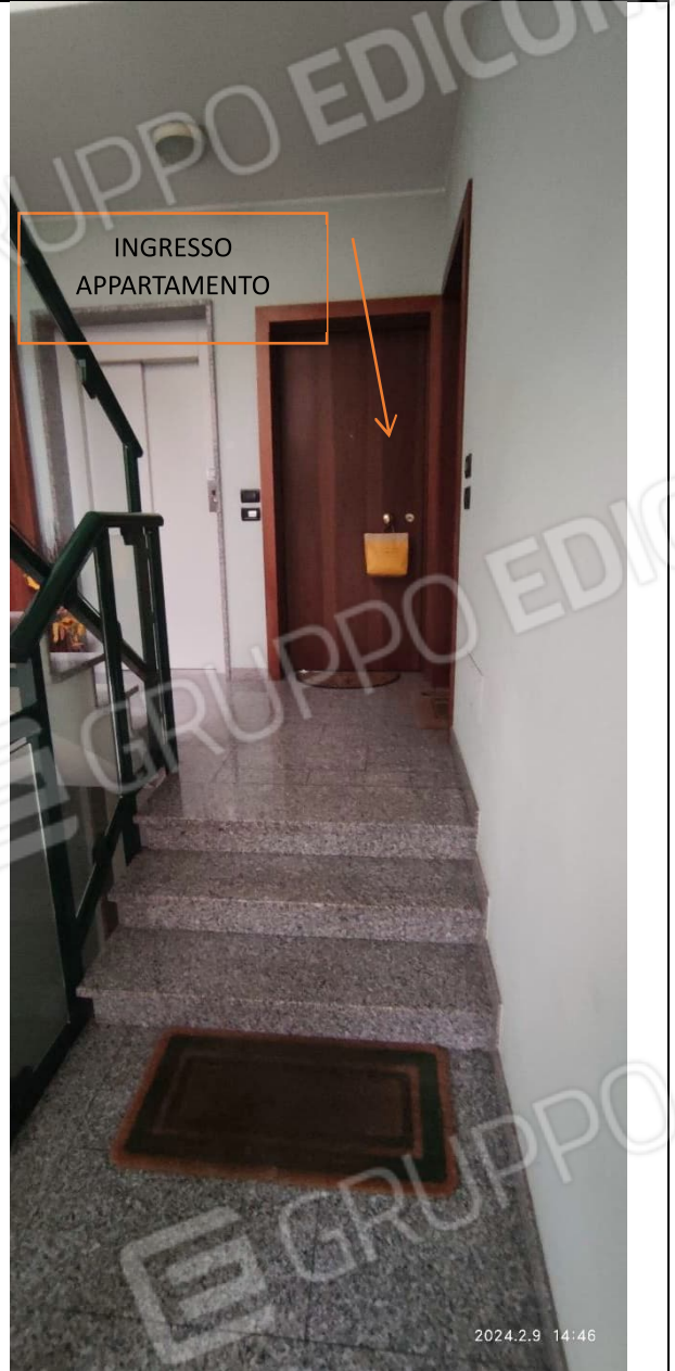
FOTO 4_INGRESSO ATRIO COMUNE