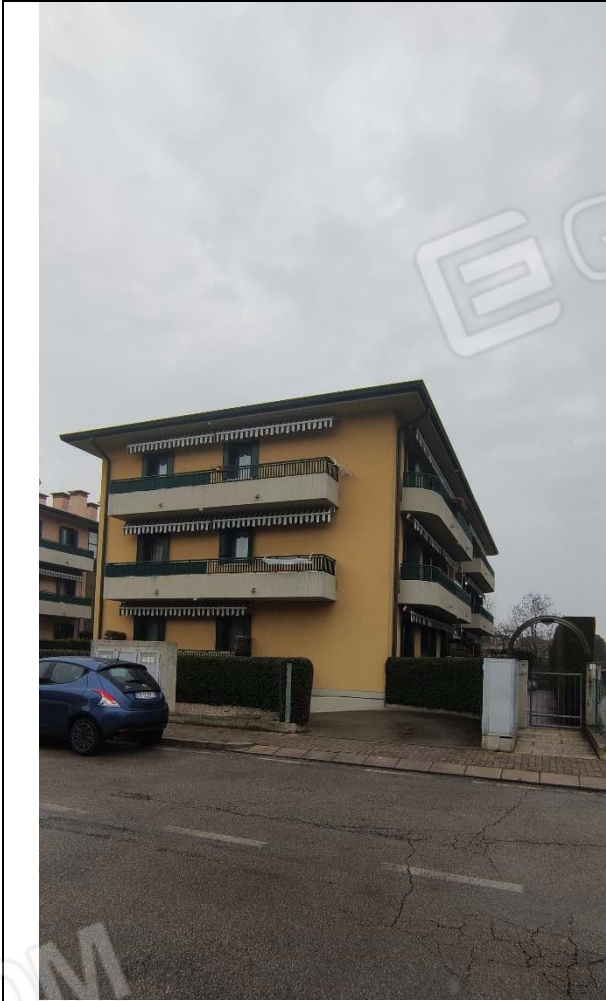
FOTO 1_AFFACCIO SU STRADA DEL CONDOMINIO TULIPANO CIV. 17