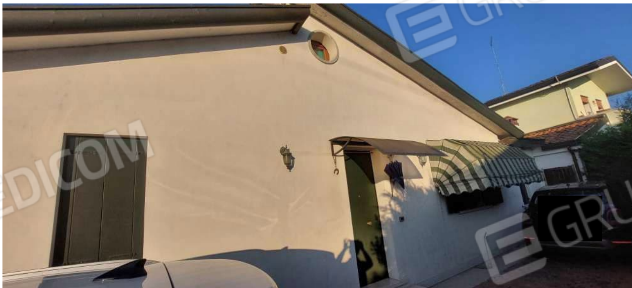
Vista del prospetto Sud