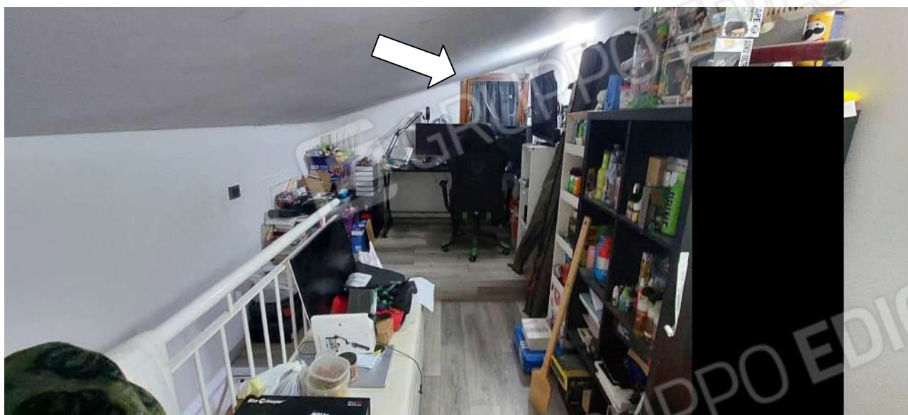
Sottotetto con finestra oblò