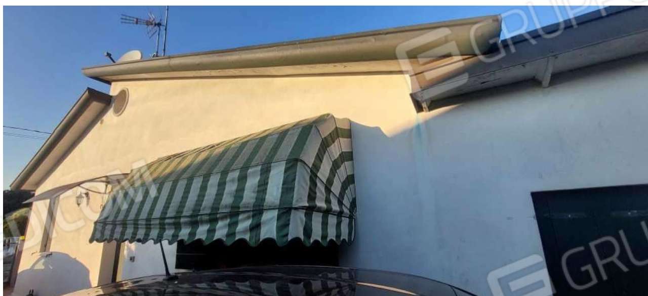
Vista del prospetto Sud