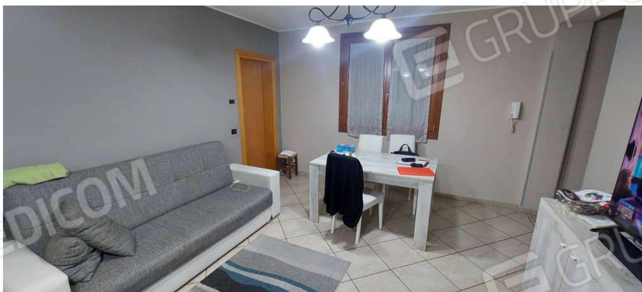
Soggiorno / pranzo