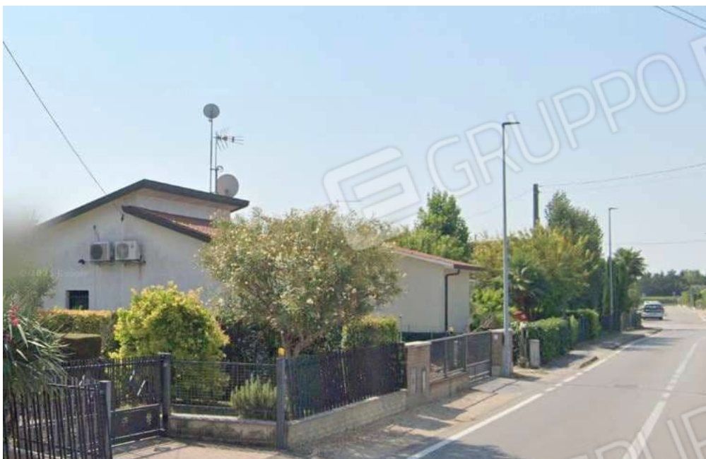
Vista dell'edificio da Via Guglielmo Marconi