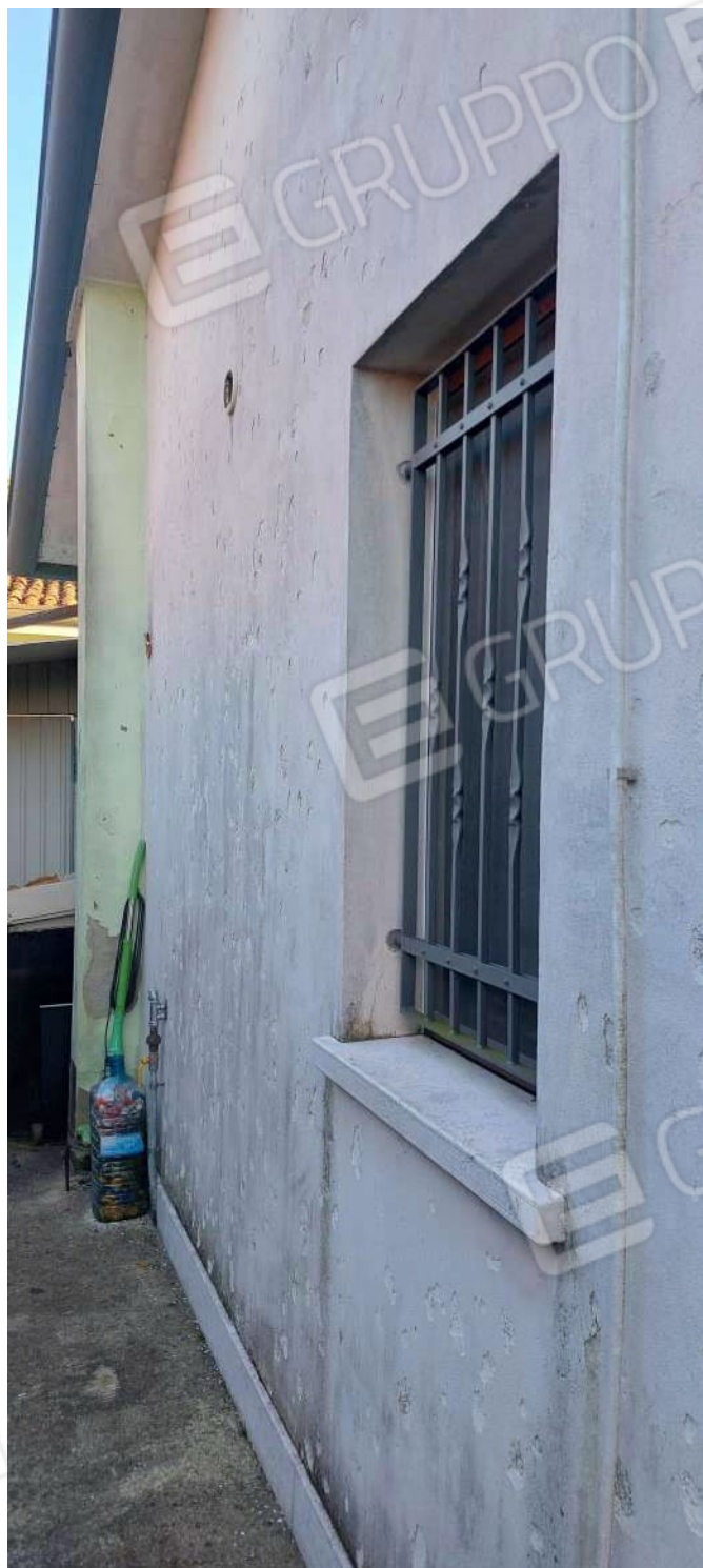
Finestra nel prospetto Nord (non autorizzata)