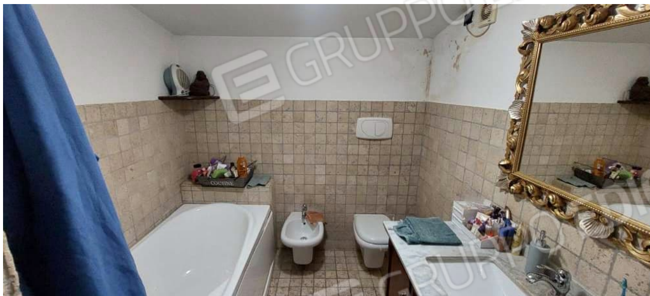
Bagno (senza disimpegno)