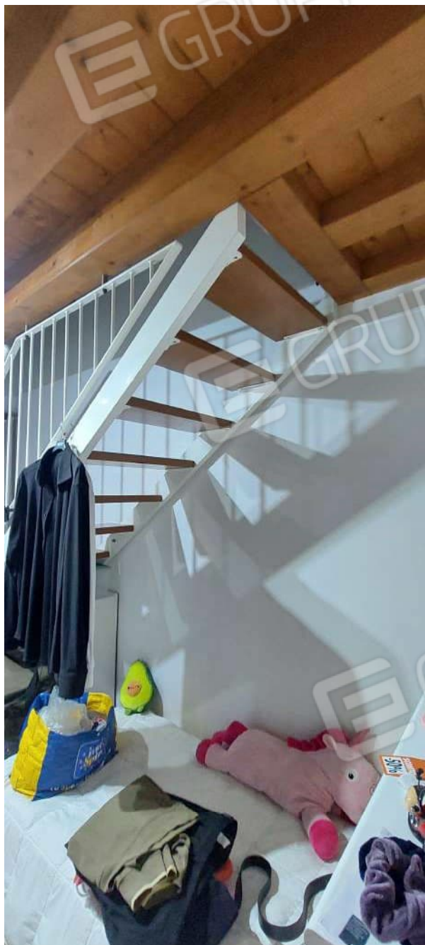
Scala di accesso al sottotetto