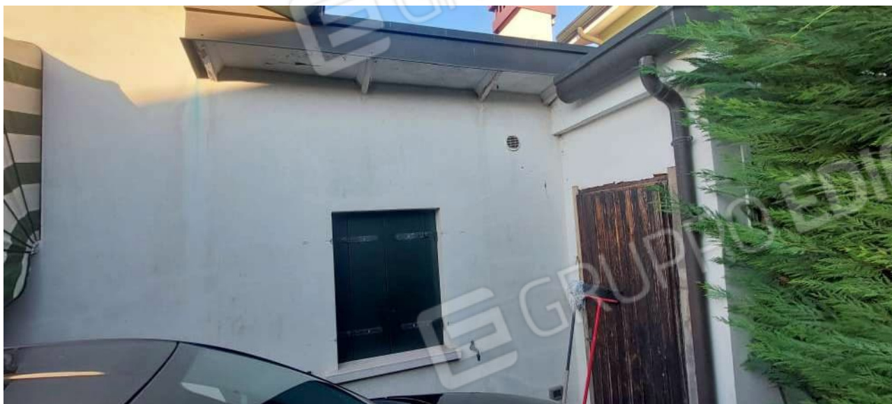
Finestra del bagno