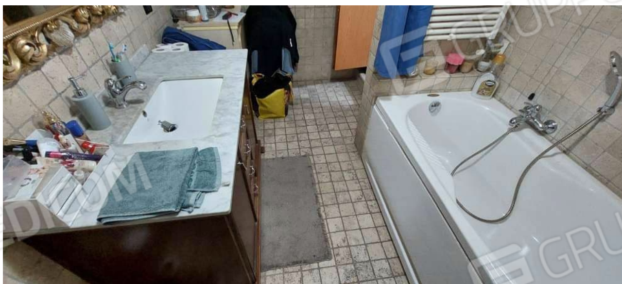
Bagno (senza disimpegno)