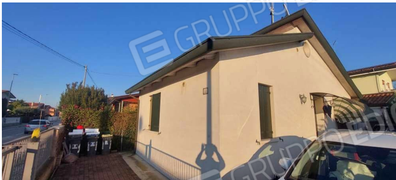
Vista dei prospetti Sud-Ovest