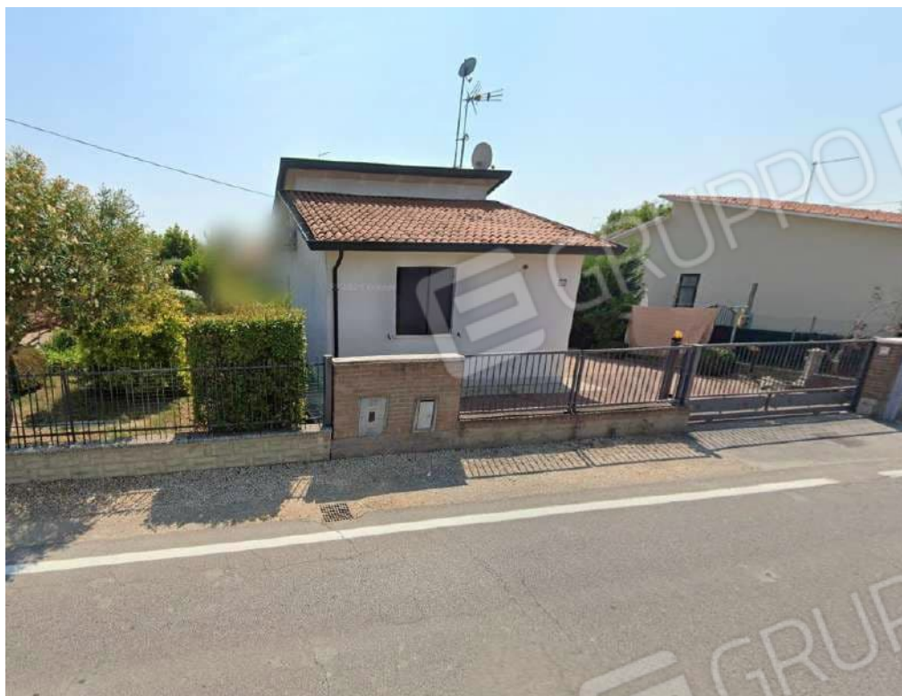
Vista dell'edificio da Via Guglielmo Marconi