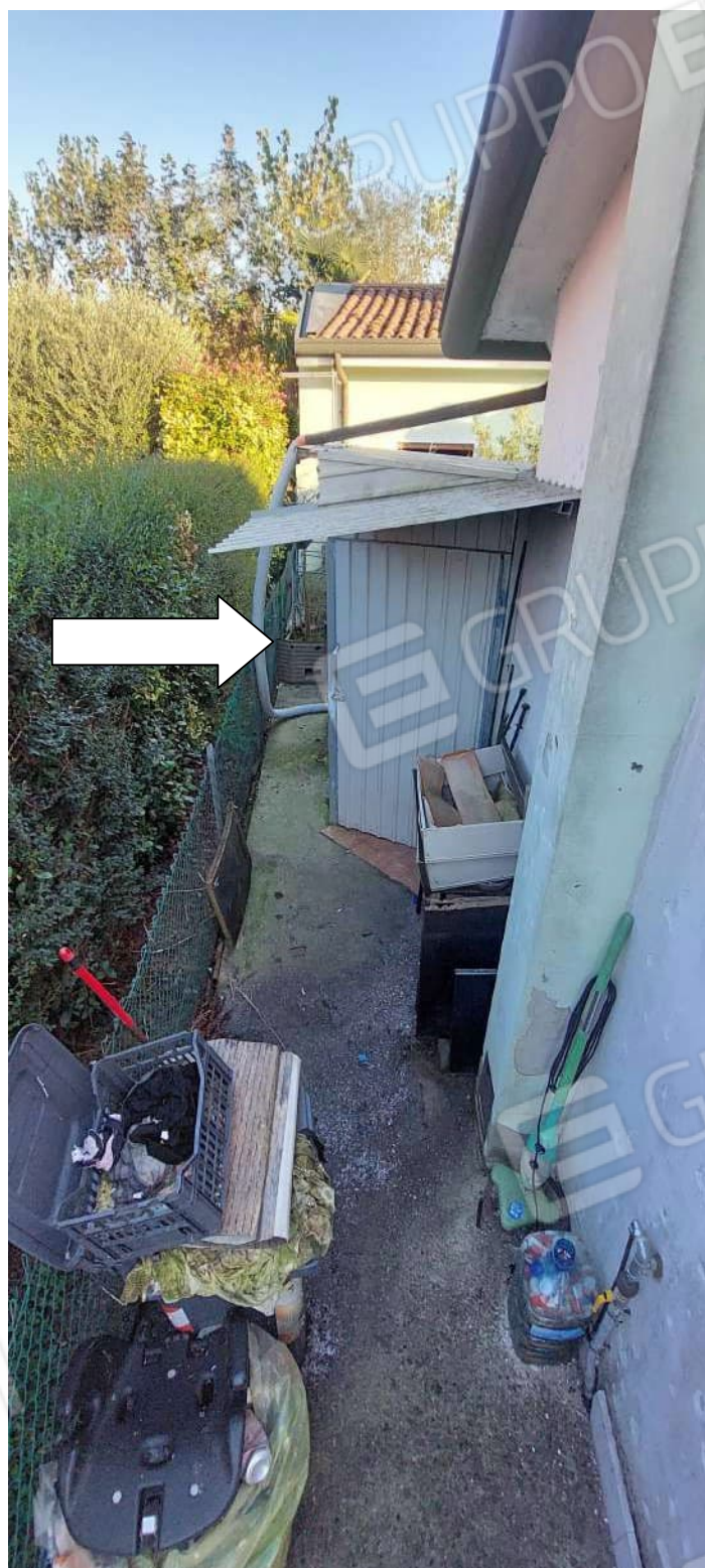
Box in lamiera non autorizzato