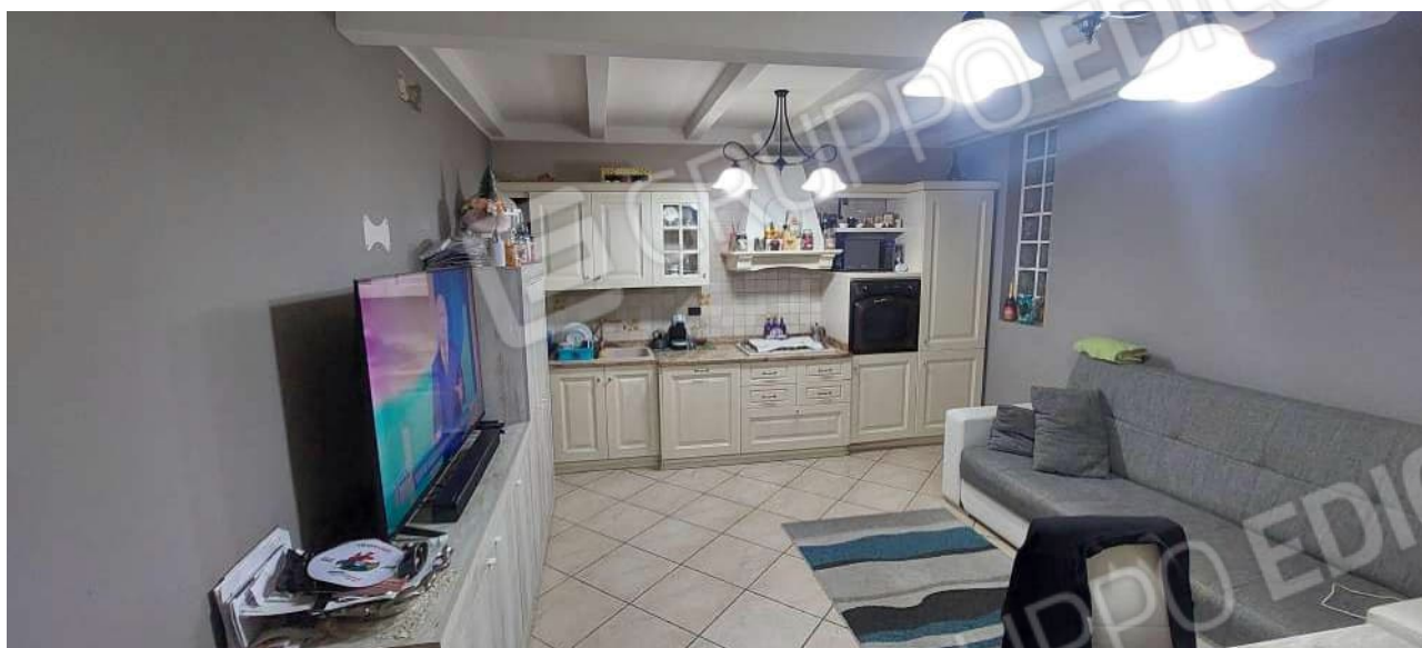
Soggiorno / pranzo