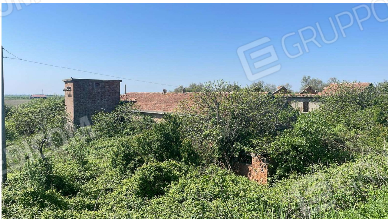
Vista attuale 2024