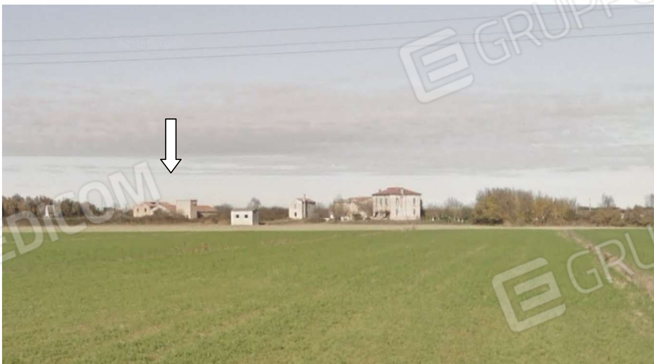
Vista dalla campagna