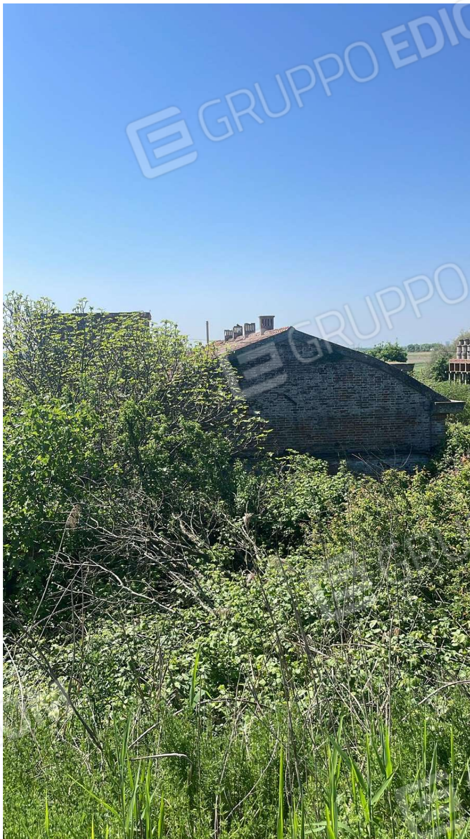
Vista attuale 2024