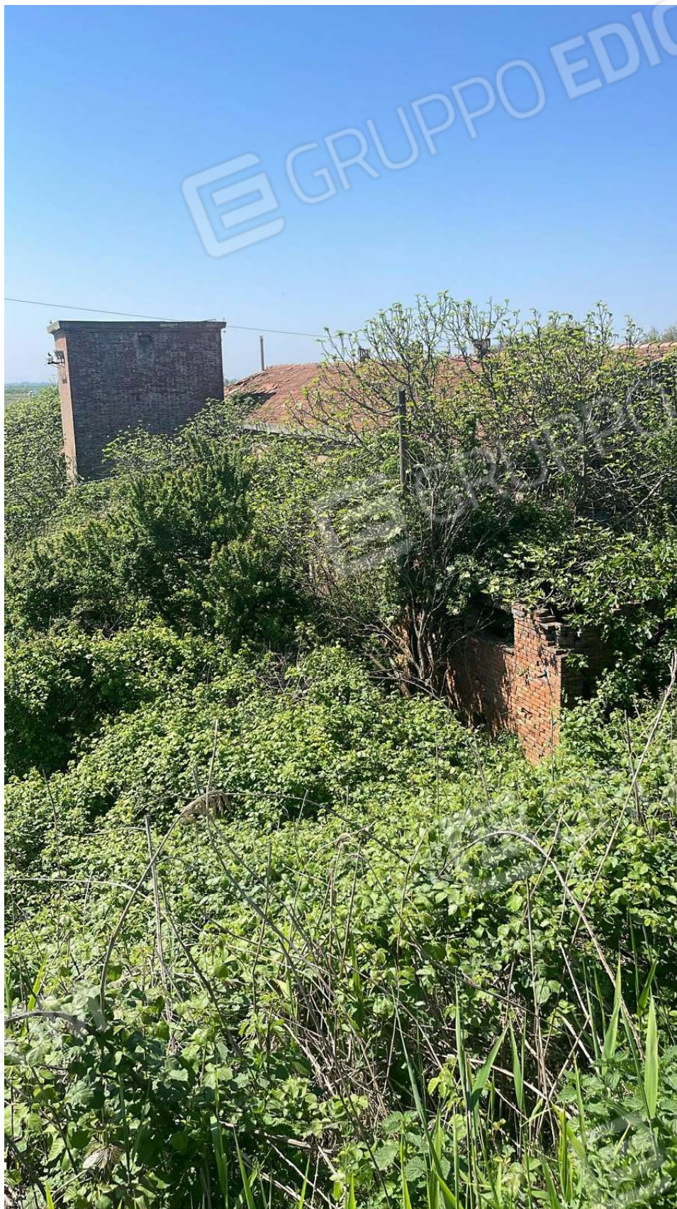
Vista attuale 2024