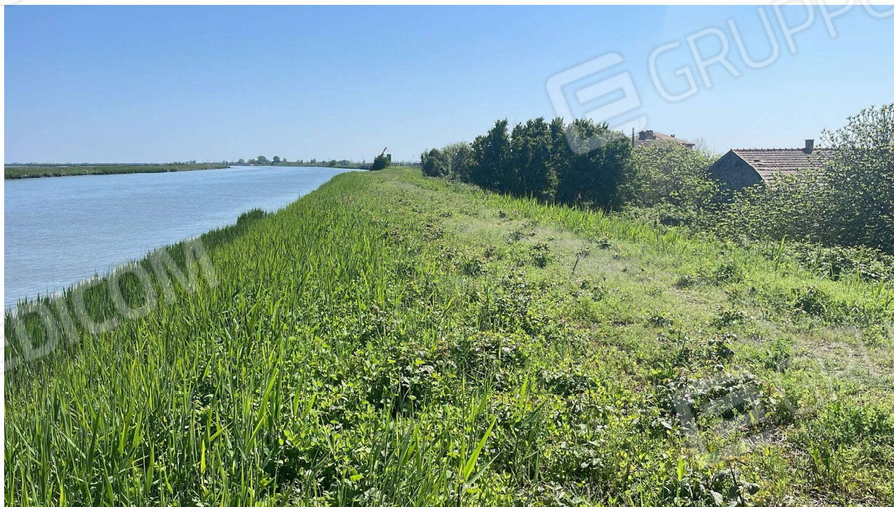
Vista attuale 2024