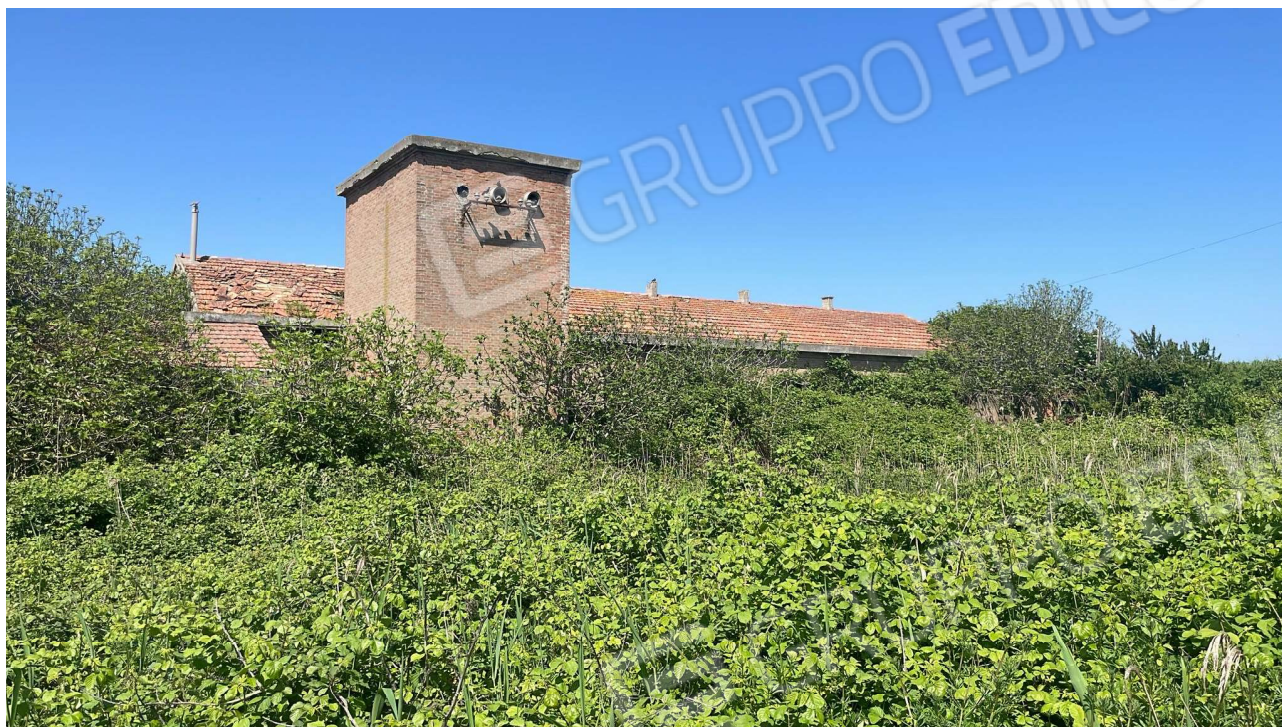
Vista attuale 2024