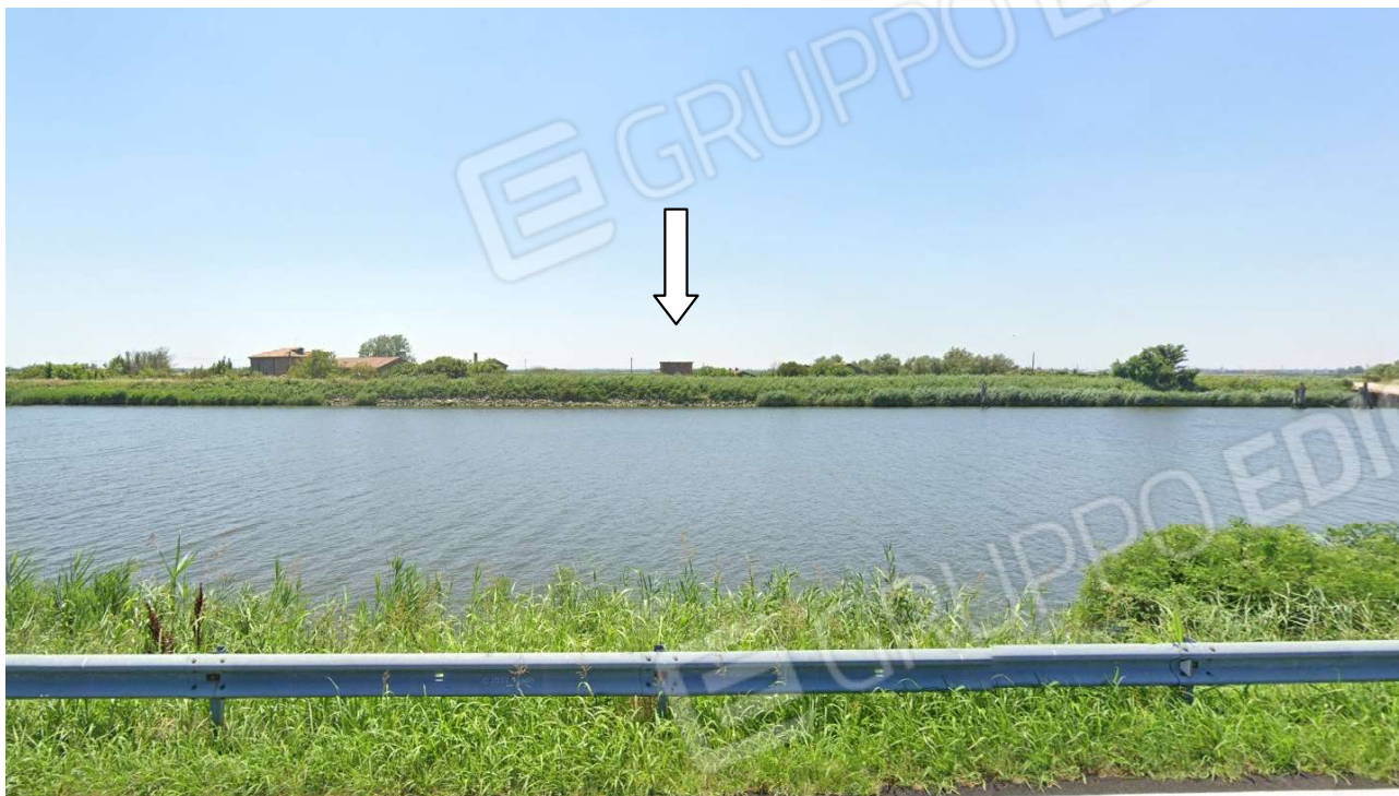
Vista da Via Po di Levante