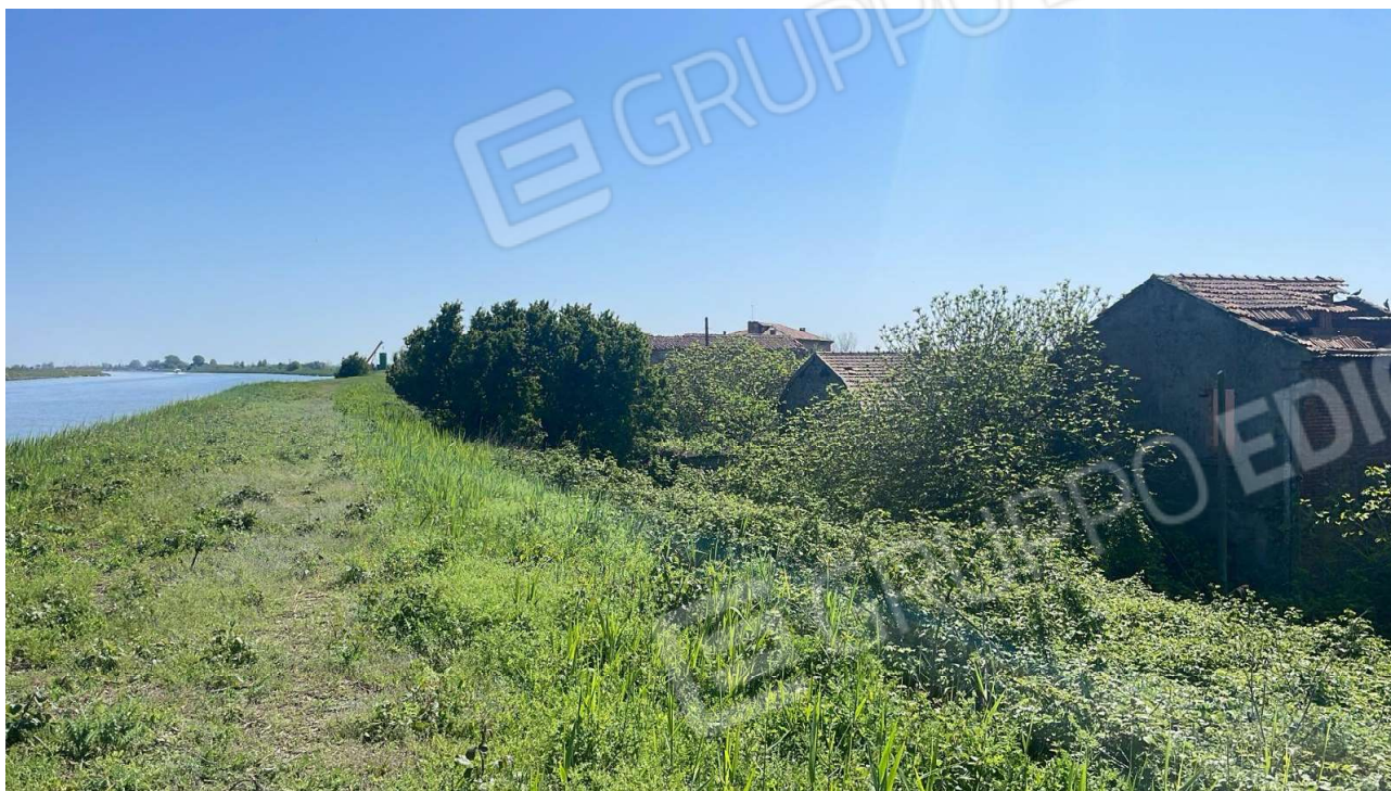
Vista attuale 2024