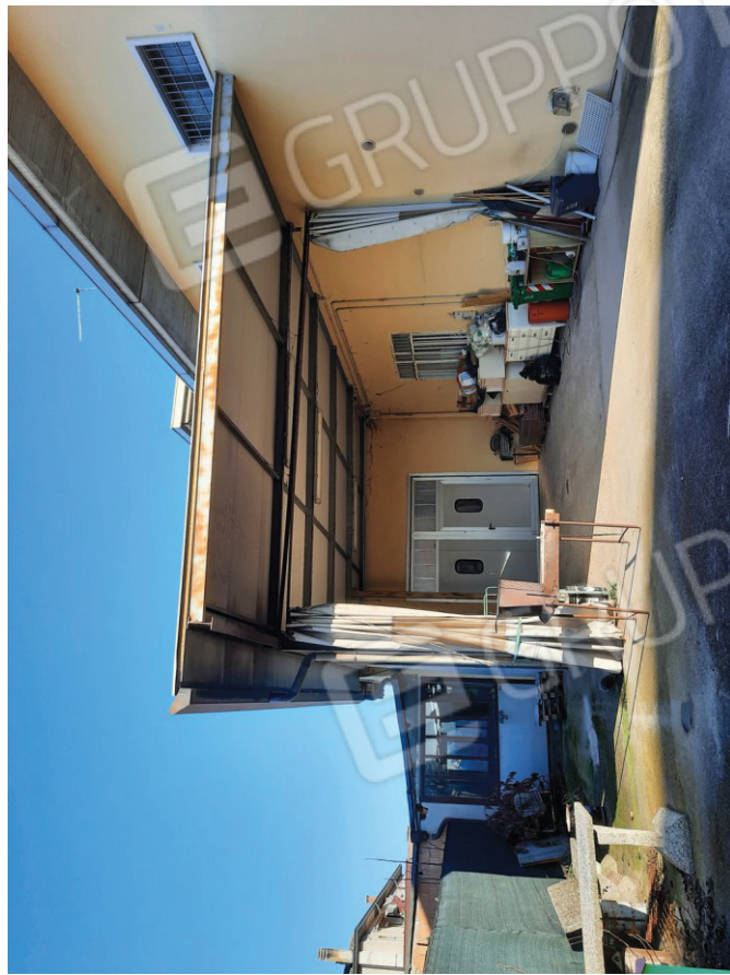
Tettoia esterna da demolire