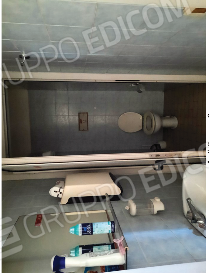
Anti 2 e wc 2