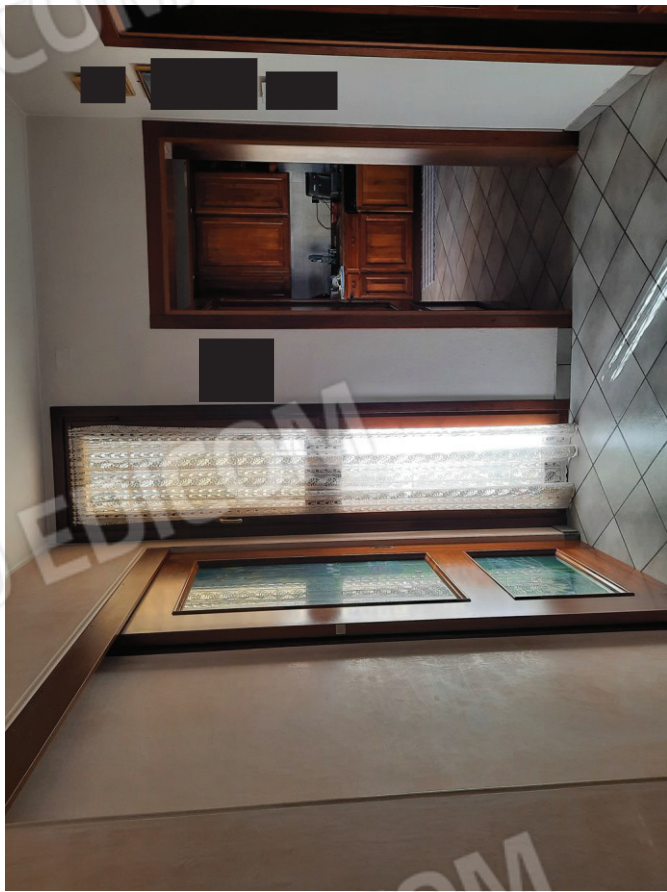
Piano primo: Ingresso