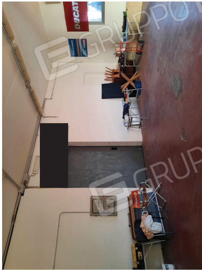
Laboratorio lato ingresso magazzino 1