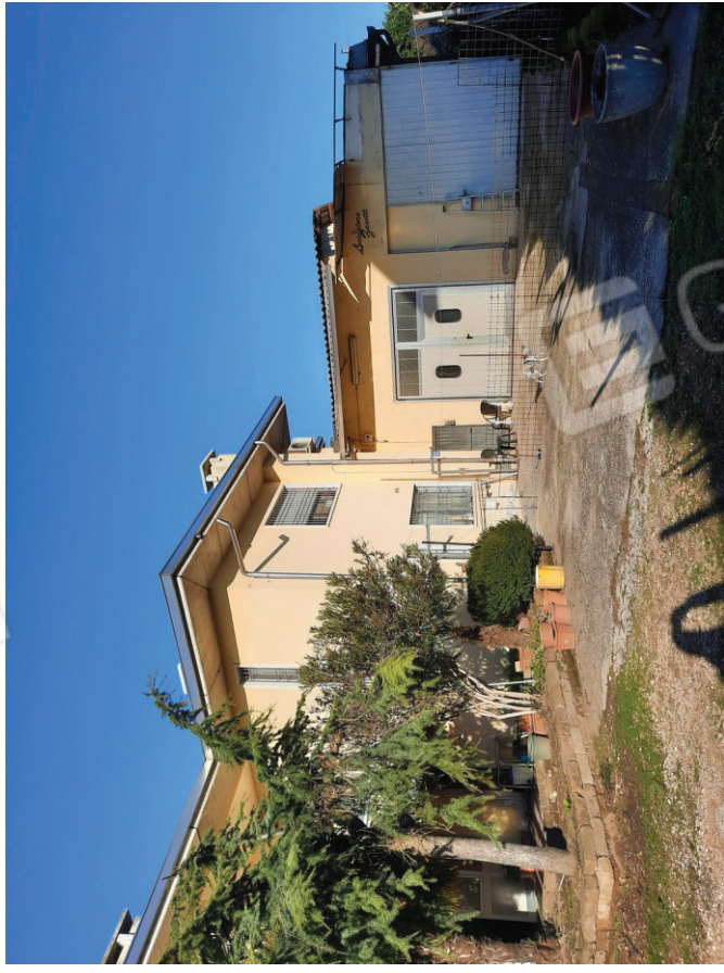
Vista dell'edificio dalla corte comune (sub.5)