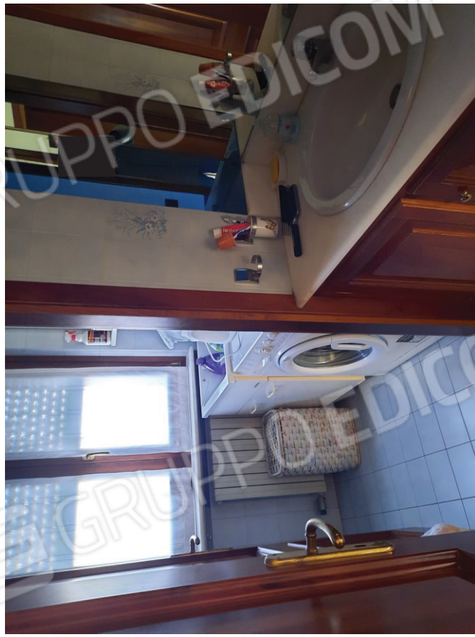
Bagno 1 con antibagno