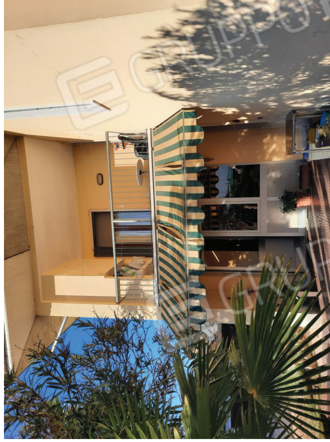
Vista dell'ingresso all'immobile