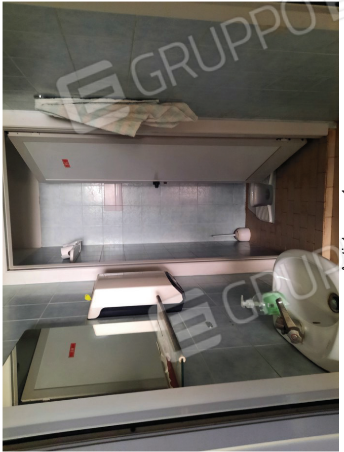
Anti 1 e wc 1