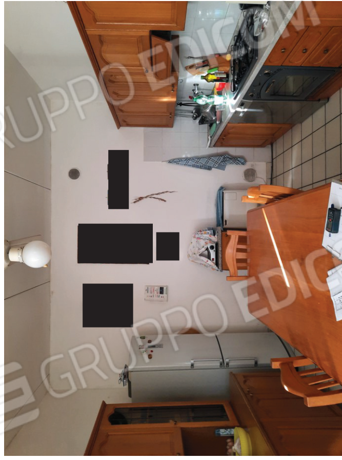
Piano terra: Taverna (ex garage)