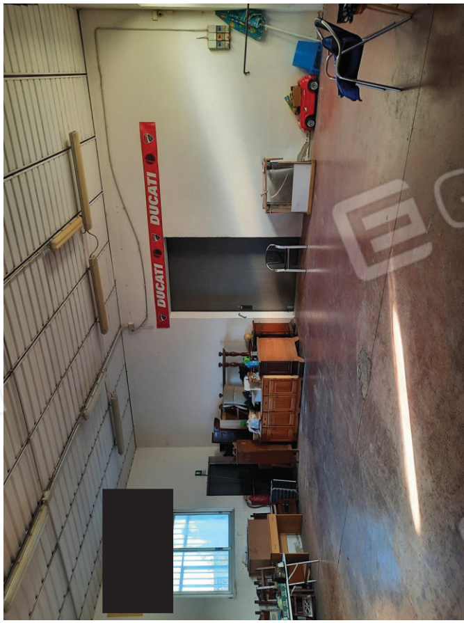
Laboratorio lato ingresso magazzino 2