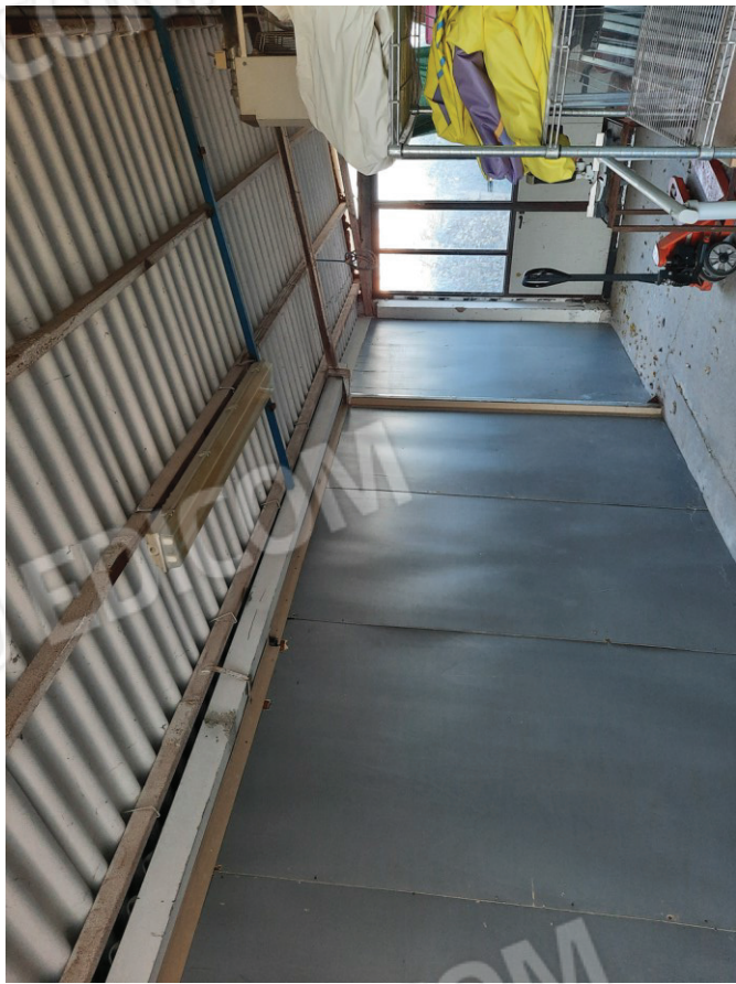
Ex tettoia da demolire (cfr. elaborato grafico)