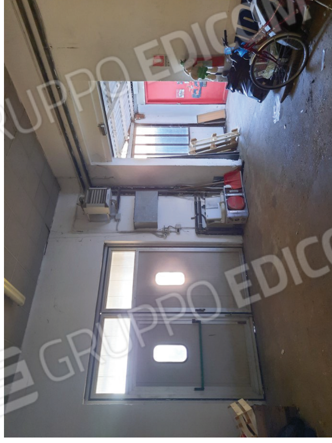
Magazzino 1 lato ingresso ex tettoia