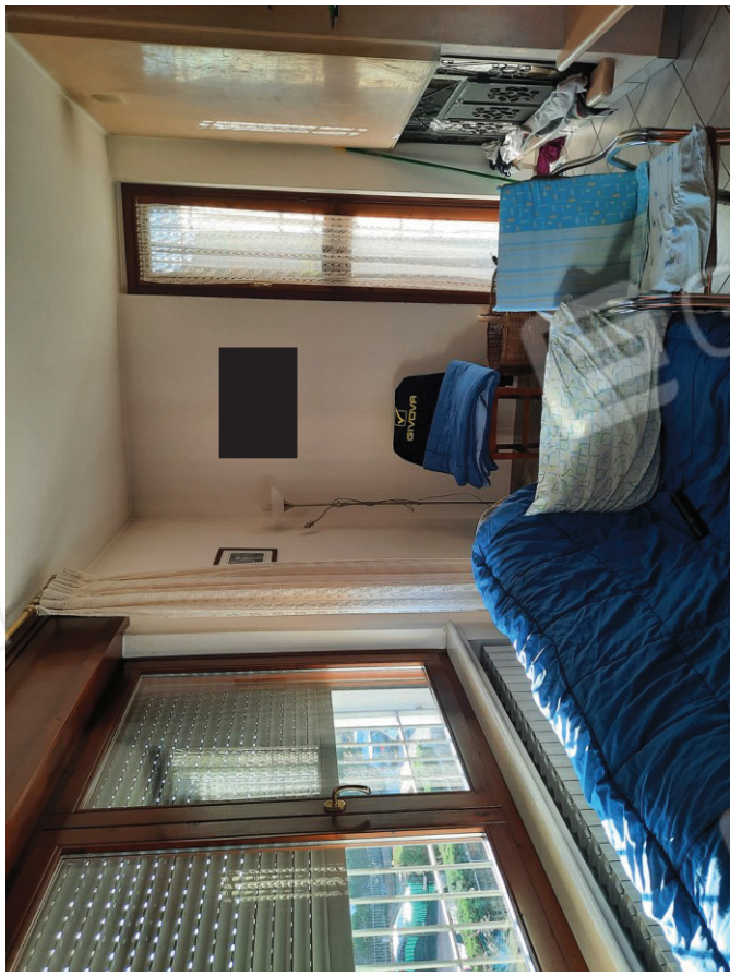
Soggiorno lato camino