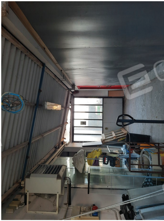
Ex tettoia da demolire