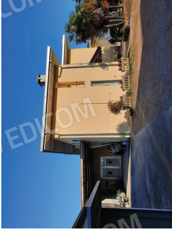
Vista dell'edificio dalla corte comune (sub.5)