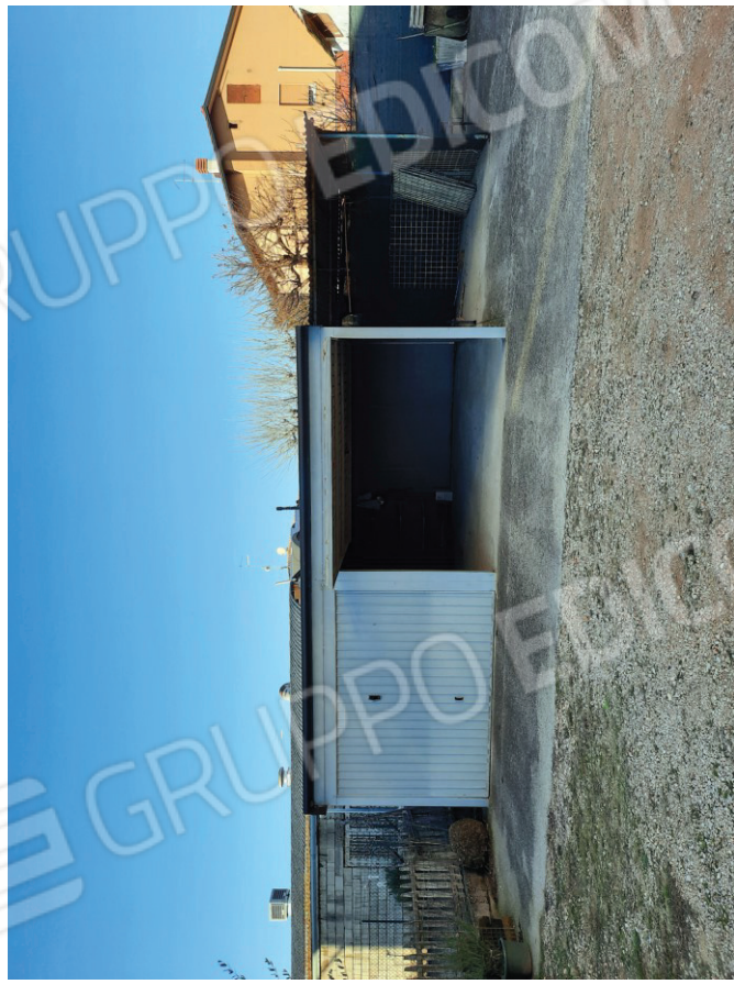
Garage (deposito attrezzi) con tettoia da demolire