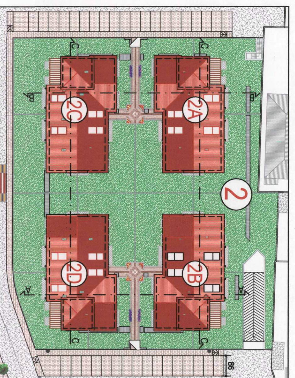
PLANIMETRIA DI PROGETTO fuori scala

(4714,00 mq - 1623,48 mq) : 2 = 1545,26 mq (3168,20 mq - 1623,84 mq) = 1544,36 mq < 1545,26 mq