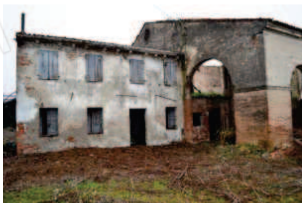
foto 8 - Scorcio del prospetto est col portico