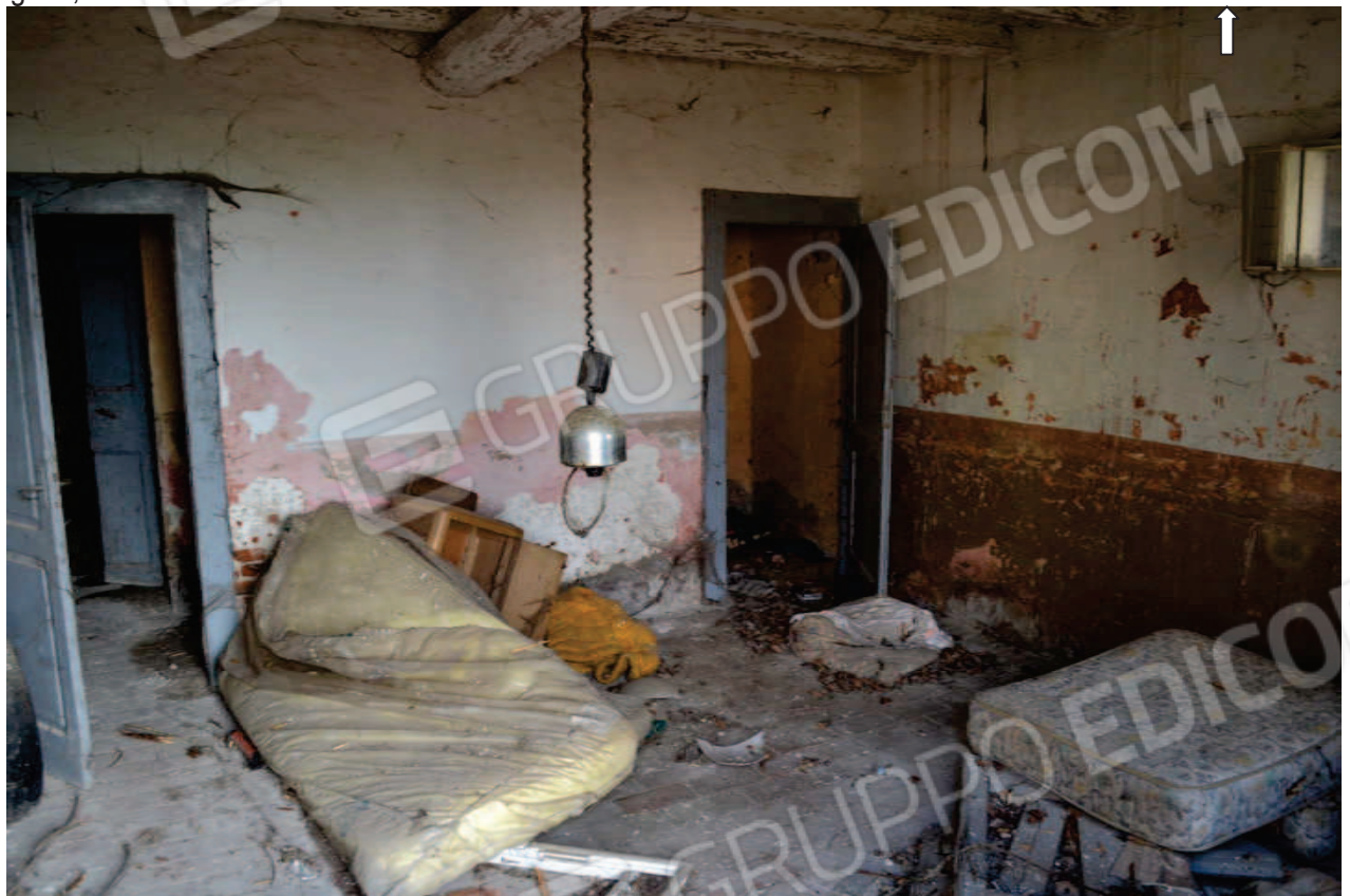
foto 21 – Abitazione civ. n. 134/B, piano terra – ingresso - vista dall'interno dell'ingresso, con pavimento in mattoncini di laterizio; a sinistra della foto s'intravede la porta verso il vano scala a rampa unica dell'abitazione e il disimpegno del w.c., a destra la porta del sottoscala. L'abitazione non è utilizzata e si presenta in pessimo stato di manutenzione generale.