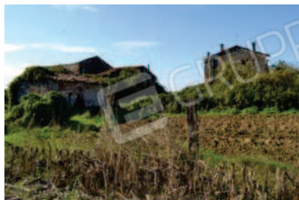
foto 6 – Scorcio del prospetto est con il m.n. 146 a sinistra e il m.n. 54 a destra