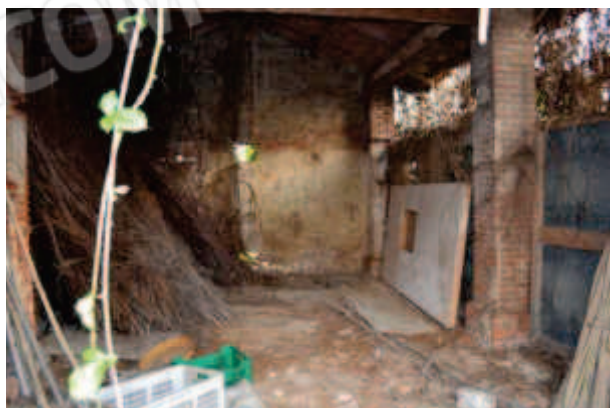
foto 27 - Scorcio del distinto rustico a est