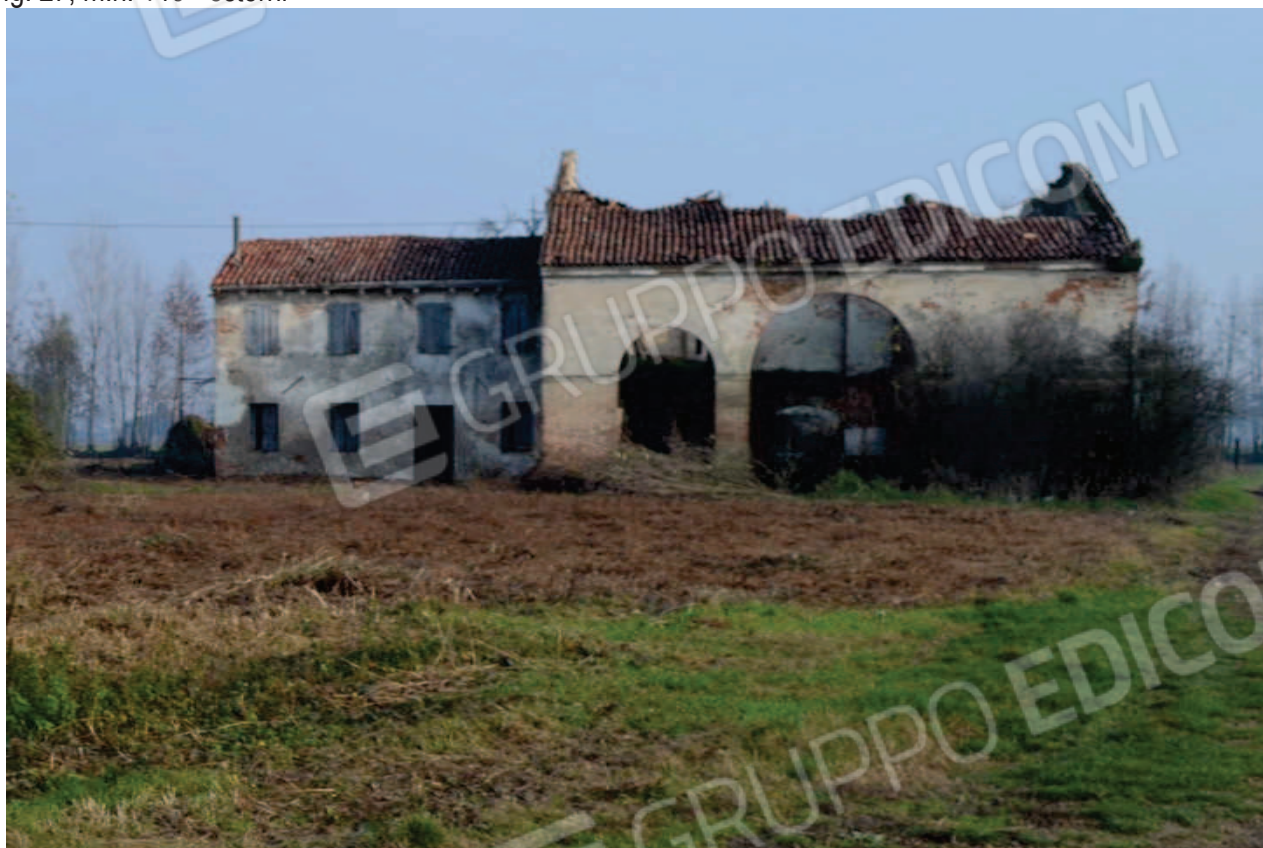
foto 7 – Edificio in via Carrare n. 134/B – prospetto ovest (visto da ovest) - sul prospetto est (a fianco dello stradello d'accesso) si vedono a piano terra da sinistra nella foto, le 2 finestre della cucina, la porta e la finestra dell'ingresso e l'arco piccolo del portico col tetto collassato (il resto dell'edificio a sud - destra nella foto) è il m.n. 136 di terzi) e a piano 1° le 2 finestre della stanza 1 e le 2 finestre del disimpegno.