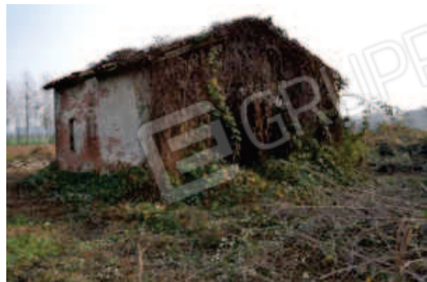
foto 11 – I prospetti nord e ovest (ingresso) del distinto rustico m.n. 146 sub 3