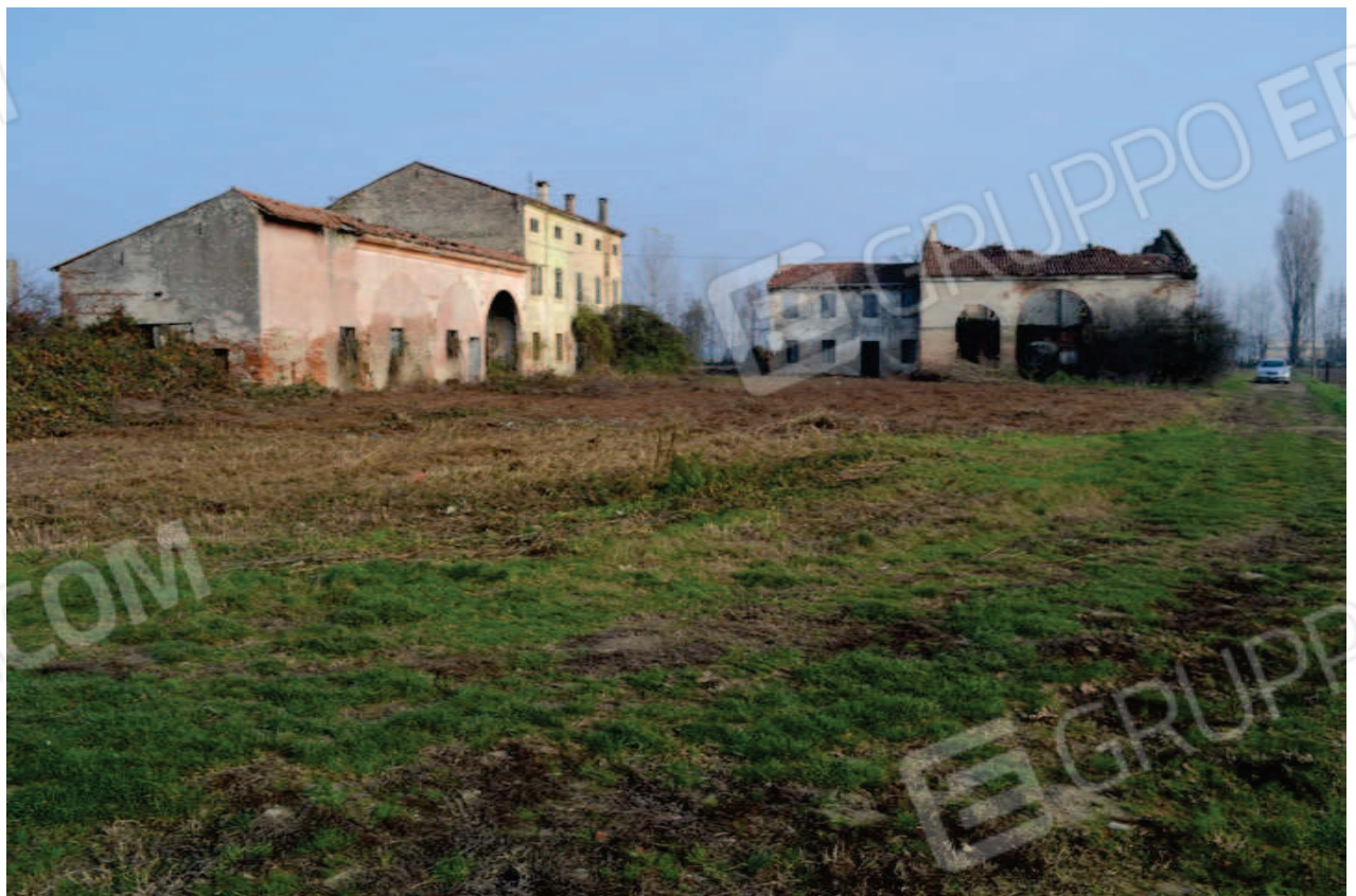
foto 1 – Edifici in via Carrare a Roncolelà – vista da sud ovest – Gli edifici comprendenti le due abitazioni con annessi rustici oggetto di stima sono situati a nord del prolungamento sterrato di via Carrare (a destra nella foto) e sono suddivisi in varie unità: nella foto si vede in sequenza da sinistra il m.n. 54 sub 2 (rustico rosa a 1 piano f.t.), il m.n. 54 sub 1 (prime 2 finestre dell'abitazione a 3 piani f.t. seguita dal m.n. 135 di terzi), il m.n. 146 sub 1 (abitazione a 2 piani f.t.) e il m.n. 146 sub 2 (rustico seguito dal m.n. 136 di terzi).