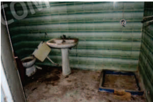
foto 23 - Scorcio del w.c. rivestito in ceramica