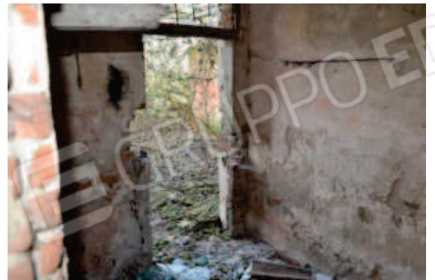
foto 14 – Scorcio del ripostiglio con la porta sul prospetto nord dell'edificio