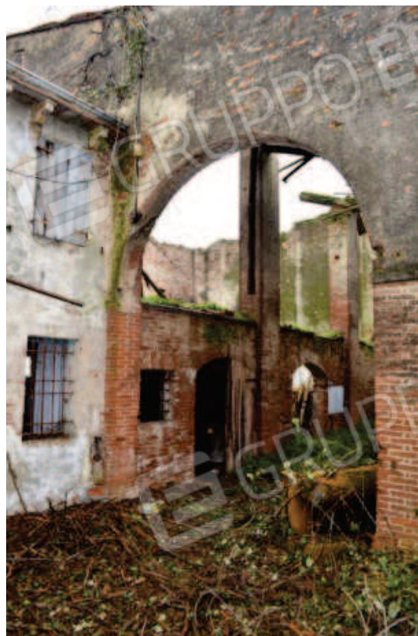
foto 28 - Vista del portico con l'ingresso del magazzino con copertura collassata