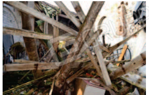
foto 16 – Scorcio dell'interno dell'ex stalla col tetto collassato