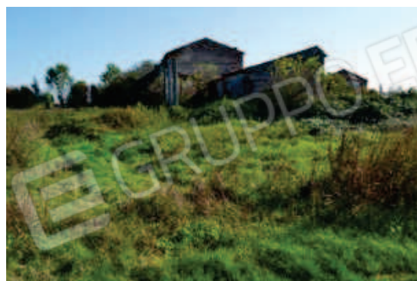
foto 4 – Vista da nord ovest della pertinenza e del prospetto ovest del m.n. 54