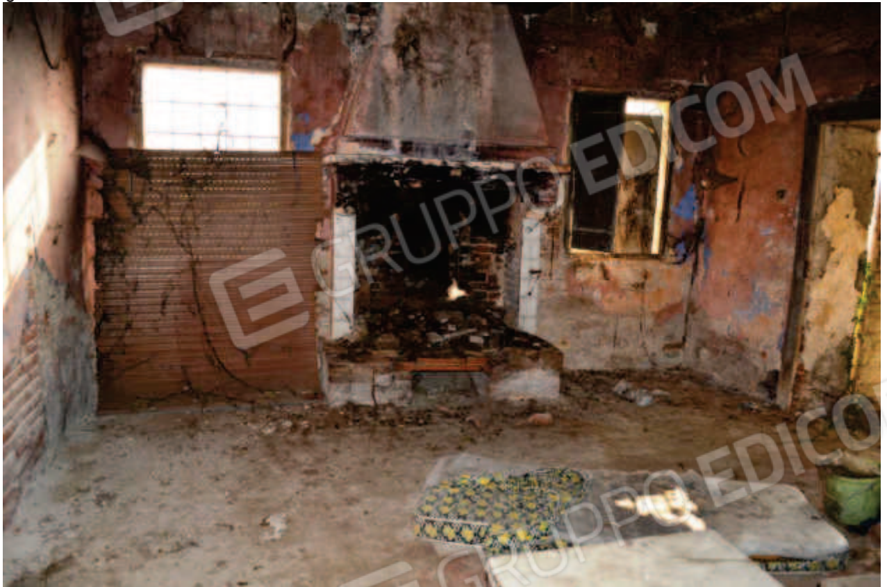
foto 12 – Abitazione civ. n. 30, piano terra – ingresso/cucina - vista dall'interno della cucina, con pavimento in mattoncini di laterizio, con caminetto e resti delle finestre in legno con vetro semplice con inferriate e scuri in legno prospettanti sulla pertinenza a sud dell'edificio, verso lo stradello sterrato d'ingresso. L'abitazione non è utilizzata e si presenta in pessimo stato di manutenzione generale.