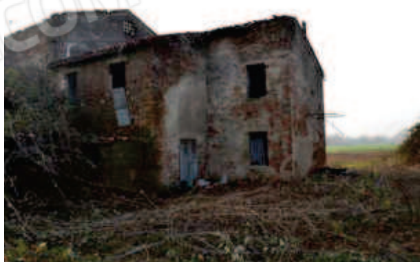
foto 10 - Scorcio del prospetto est dell'abitazione