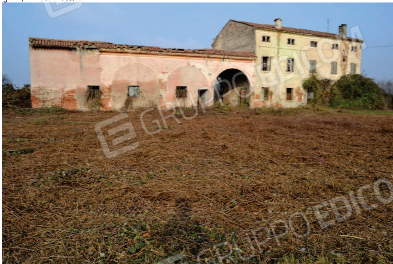
foto 2 – Edificio in via Carrare n. 30 – prospetto sud (visto da sud) - sul prospetto sud (di fronte allo stradello d'accesso) si vedono a piano terra da sinistra nella foto, le 3 luci e la porta dell'ex stalla col tetto crollato, il portico con l'ingresso dell'abitazione e le 2 finestre della cucina, a piano 1° le 2 finestre della stanza e a piano 2° le 2 finestre della soffitta. L'edificio a est (destra nella foto) è l'abitazione di terzi.