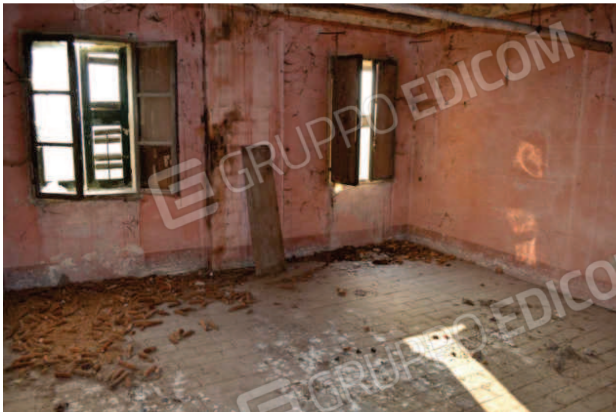
foto 17 – Abitazione civ. n. 30, piano 1° – letto - vista dall'ingresso sul disimpegno col vano scala della stanza 1, con resti di finestre prospettanti a sud verso la pertinenza e lo stradello d'ingresso, con pavimento in mattoncini di cotto e solaio in travi di legno senza controsoffitto.