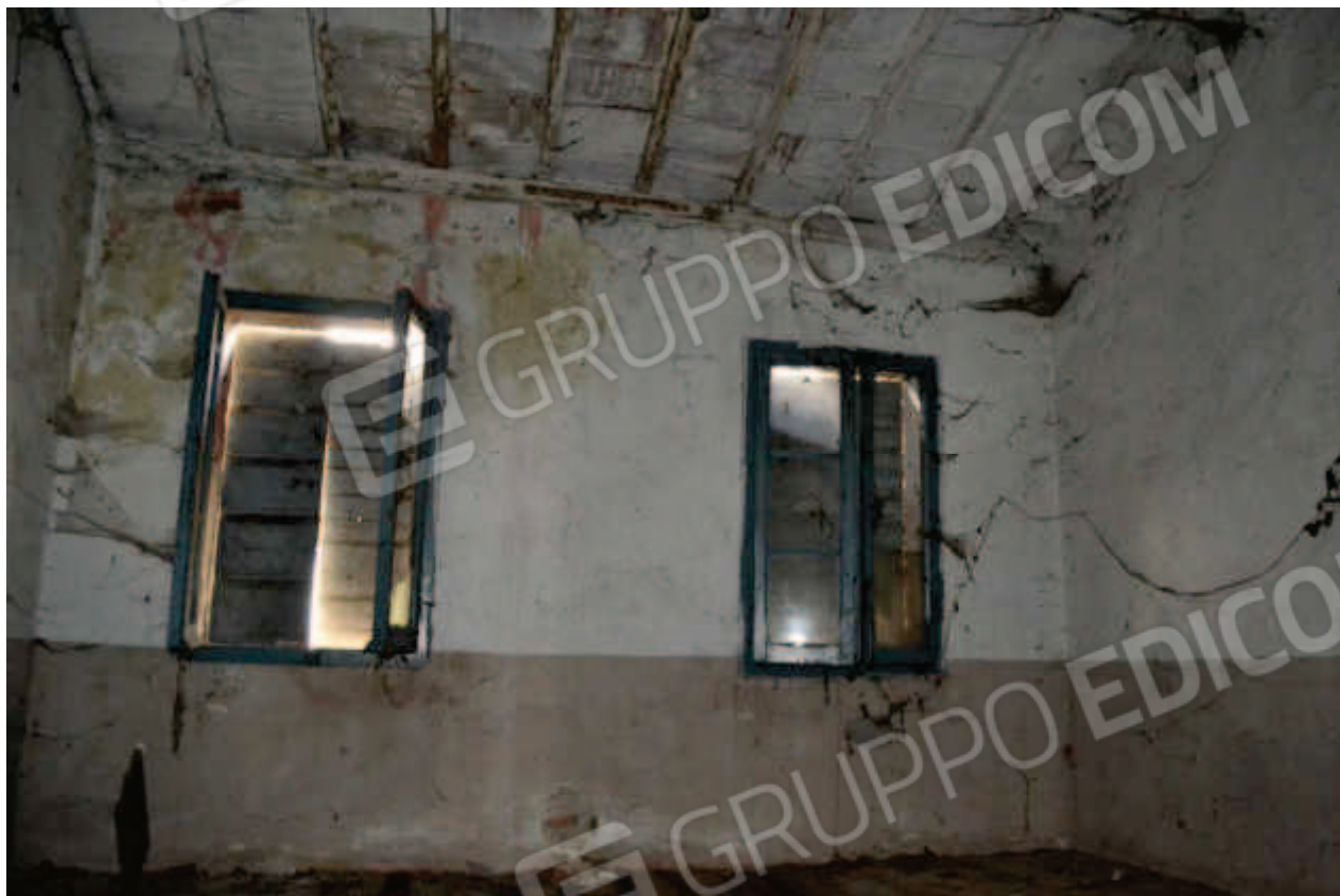
foto 25 – Abitazione civ. n. 134/B, piano 1° – letto - vista dall'ingresso sul disimpegno col vano scala della stanza 1, con le finestre prospettanti a ovest verso la pertinenza a fianco dello stradello d'ingresso, con pavimento in mattoncini di cotto e falda di copertura con conventini e tavolette in laterizio.