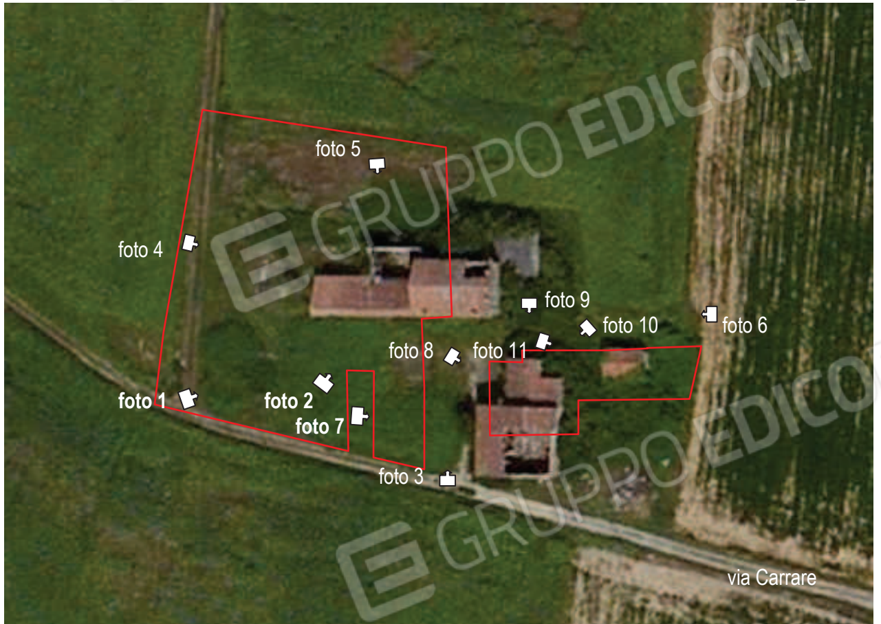
località Roncolelà, via Carrare