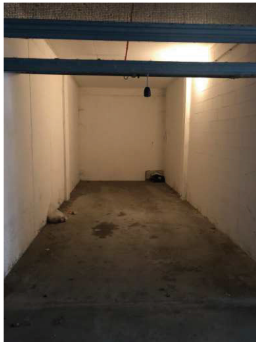
Foto 1 – Facciata esterna condominio Foto 2 – Autorimessa sub. 191