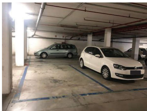
Foto 2 – Posti auto sub. 366-367-368-369