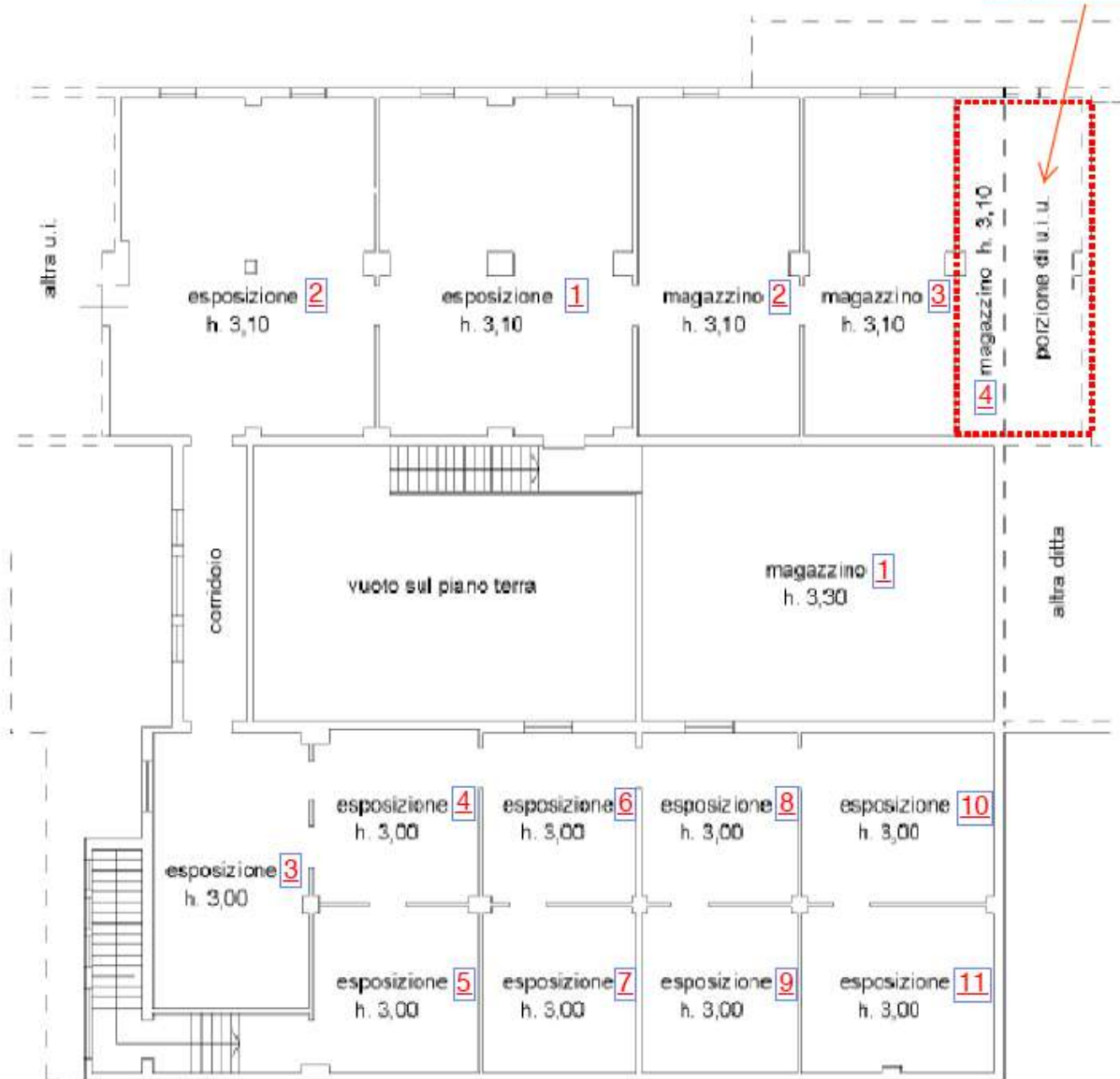
B. Schema planimetrico P. Primo