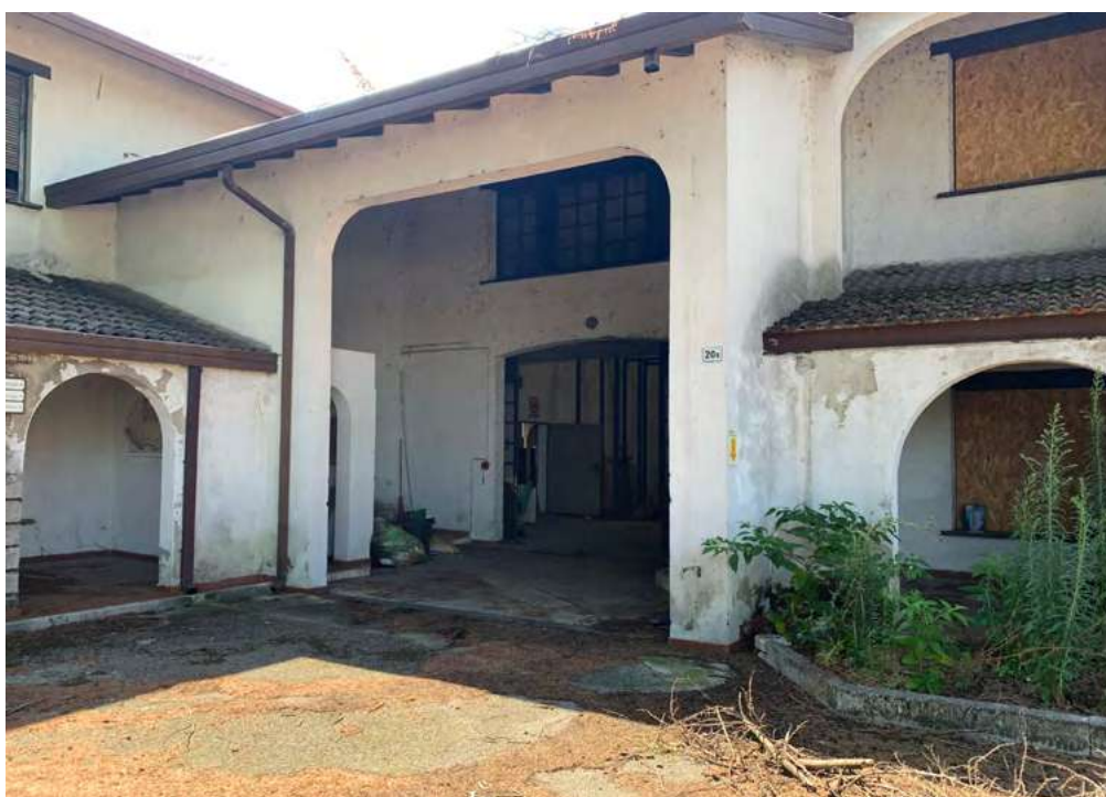
1 -Portico di accesso dall'area cortiva di pertinenza comune M. 103 sub 10 Via Calcara n. 22 - Cerea (Vr)