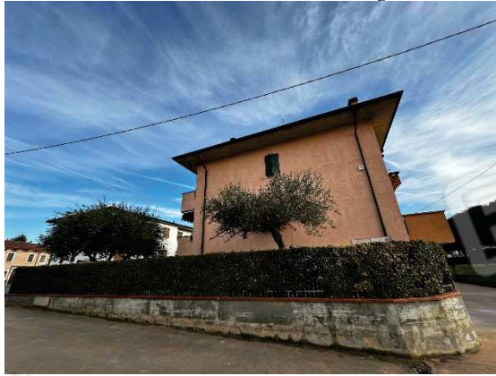
Vista lato ovest