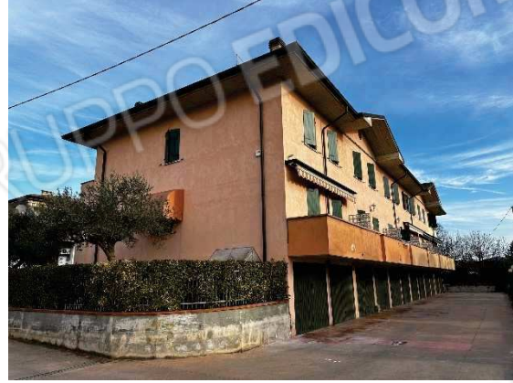
Vista lato sud ovest ingresso autorimesse