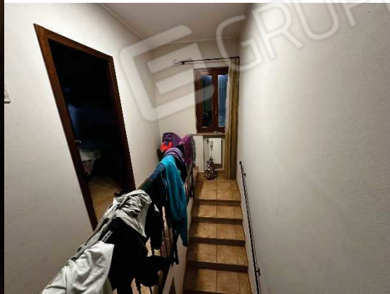
Scala ai piani