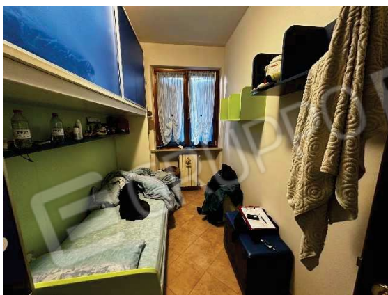
Ripostiglio usato come camera