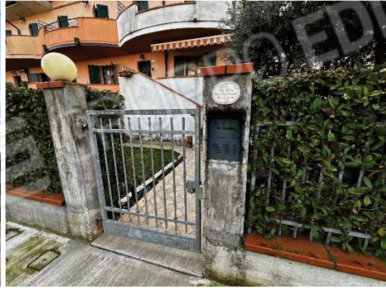
Vista lato nord ingresso pedonale