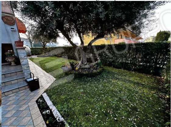
Viste esterne su corte esclusiva