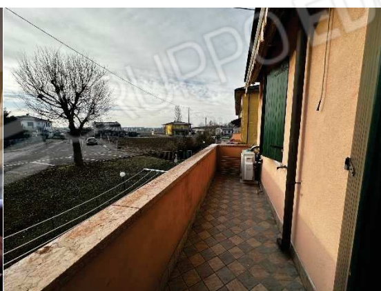
Balcone lato sud