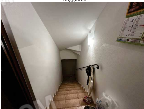
Rampa di accesso all'interrato