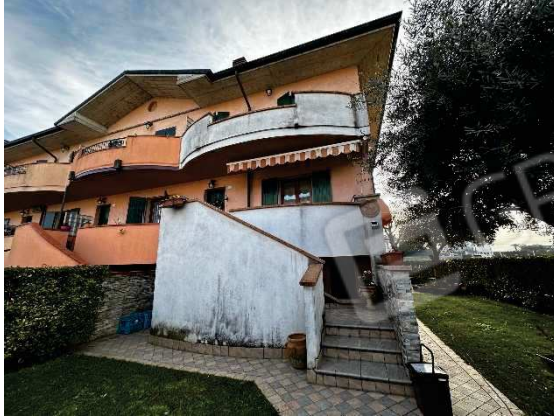
Vista lato nord su ingresso