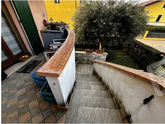
Rampa a corte lato nord