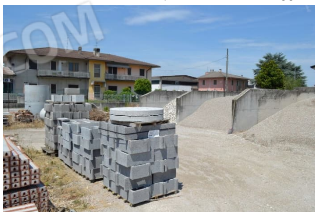
foto 12 - m.n. 428 (area urbana) - I muri di contenimento dell'inerte, ridossati sul confine nord, non sono indicati né al catasto né in Comune.