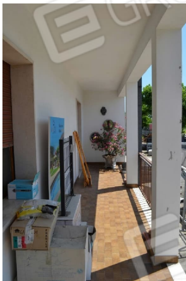
foto 5 - sub 1 (portico) - La balconata termina sull'ingresso degli uffici, coperto da un porticato.

foto 4 - sub 1 (terrazza) - L'unico accessorio a cielo aperto è un balcone fuori sedime.