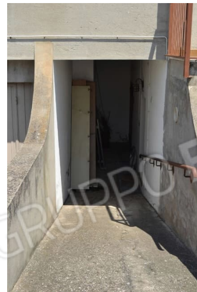
foto 6 - sub 4 (cavedio) - Percor- -sa una piccola discesa si raggiun- -gono la C.T. e la taverna.

foto 5 - sub 1 (portico) - La balconata termina sull'ingresso degli uffici, coperto da un porticato.