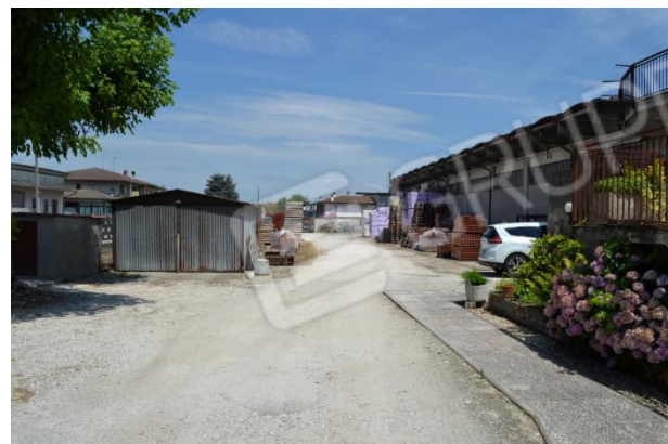
foto 8 – Dallo sterrato ovest si raggiunge la baracca bombole. Il compendio non è metanizzato.

foto 7 – La ragione sociale del magazzino edile, XXXXXXXXXX