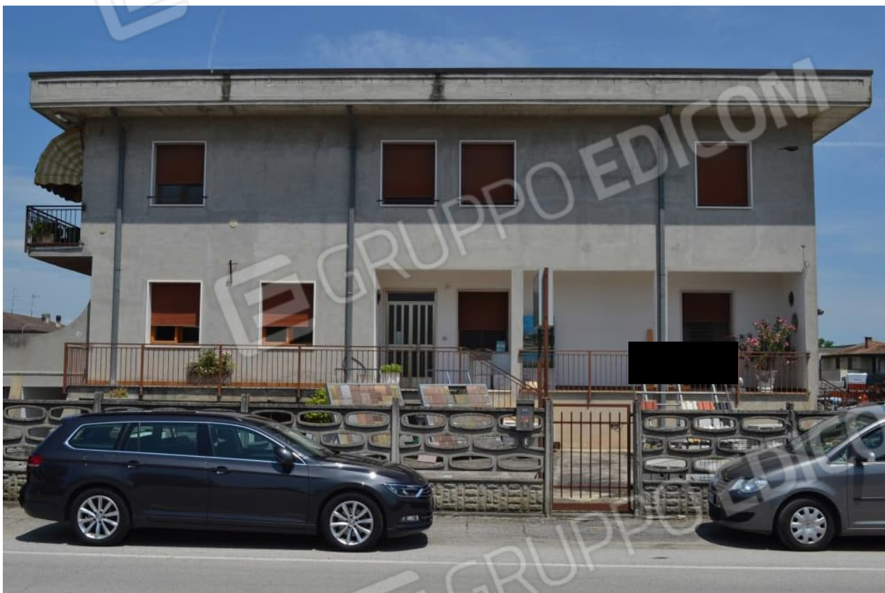
foto 1 – m.n. 93 (visto da sud dalla via Caduti sul Lavoro) – Il lotto unico consta di n. 3 unità, costituite dagli uffici di un esercizio commerciale, da una taverna e da un ente urbano non edificato, situate nell'ambito di un compendio multiproprietà sul lato nord di una strada interna in zona industriale. L'insediamento si compone di nove unità disposte su due piani e mezzo f.t., localizzate nella periferia meridionale del centro di Isola della Scala. I beni pignorati si trovano al rialzato (uffici), al seminterrato (taverna) e al piano terra.