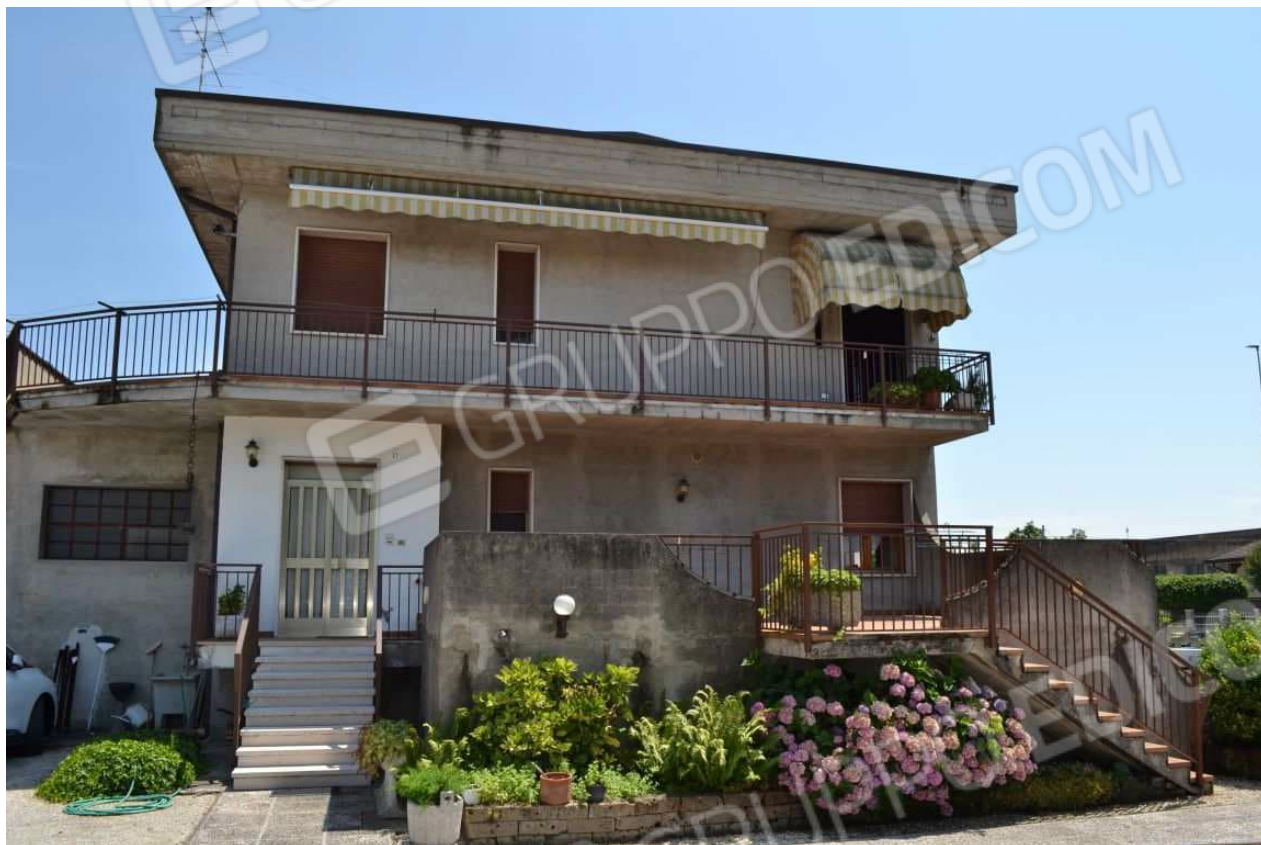
foto 9 – m.n. 93 (visto da ovest dalla corte interna sub 9) – L'unica parte visibilmente tinteggiata dell'involucro esterno è la porta d'ingresso del vano scala promiscuo, peraltro estraneo all'esecuzione. Anche la terrazza e le due gradinate scoperte visibili in foto non sono colpite da pignoramento. La finestra al centro è quella del bagno n. 2; quella a destra è dell'ufficio n. 1.