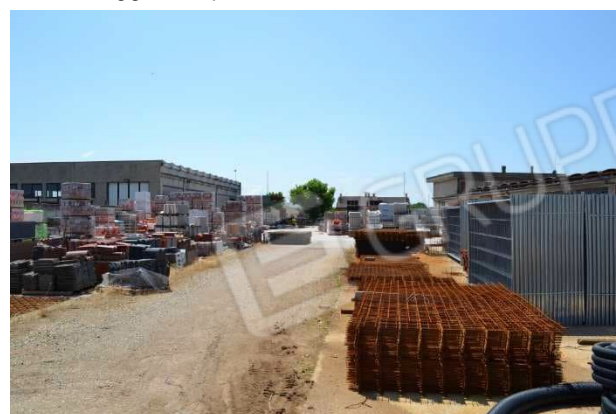
foto 13 - m.n. 428 (area urbana) - L'area scoperta pignorata è data in locazione a [redacted] stipulato il 22/01/2020 e registrato serie 3T, n.1137.