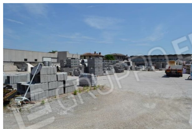
foto 11 – m.n. 428 (area urbana) - L'ente urbano pignorato, a nord del lotto, si presenta adoperato per lo stoccaggio di tipici materiali d'uso edili.