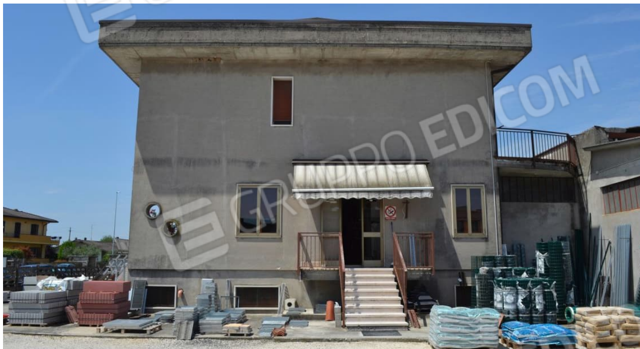
foto 3 – m.n. 93 (visto da est dalla corte interna sub 9) – Il fabbricato non è tinteggiato, se non in minima parte (vedi successiva foto n. 9). Agli uffici si accede da due ingressi diretti, uno rivolto verso la pubblica via e l'altro – praticamente al centro di questa foto – praticabile dalle pertinenze esterne. Alla taverna, oltre che dal vano scale interno, si accede da un cavedio in comune con la C.T. (vedi successiva foto n. 6).