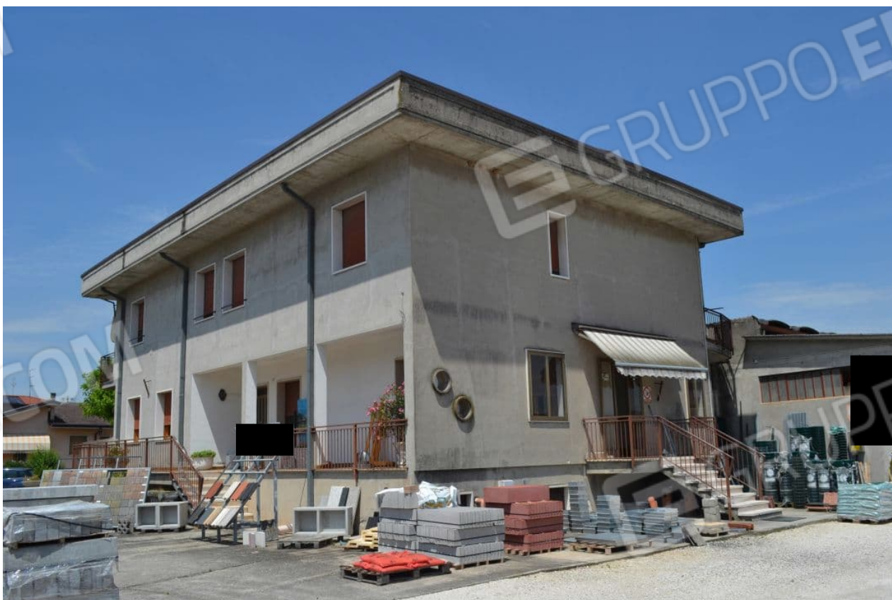
foto 2 – m.n. 93 (visto da sudest dalla via Caduti sul Lavoro) – L'immobile dove si trovano gli uffici e la taverna, licenziato dapprima nel Marzo 1974 e abitabile dal Dicembre 1978, dispone di n. 3 beni comuni non censibili, ossia il vano scale, il deposito bombole e la corte esterna. Le unità al primo piano, così come il capannone sul retro e il garage al seminterrato, sono estranee alla presente procedura esecutiva.