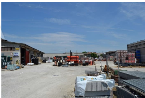
foto 10 - sub 9 (corte esterna) - Lo sterrato est, costantemente impegnato da traffico veicolare durante l'orario di lavoro, è la zona più libera da stoccaggi.