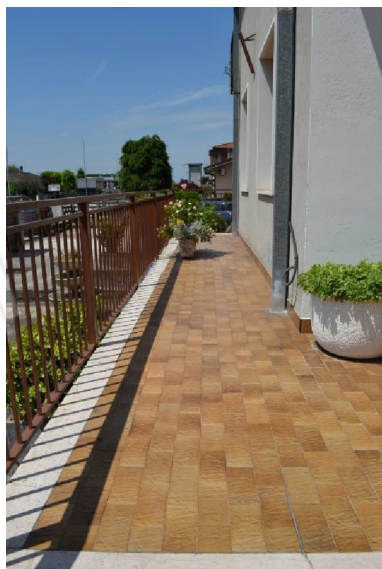
foto 4 - sub 1 (terrazza) - L'unico accessorio a cielo aperto è un balcone fuori sedime.

foto 3 – m.n. 93 (visto da est dalla corte interna sub 9) – Il fabbricato non è tinteggiato, se non in minima parte (vedi successiva foto n. 9). Agli uffici si accede da due ingressi diretti, uno rivolto verso la pubblica via e l'altro – praticamente al centro di questa foto – praticabile dalle pertinenze esterne. Alla taverna, oltre che dal vano scale interno, si accede da un cavedio in comune con la C.T. (vedi successiva foto n. 6).