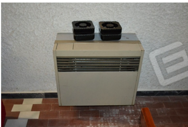
foto 22 - sub 4 (taverna) - A conferma del livello di finitura complessivo a servizio dei vani al seminterrato, si ha la climatizzazione invernale, garantita da vecchi ventilcoventori.