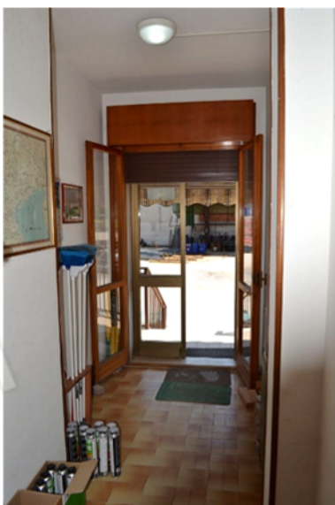
foto 12 - sub 1 (ingresso lato) - L'ingresso più frequentato dalla clientela è quello laterale.