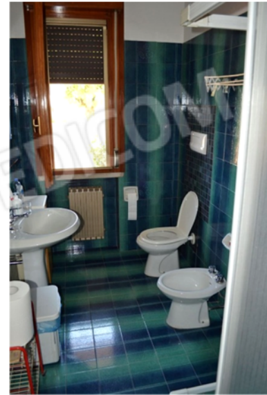
foto 5 - sub 1 (bagno) - Dotato di doccia, bidet, wc e lavandino.