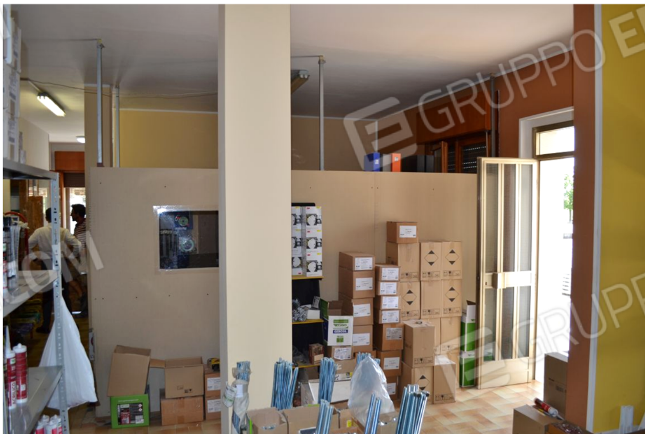
foto 2 – m.n. 93 sub 1 (negozio, ingresso-disbrigo) – La configurazione delle partizioni interne, nella parte di negozio compresa tra l'ingresso, la prima esposizione del negozio, l'ufficio n. 1 e il ripostiglio, si presenta difforme da quella deducibile in margine agli elaborati catastale e amministrativi, dove in luogo degli ultimi tre vani elencati si trova solo un unico ambiente denominato ufficio .