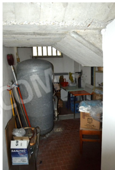
foto 24 - sub 4 (vano tecnico) - Ulteriore elemento di difformità rilevato è la presenza di un locale sottoscala, recante un accumulo idrosanitario.