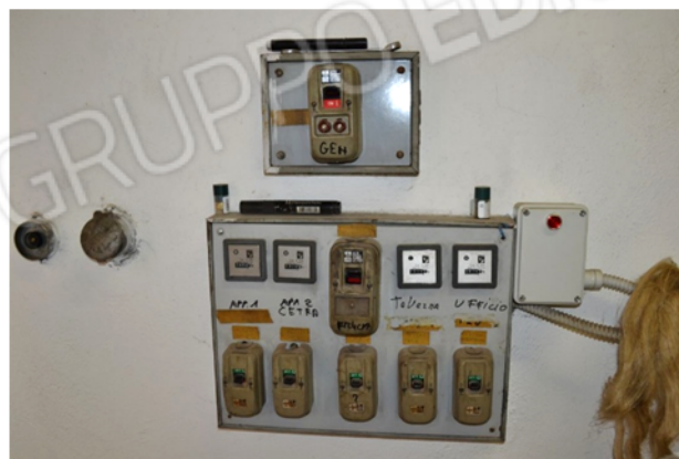
foto 23 - sub 4 (centrale termica) - Il quadro elettrico di centrale è dotato di interruttori obsoleti, di valore caratteristico i_{\Delta n} e/o curve d'intervento non meglio specificati.