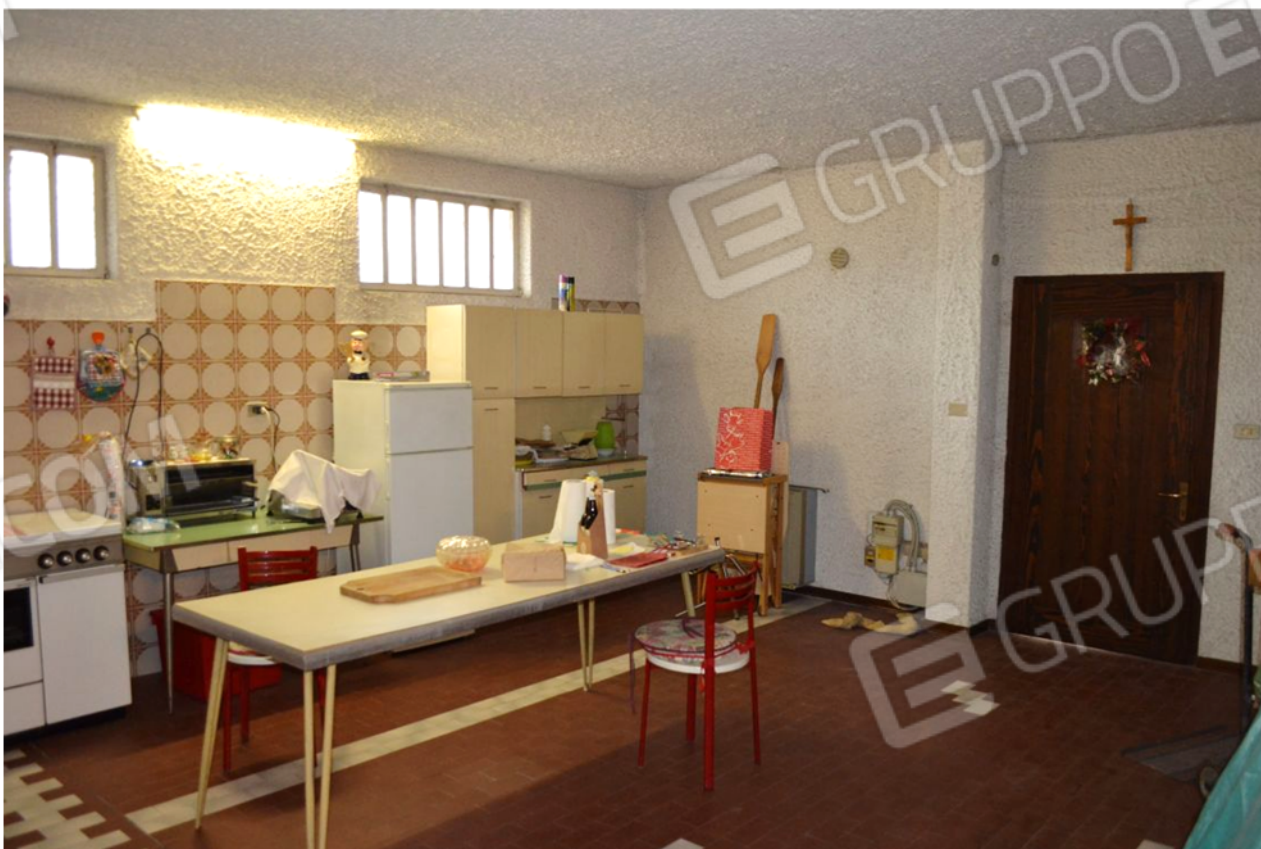
foto 19 – m.n. 93 sub 4 (taverna) – La superficie adiacente all'unica entrata diretta dall'esterno – ossia dal cavedio di cui alla foto esterna n. 6 – è attrezzata a cucina con forno e lavello. Il pilastro fuori spessore di muro, fianco porta, non risulta negli elaborati grafici agli atti.