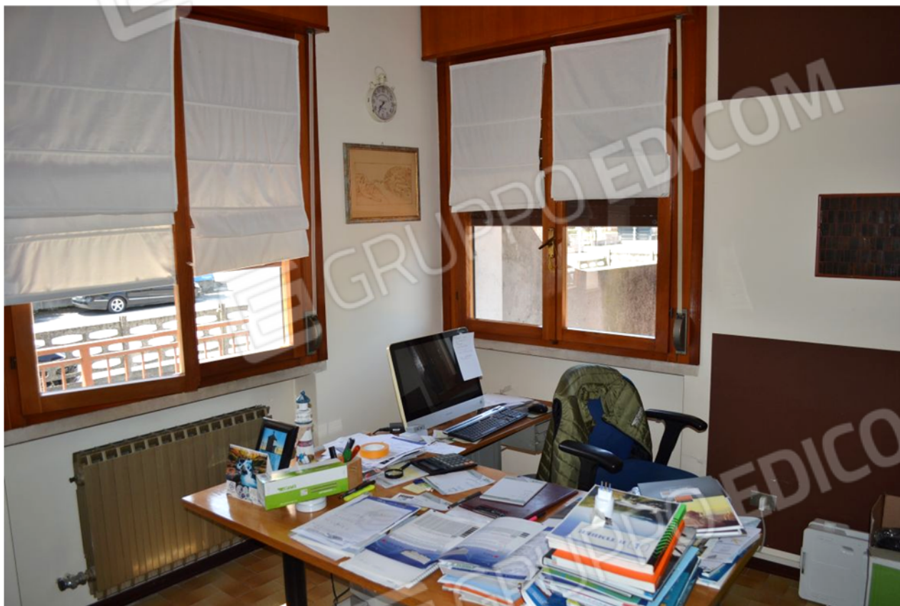
foto 1 – m.n. 93 sub 1 (ufficio 1) – L'unità attestata al piano rialzato dell'edificio fronte strada, accessibile dalla pubblica via durante i consueti orari di apertura di un esercizio aperto alla clientela, al primo e al secondo accesso risultava condotta dalla [REDACTED]. La stessa persona giuridica, dal Gennaio 2020, è locatrice dell'ente urbano m.n. 428. Il negozio costituisce la sede amministrativa dell'attività commerciale, che consiste in un magazzino edile con servizi di assistenza tecnica integrata.