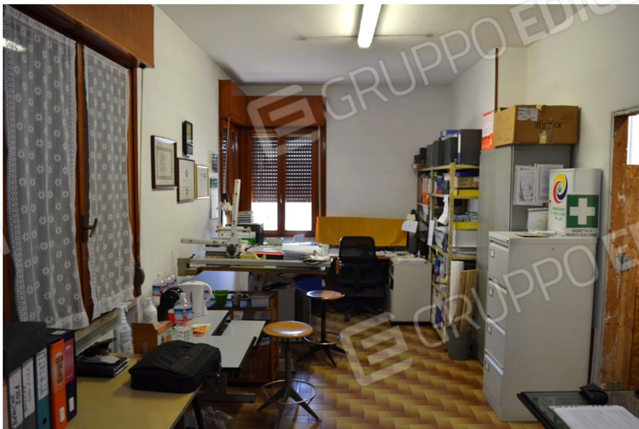
foto 6 - m.n. 93 sub 1 (ufficio 4) - Il più ampio dei vani a uso ufficio ha tre finestre e misura poco meno di ventisette metri quadri. A destra si vede il banco reception girevole di cui anche alla successiva foto n. 13.