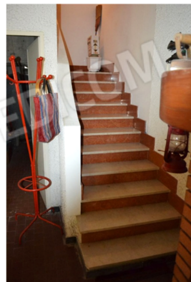
foto 11 - sub 4 (scala) - La gra-dinata sbarcante in taverna, inve-ce, fa parte del sub 4.