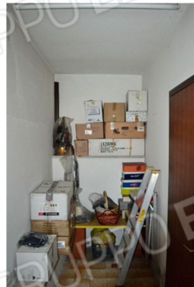
foto 14 - sub 4 (ripostiglio) - Gli accessori al seminterrato comincia-no con un ripostiglio fronte servizi.