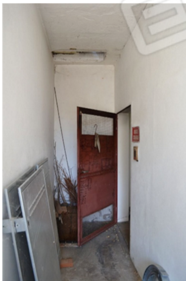
foto 25 - sub 4 (cavedio) - L'ingresso alla centrale termica è garantito da una porta in ferro cavo stampato, con prese d'aria superiore e inferiore.