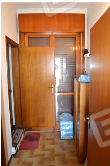
foto 9 - sub 7 (giro scala) - Disimpegno non pignorato; vi si im-bocca la scala verso la taverna.