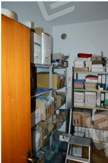
foto 3 - sub 1 (ripostiglio) - Questo è un locale assente in atti.