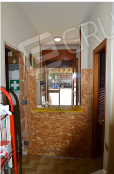
foto 13 - sub 1 (ingresso lato) - all'occorrenza la reception si può ribaltare con un banco girevole.