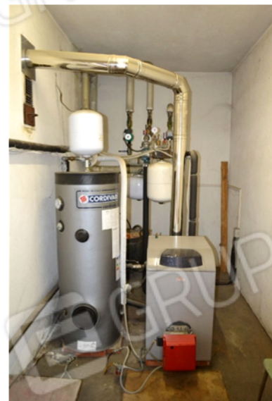
foto 26 - sub 4 (C.T.) - Il generatore di calore, centralizzato, è una caldaia a bruciatore Ferroli modello ATLAS D 50, con fuoco Riello mod. GULLIVER RG1NR.