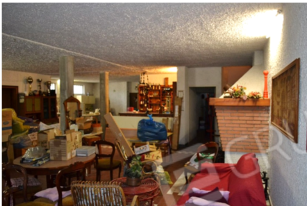
foto 20 - sub 4 (taverna) – Il seminterrato è in parte arredato a bar, con un bancone d'angolo in legno massiccio e piano di lavoro su pedana rialzata.