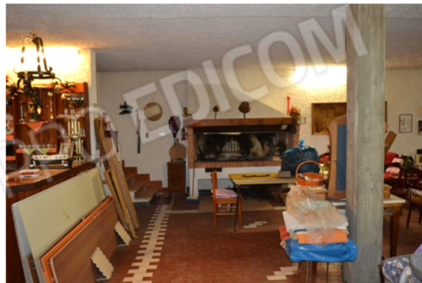
foto 21 - sub4 (taverna) - Un altro elemento architettonico assente dalle rappresentazioni grafiche è il caminetto a braci in muratura davanti alla scala.