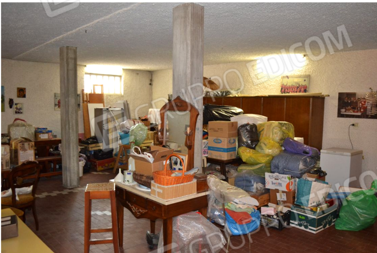
foto 18 – m.n. 93 sub 4 (taverna) – Il principale dei vani abitabili al seminterrato ha tre pilastri interni in cemento armato, pavimenti in cotto e pareti d'ambito con intonaco picchiettato tinte di bianco, oltre a finestre apribili a wasistas verso l'immediato piano di campagna esterno. Benché catastalmente allibrato come cantina , l'ampio locale (quasi 118 m 2 contando anche la cucina di cui alla foto successiva), per livello di finiture e dotazioni, ha rango di spazio abitabile e non accessorio, se non in ridotta parte (i servizi).