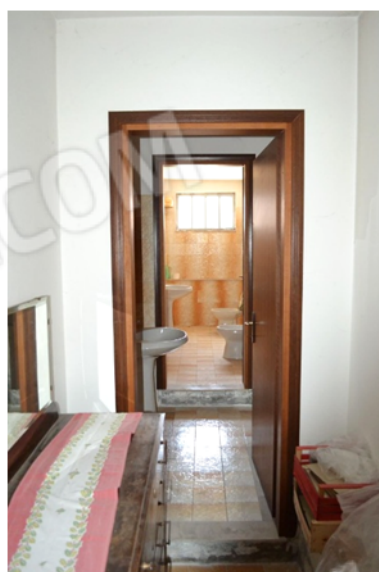
foto 15 - sub 4 (rip.) - I servizi si attestano su tre altezze utili.