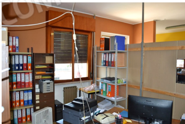
foto 7 - sub 1 (ufficio 2) - I divisori sono dei pannelli leggeri, elevati fino a poco più di metà delle finestre.