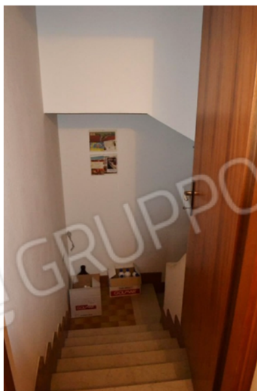
foto 10 - sub 7 (scala) - Solo la prima rampa di scale verso la ta-verna è attribuita al sub 7.