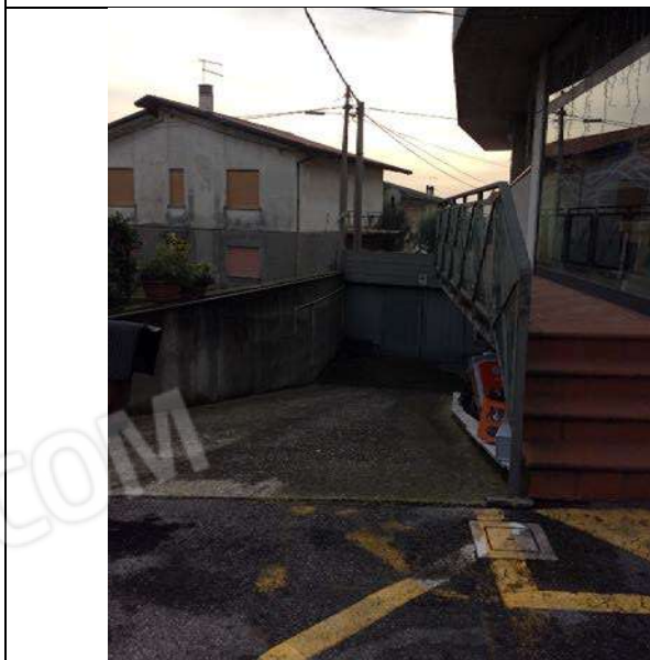
Foto 33: Vista della rampa di accesso (corte sub 15) all'autorimessa sub 10