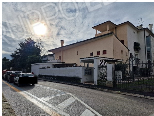
INGRESSO CONDOMINIO E FACCIATA