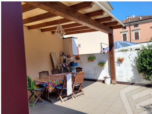
AREA ESCLUSIVA NORD-EST