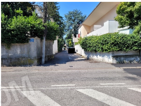
ACCESSO ALLE AUTORIMESSE PART. 1421 (NON PIGNORATO)