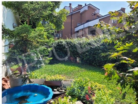
AREA ESCLUSIVA SUD-EST