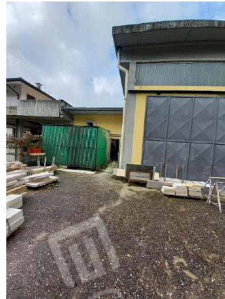
VISTA OVEST BARACCA ABUSIVA