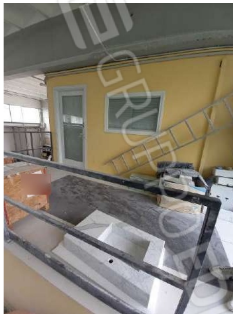
VISTA SMONTO P.1°