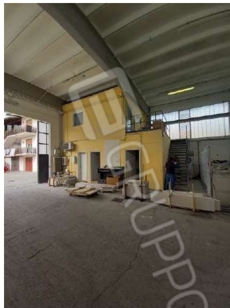
VISTA GRUPPO SERVIZI