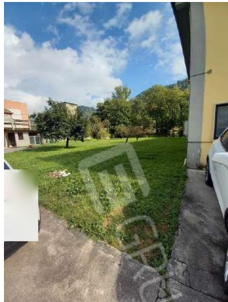
VISTA TERRENO ESCLUSIVO