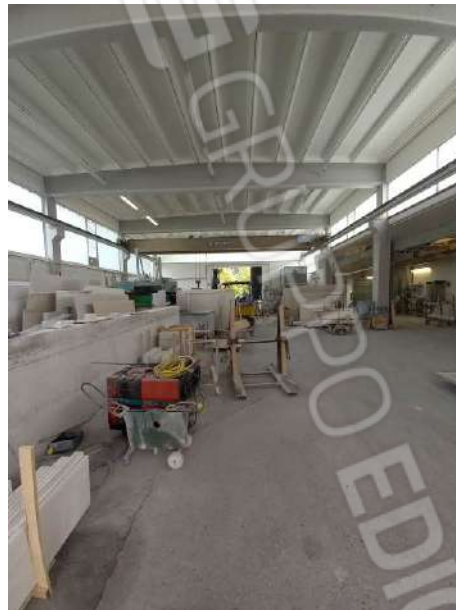
VISTA PORZIONE H.6.40