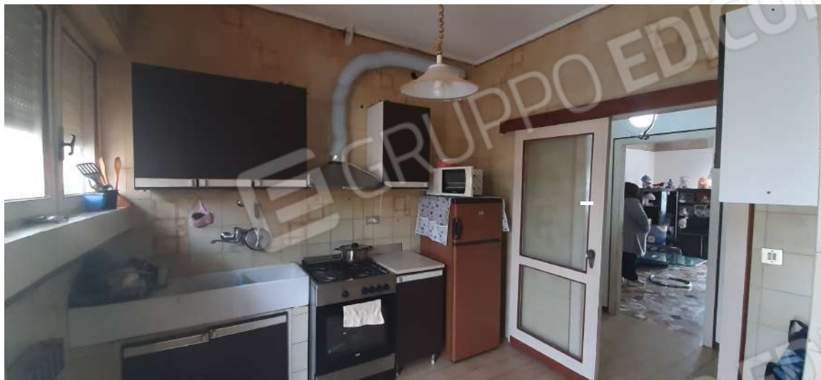
Figura 7 - locale cucina