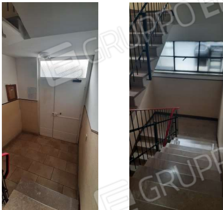
Figura 5 – ingresso al civico 22 e vano scala condominiale