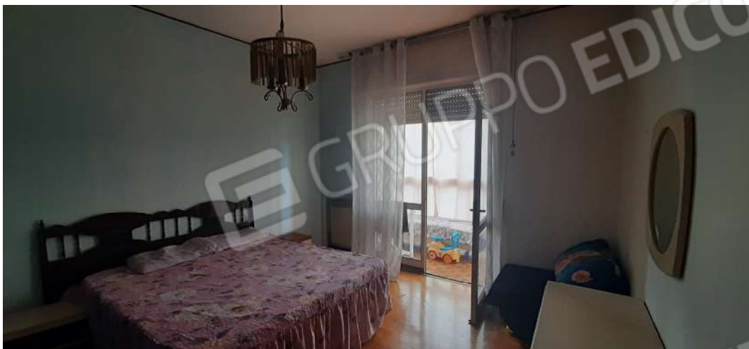
Figura 11 - locale camera SUD-EST