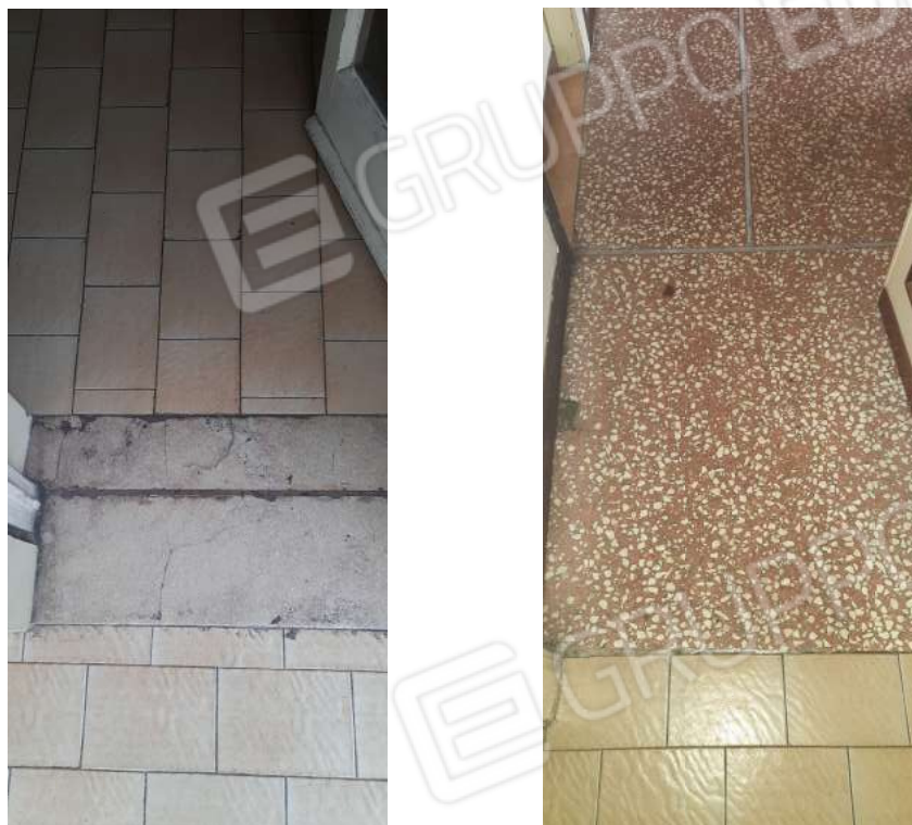
Figura 16 - dettagli pavimenti