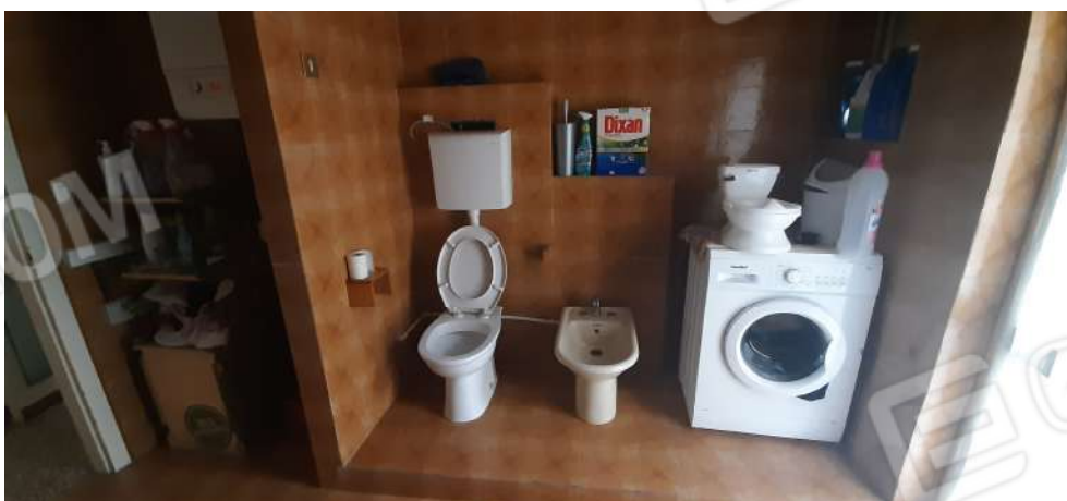
Figura 10 locale bagno