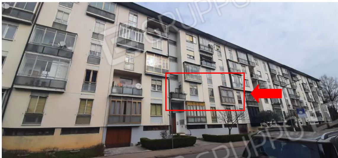
Figura 3 - prospetto SUD appartamento P.LLA 450 SUB. 34 al P1