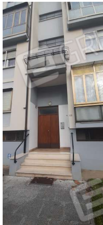
Figura 2 - accesso pedonale al civico n. 22