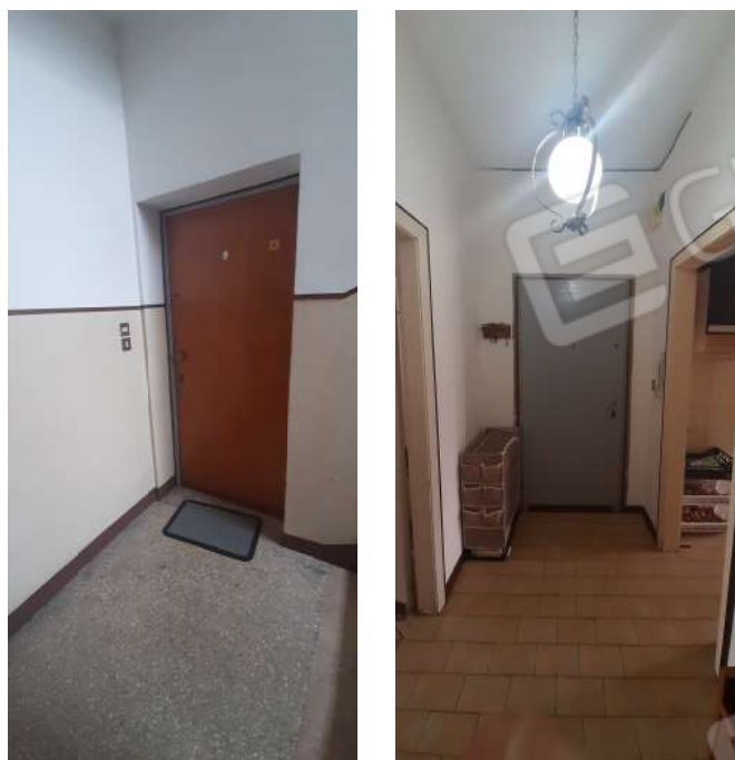
Figura 6 - pianerottolo d'ingresso all'interno 4 e locale corridoio