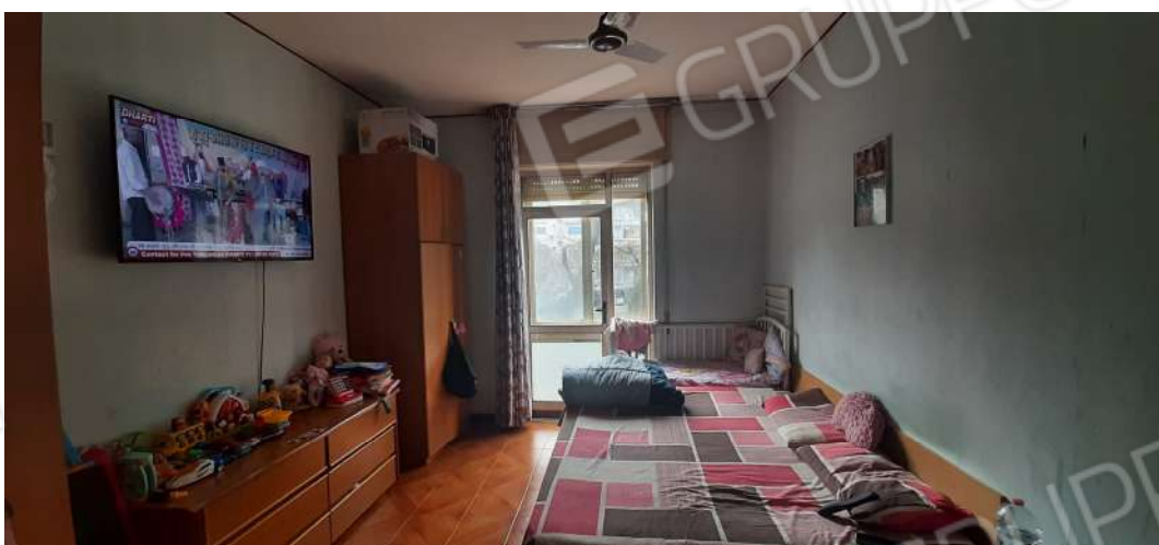
Figura 12 - locale camera SUD-OVEST