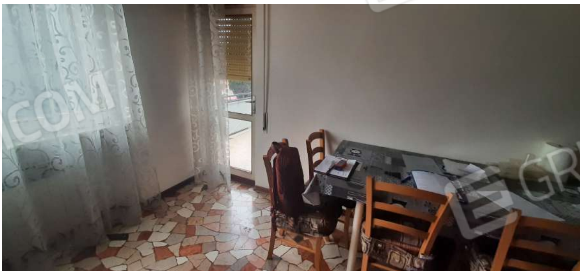
Figura 8 locale soggiorno