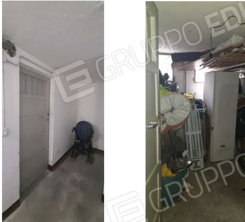
Figura 18 - locale cantina al PS1