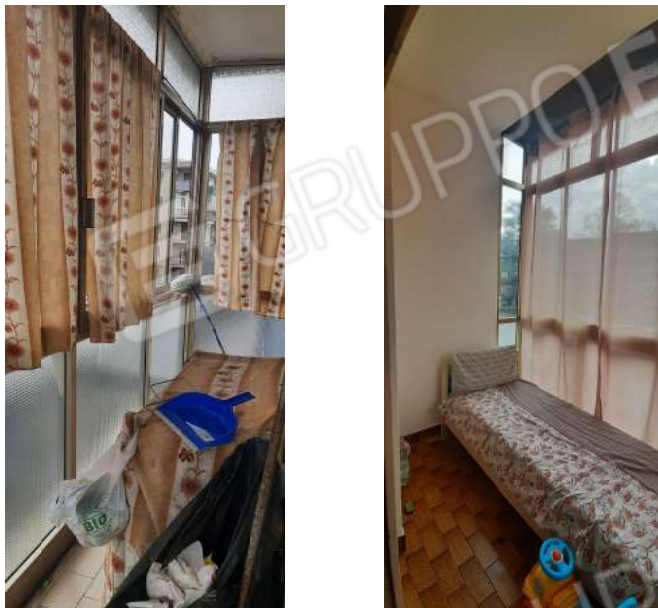
Figura 9 veranda NORD e veranda SUD