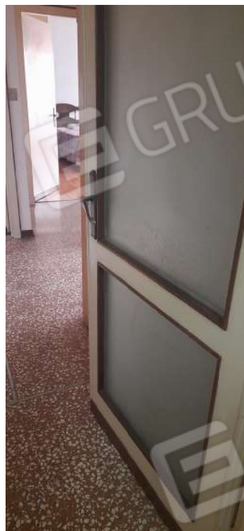
Figura 15 - dettagli serramenti