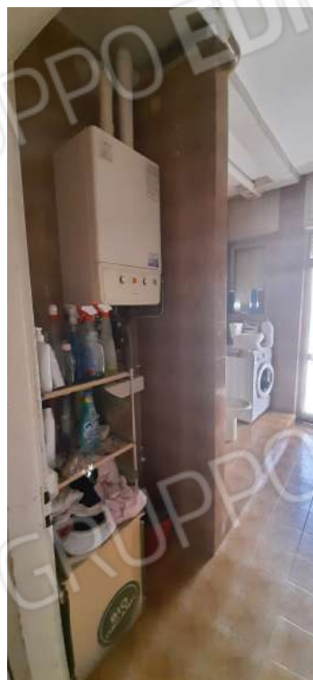
Figura 14 - termosifoni e caldaia installata nel locale bagno