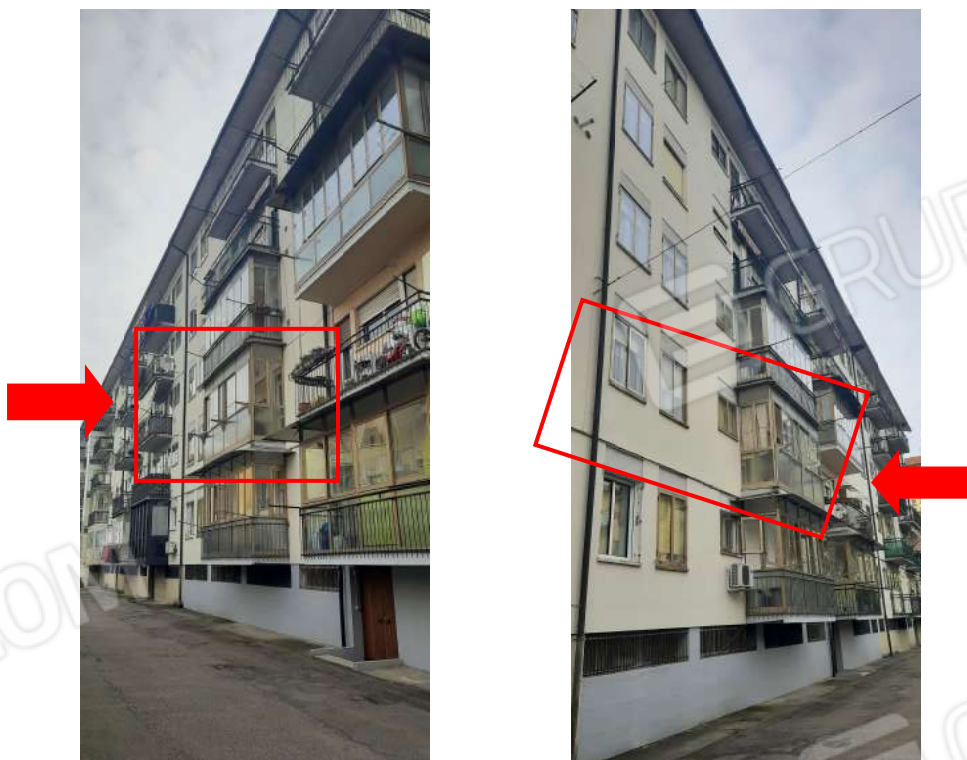
Figura 4 - prospetto NORD appartamento P.LLA 450 SUB. 34 al P1