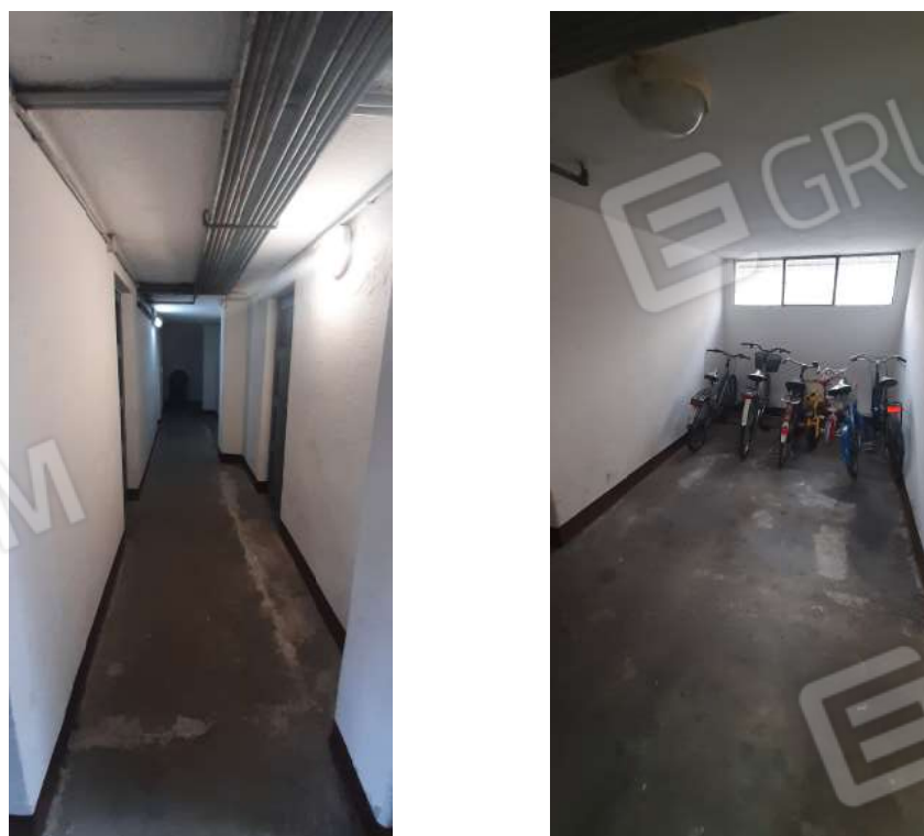
Figura 17 - corridoio condominiale e locale comune al PS1