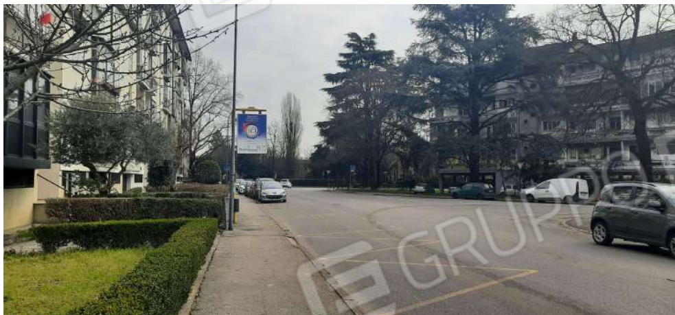
Figura 1 - accesso da via C. Colombo

COMUNE VICENZA – FG. 60 P.LLA 450 SUB. 34 APPARTAMENTO AL P1 CON CANTINA AL PS1