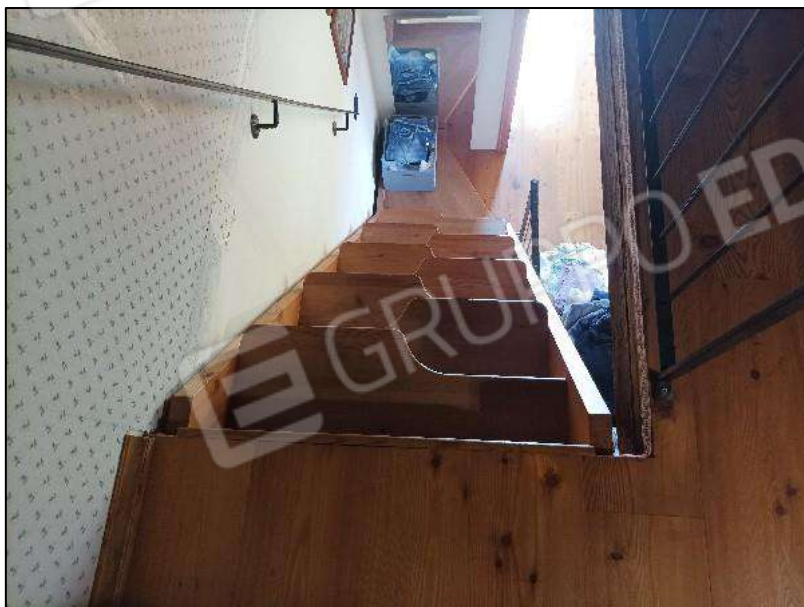
Scala P1 - P2