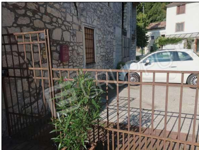
Recinzione lato ovest con cancello pedonale verso la corte comune