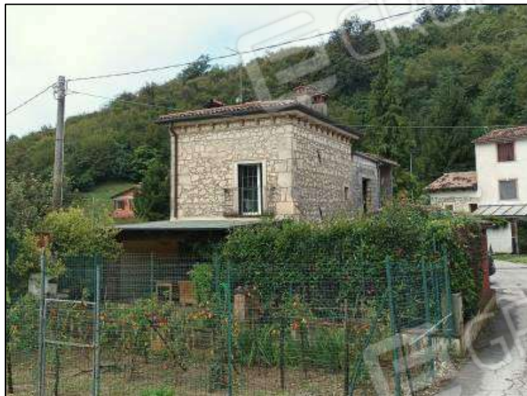
Abitazione con portico, autorimessa e area scoperta