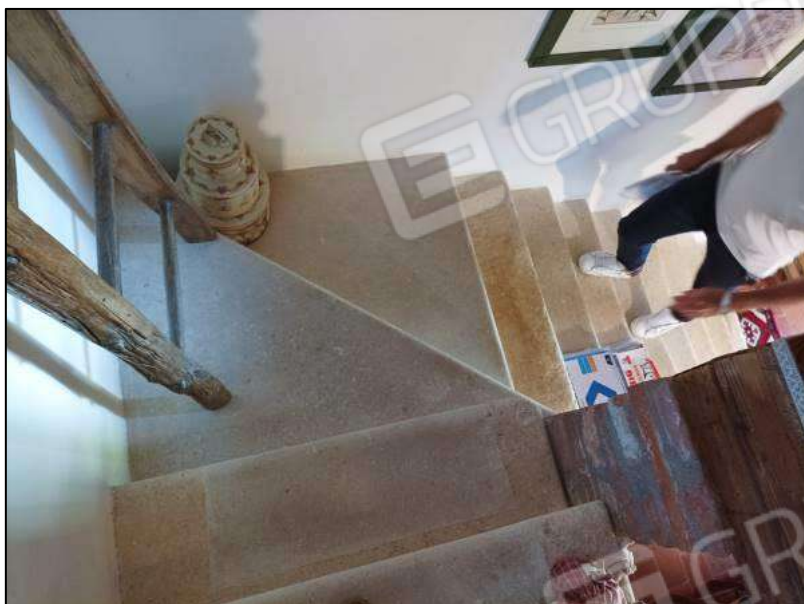
Scala PT - P1