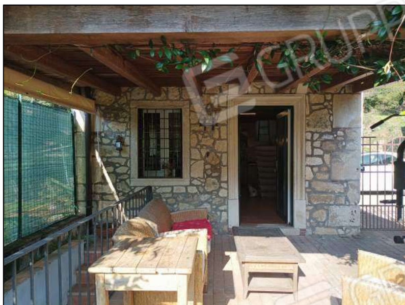
Abitazione facciata est con portico e ingresso