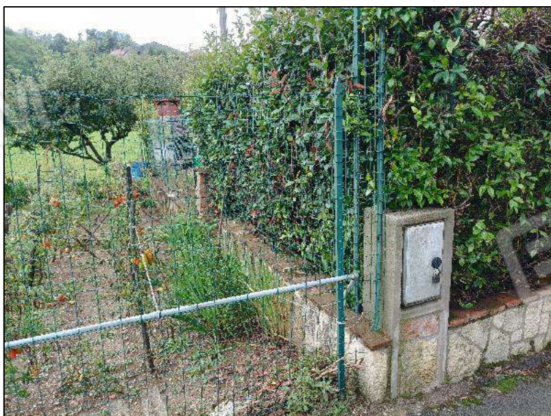
Recinzione angolo nord - est