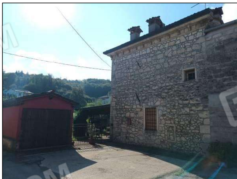
Abitazione facciata nord e autorimessa facciata ovest