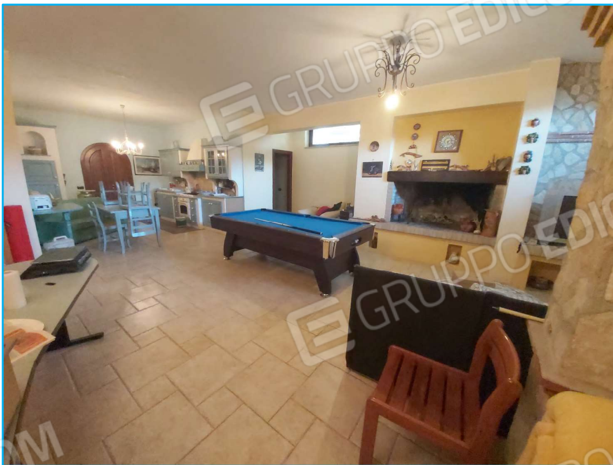
Tavernetta al piano interrato, da cui si perviene attraverso le scale interne.