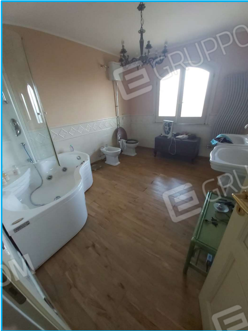
Un servizio igienico al piano primo – ZONA NOTTE