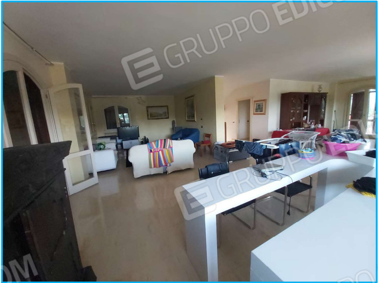
Vista interna, piano terra.