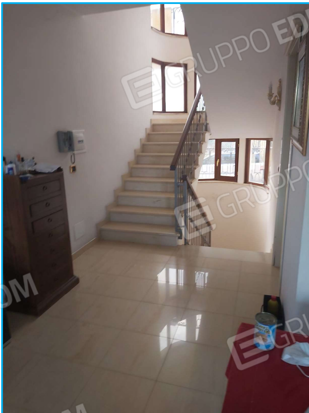
Piano terra – vista delle scale interne che collegano ogni piano