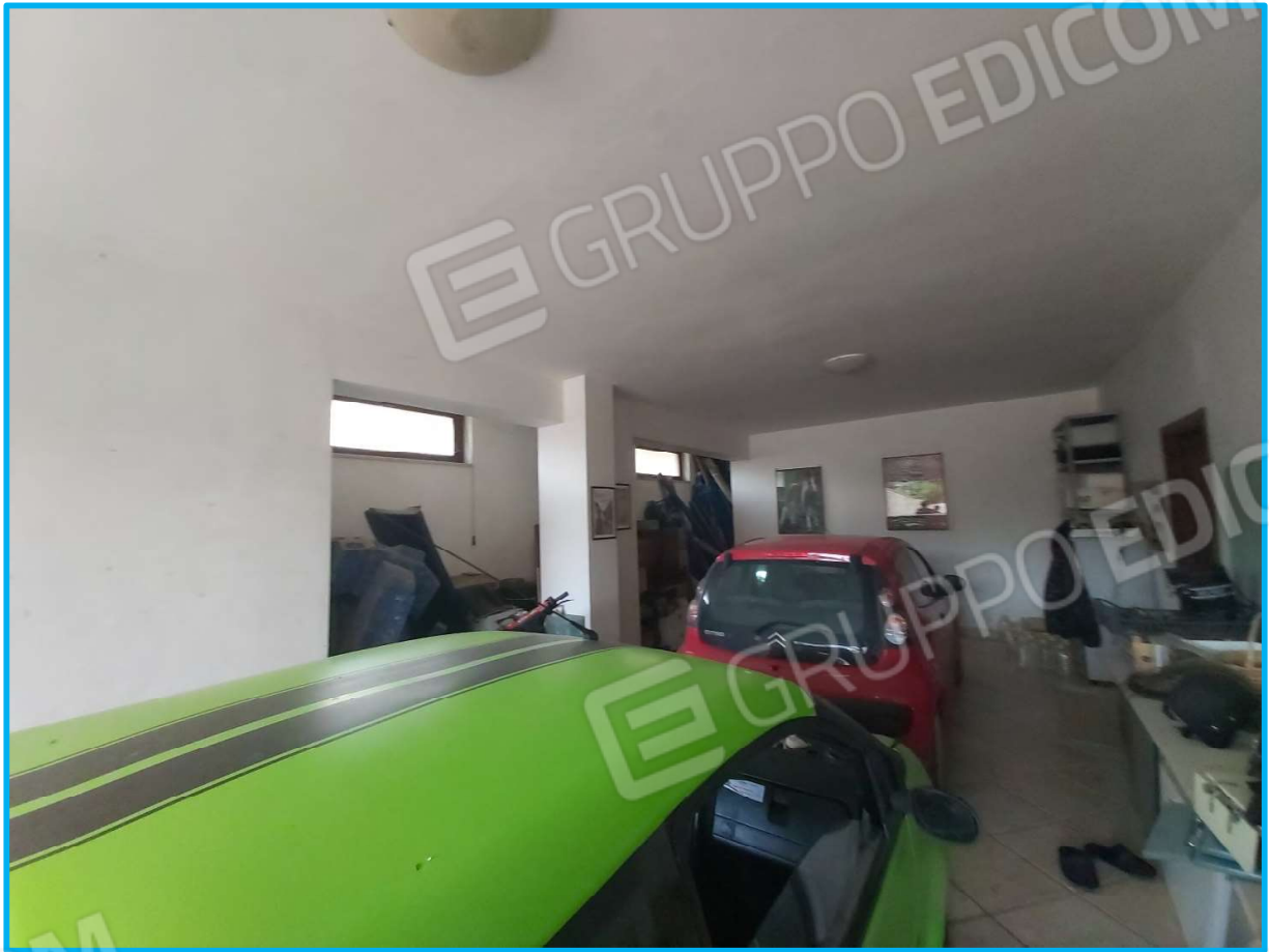
Autorimessa al piano interrato a cui si accede dall'esterno.