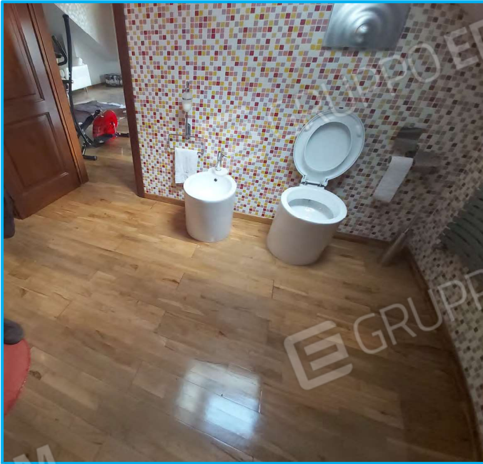
Servizio igienico in mansarda/sottotetto.