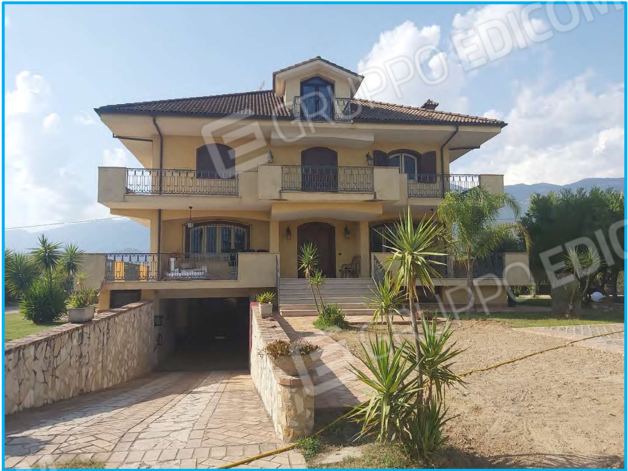
Vista dal confine sud, ingresso al piano terra e al piano interrato.