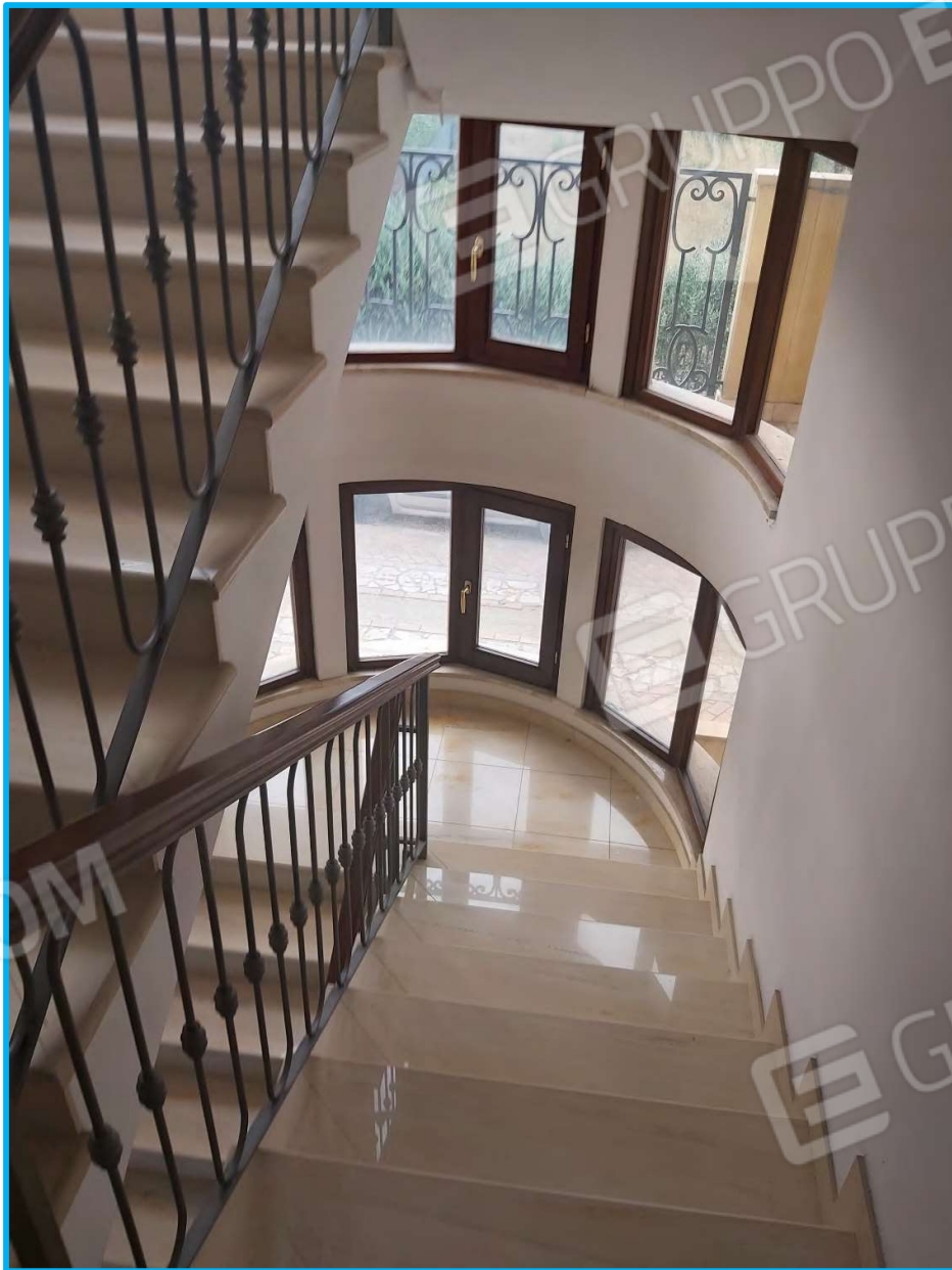
Corpo scale, vista dal piano primo.