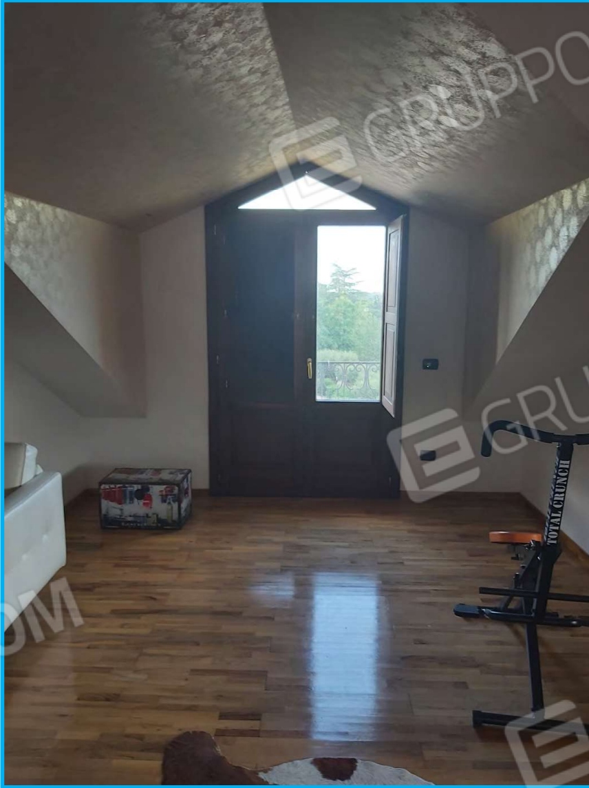
Piano secondo /sottotetto – vista interna, verso uno degli abbaini.