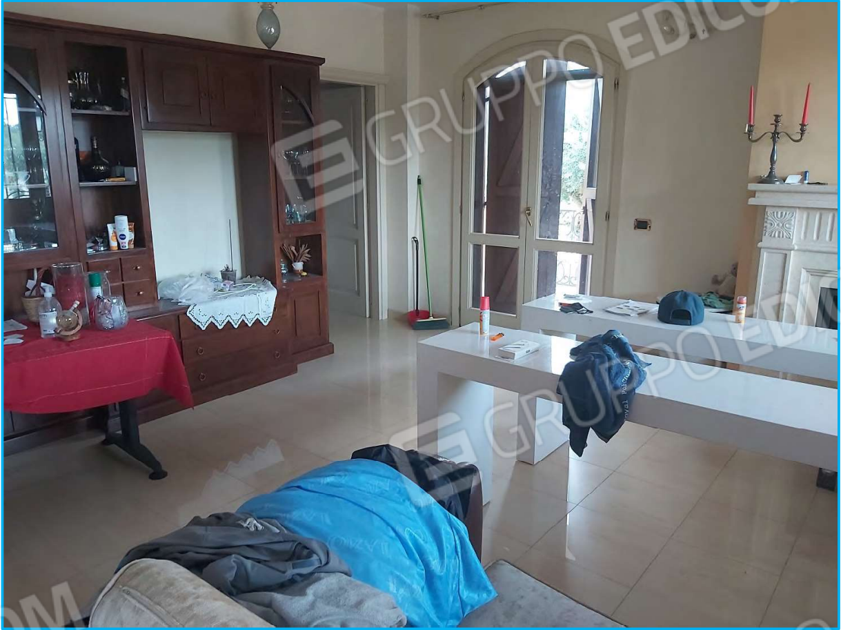
Piano terra – zona living