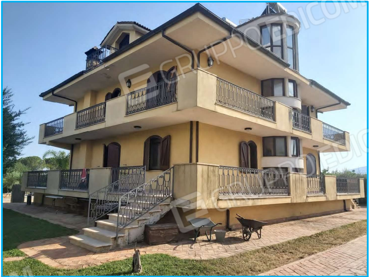
Vista della villa nel suo complesso, confini nord ed est