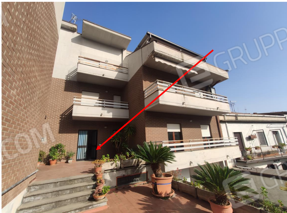
4. Veduta ingresso alla unità immobiliare pignorata, civile abitazione, Lotto n. 1