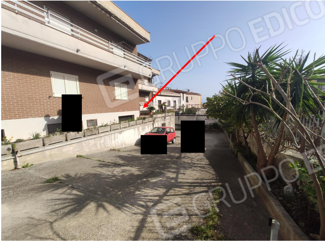
3. Corte interna del fabbricato, veduta verso l'ingresso alla unità immobiliare