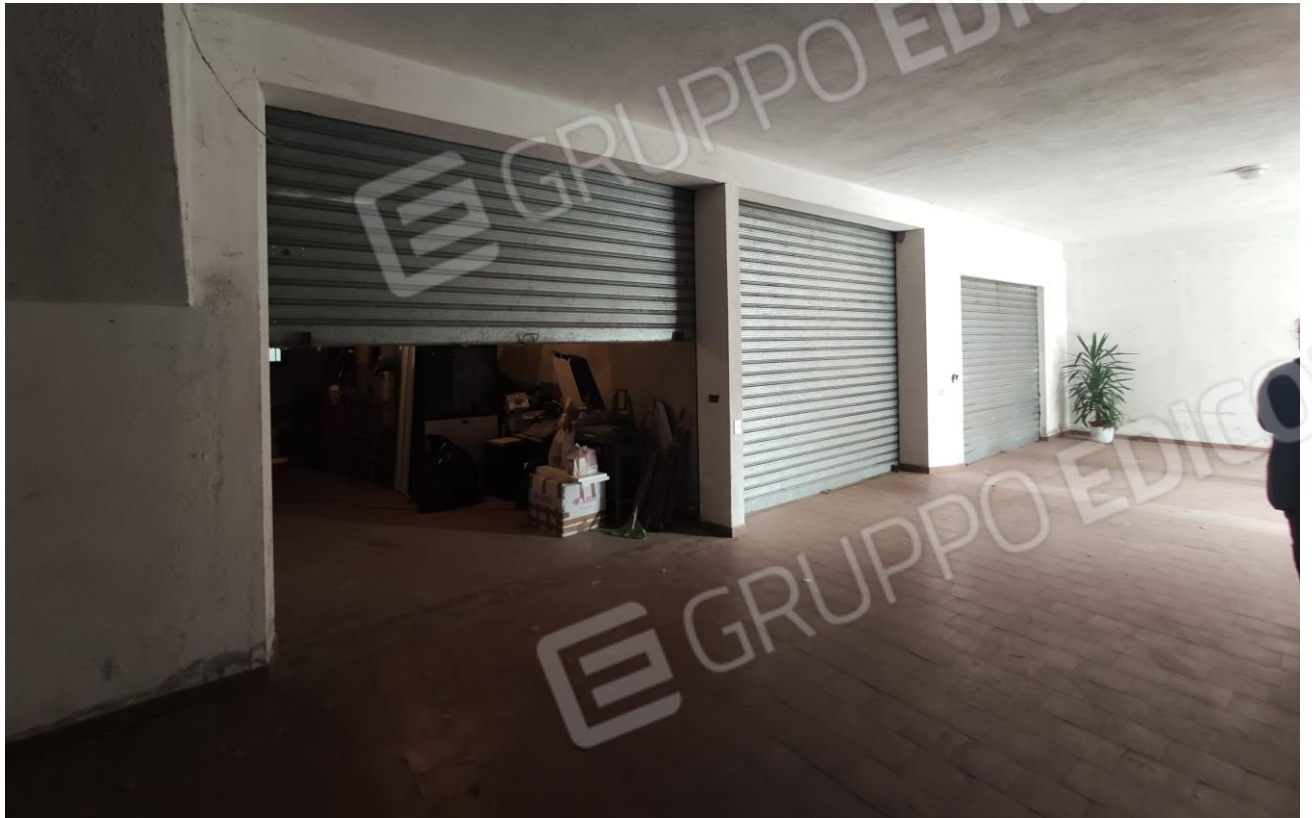
27 – 28 – 29 – 30 – 31. Vedute locale magazzino/deposito piano sottostrada