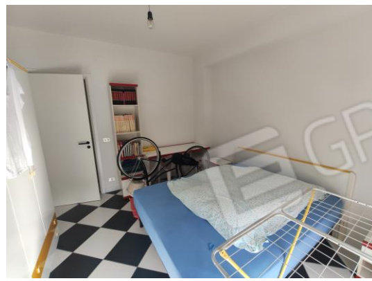
16. Camera 3