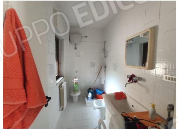
18. Bagno 2