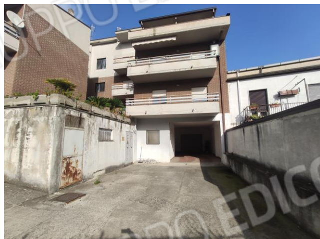
23 – 24. Percorso carrabile verso il piano sottostrada