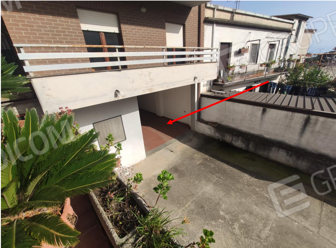
6. Veduta verso l'ingresso carrabile al piano sottostrada, magazzini, per l'accesso al Lotto 2