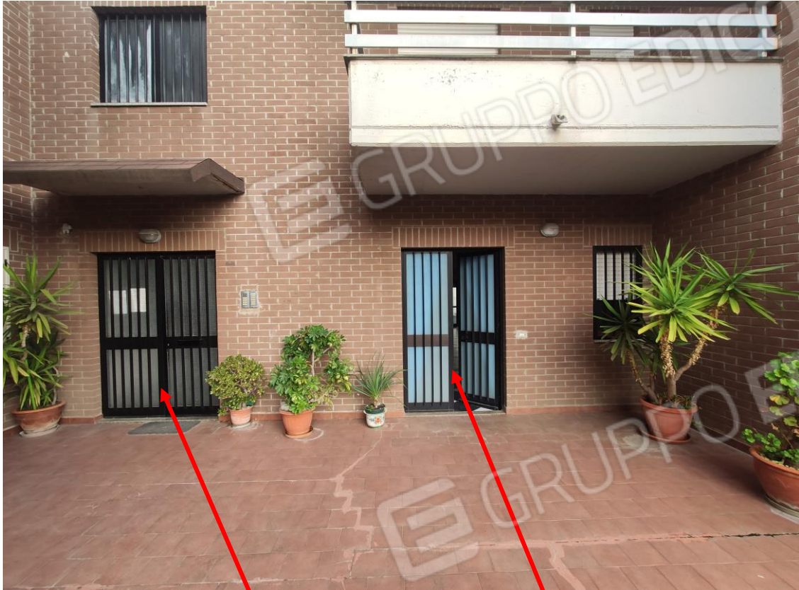
5. Veduta verso l'ingresso principale al fabbricato e verso l'ingresso usuale alla unità immobiliare pignorata