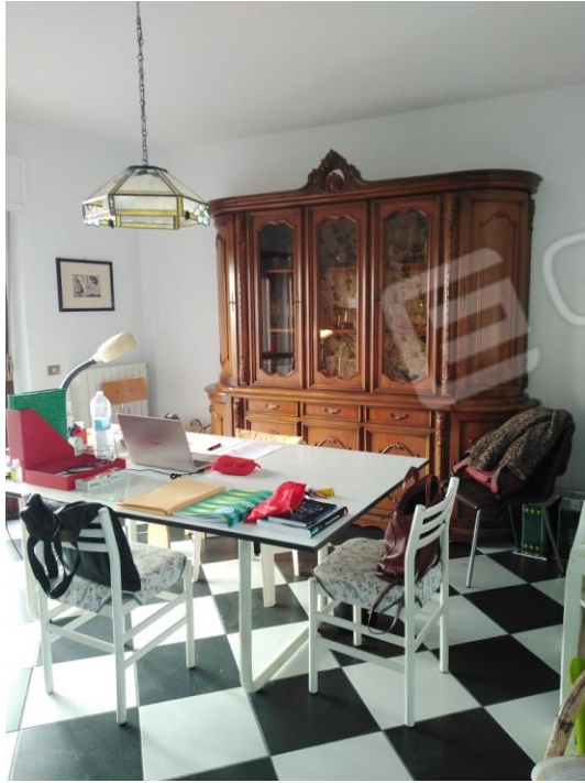
11. Zona Pranzo -Studio