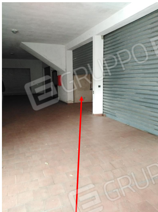
26. Interno piano sottostrada: unità immobiliare in oggetto