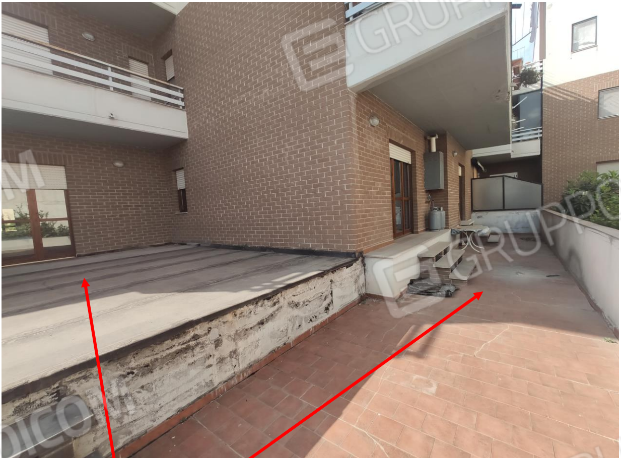
19. terrazzi zona notte e zona giorno su due livelli diversi ma uniti