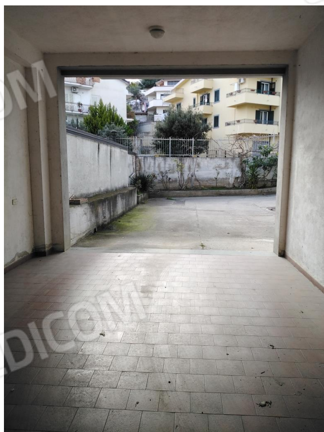
25. Ingresso piano sottostrada