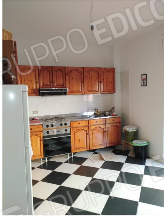
12. Angolo cottura