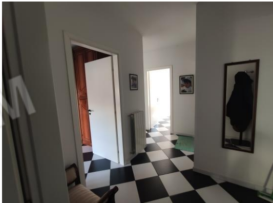
13. Zona notte