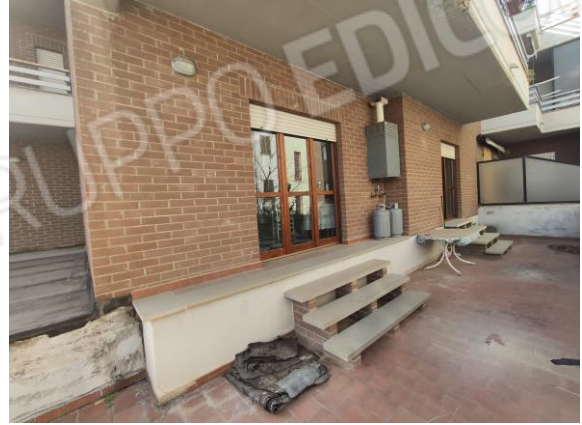
20 – 21 – 22. Particolari terrazzi