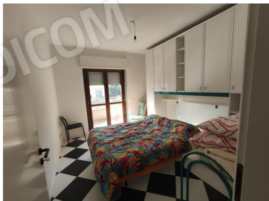
15. Camera 2