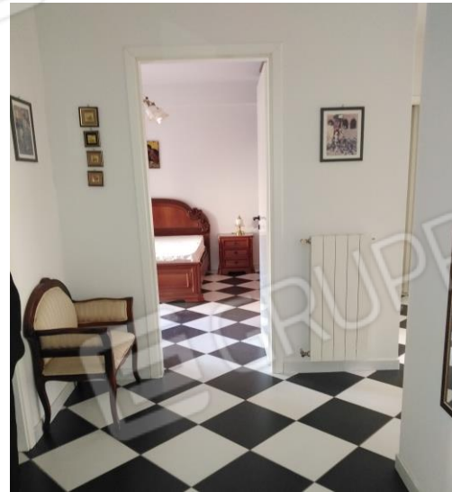
14. Camera 1