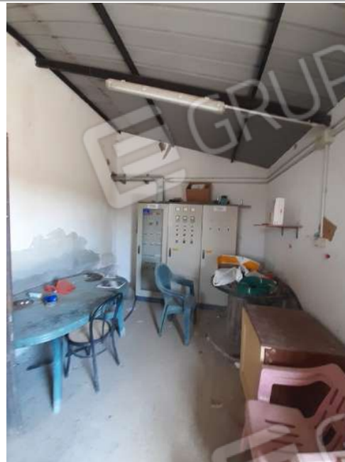
Foto n.16: Impianto d'irrigazione, pozzi e derivazioni; quadro elettrico di comando che ricadono al di fuori del compendio immobiliare