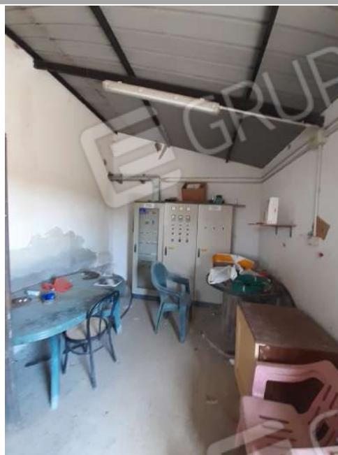
Foto n.16: Impianto d'irrigazione, pozzi e derivazioni; quadro elettrico di comando che ricadono al di fuori del compendio immobiliare