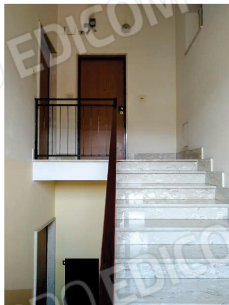
1-2-3: PORTONE DI INGRESSO E SCALE CONDOMINIALI SINO AL PIANO