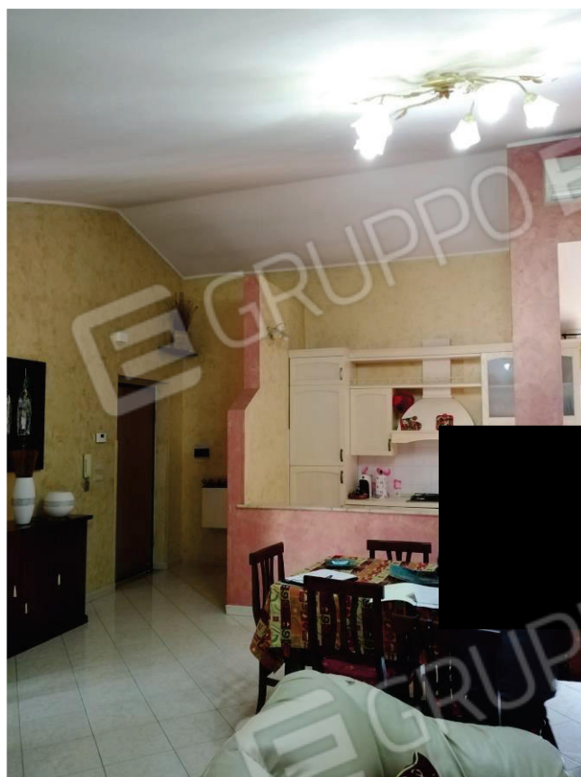
4 - 5: AMBIENTE UNICO SOGGIORNO - PRANZO - ANGOLO COTTURA