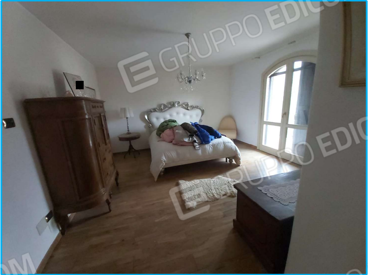
Una stanza da letto al piano primo – ZONA NOTTE