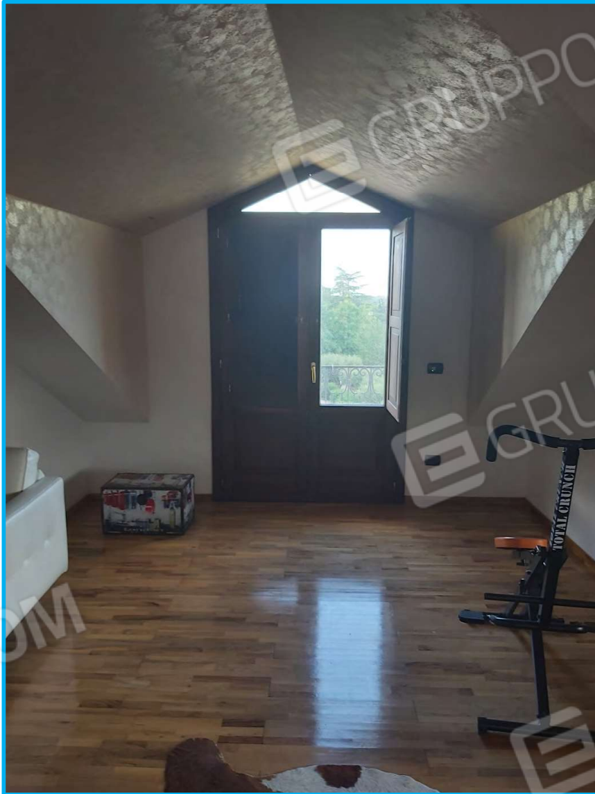
Piano secondo /sottotetto – vista interna, verso uno degli abbaini.