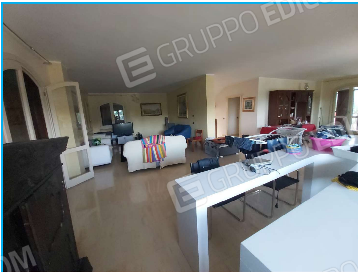
Vista interna, piano terra.