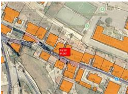
Estratto mappa catastale