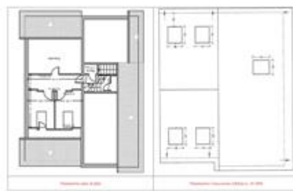
Confronto planimetria stato di fatto e autorizzato (piano sottotetto)