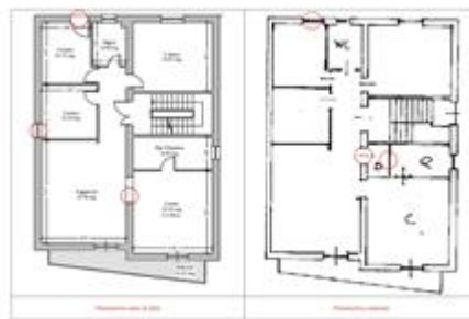
Confronto planimetria stato di fatto e catastale (piano terra) Confronto planimetria stato di fatto e catastale (piano primo)