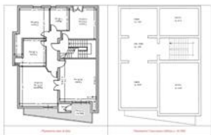
Confronto planimetria stato di fatto e autorizzato (piano secondo)