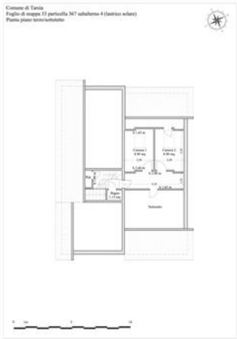
Pianta piano sottotetto

Procedimento di stima: altro (vedi paragrafo sviluppo valutazione).