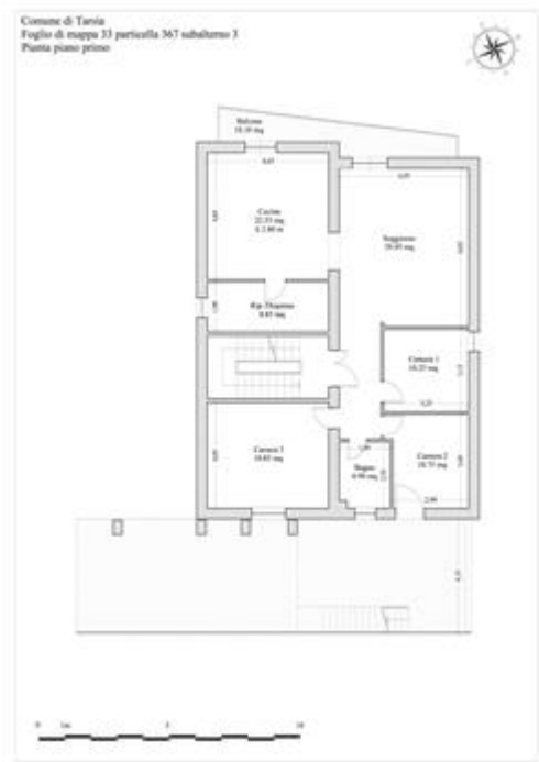
Pianta piano primo

Procedimento di stima: comparativo: Monoparametrico in base al prezzo medio.