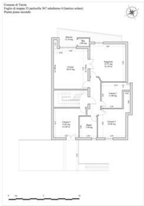
Pianta piano secondo