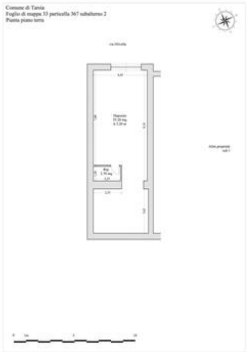
Pianta piano terra

Procedimento di stima: comparativo: Monoparametrico in base al prezzo medio.