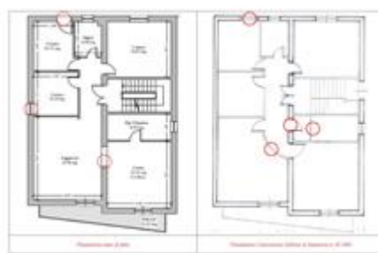
Confronto planimetria stato di fatto e autorizzato (piano primo)