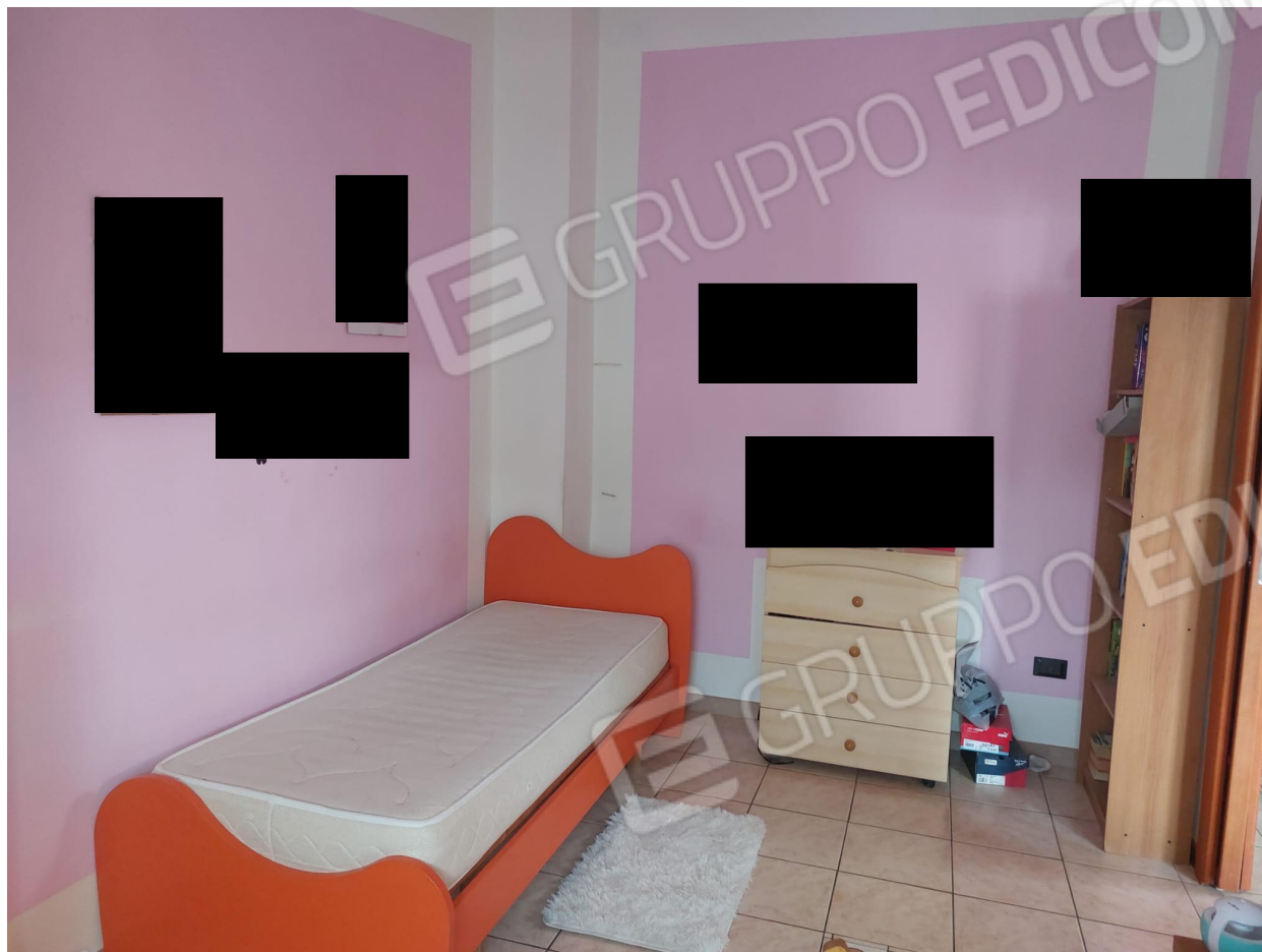
CAMERA LETTO_2 A PIANO 3°