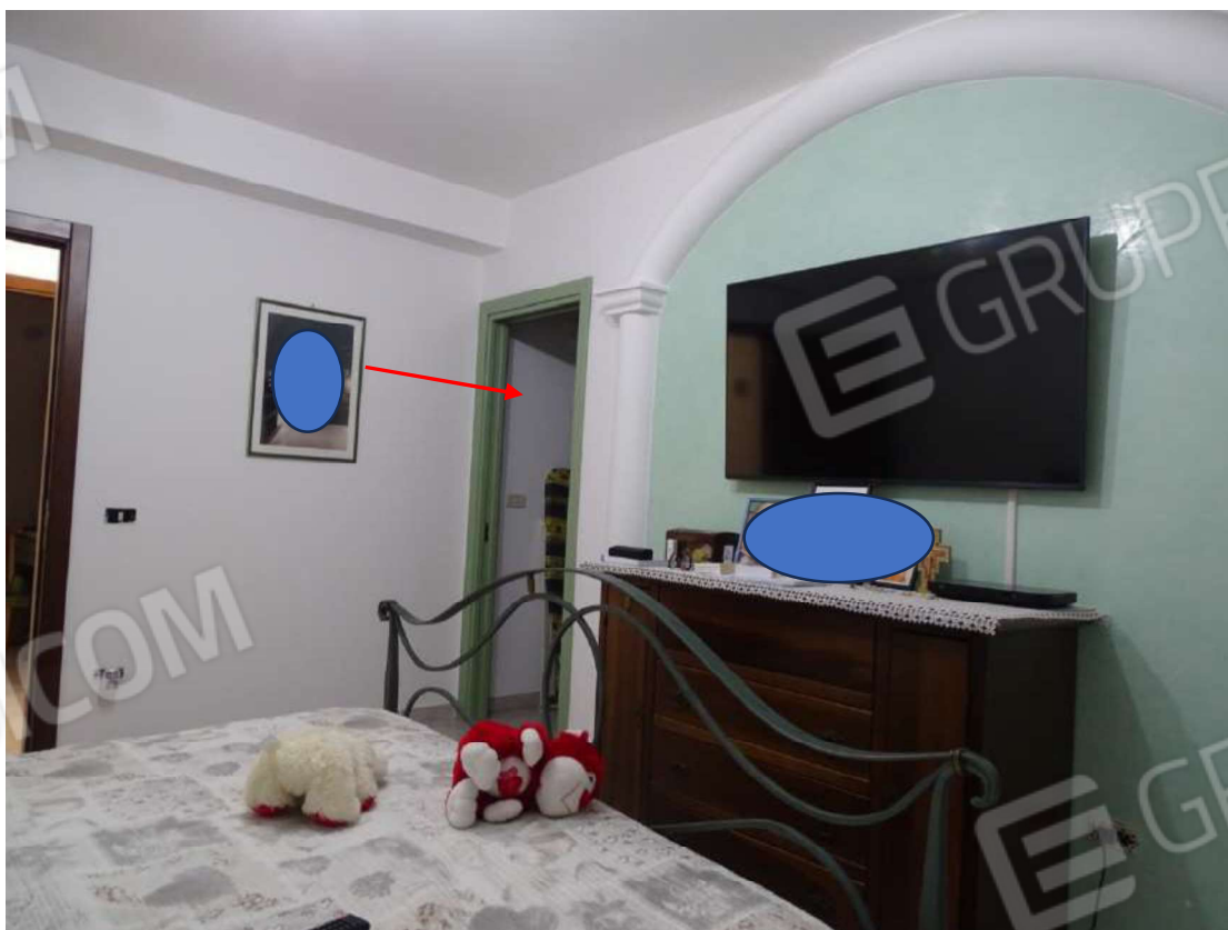
Foto 26 – Immobile “B” – Particolare cabina-armadio camera da letto