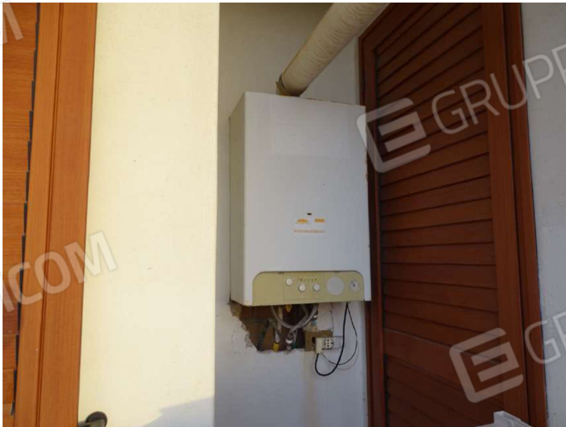
Foto 32 – Immobile “B” – Particolare caldaia a gas acqua sanitaria