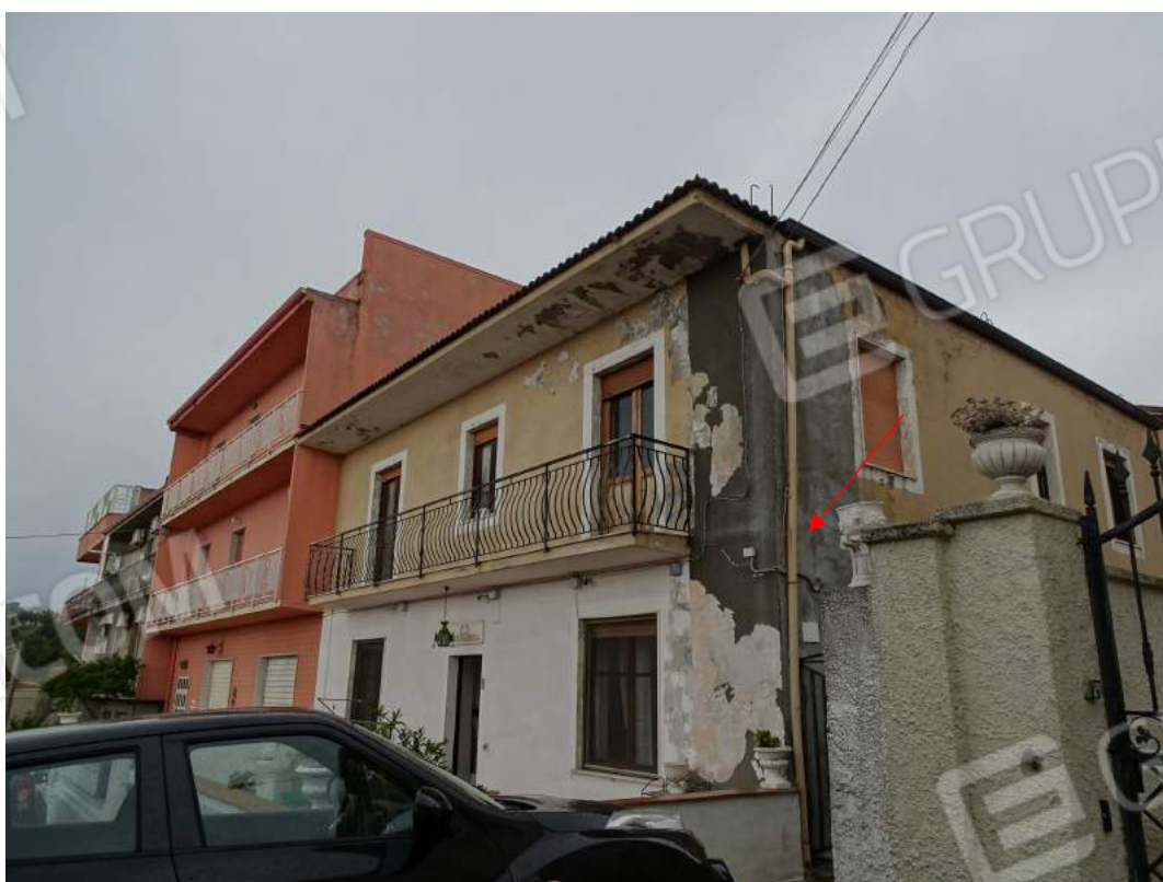
Foto 2 – Particolare immobile con evidenza dei fenomeni di infiltrazione