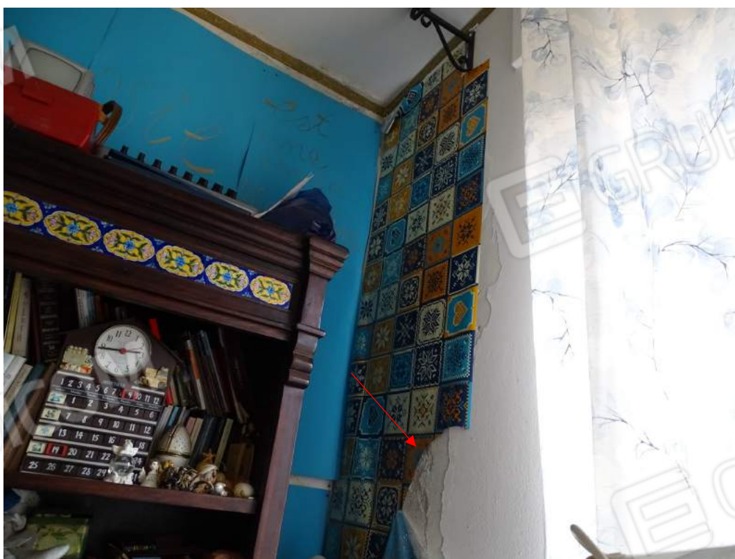
Foto 12 – Particolare della zona interessata da fenomeni di umidità localizzata nello Studio