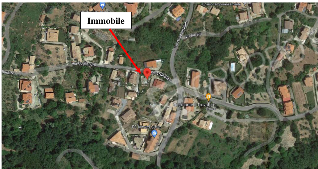
Immagine 4.1_1 – Ortofoto tratta da Google con indicazione di massima del bene in esame

Il bene in esame è ubicato nel Comune di Marano Principato (CS), l'immobile riportato al Catasto terreni del Comune di Marano Principato foglio 6 p.lle 1057 e 1149