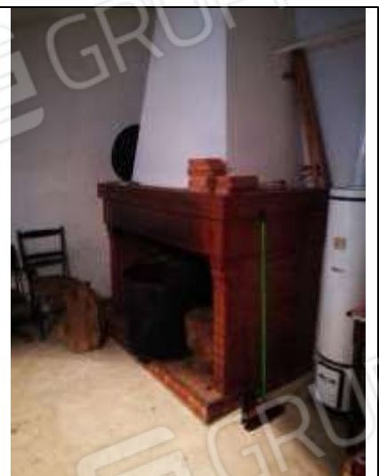
Figura 13 Dettaglio Caminetto soffitta