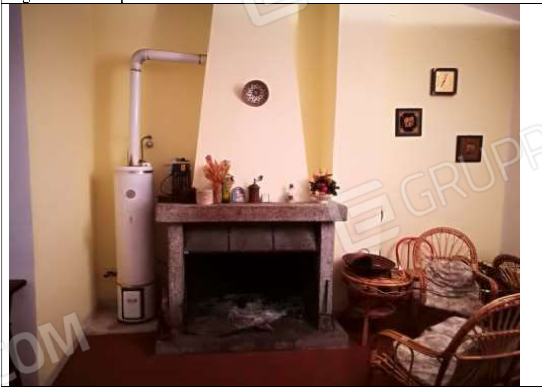
Piano primo sub 2– salone