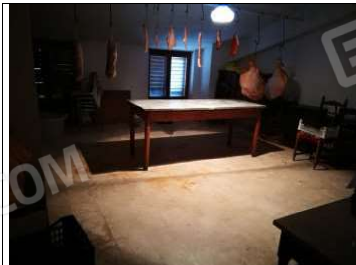
Figura 12 Soffitta